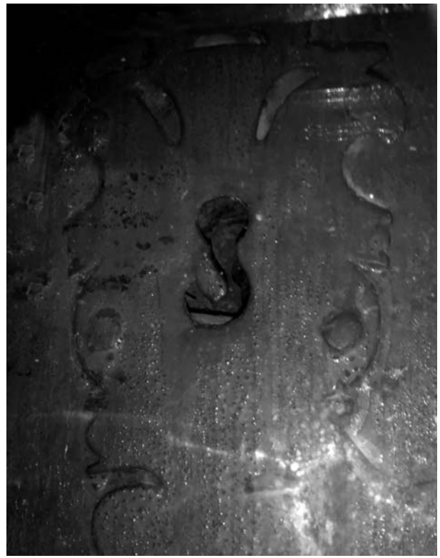
Bocacrau austriacista de la casa del carrer de la Font, 6