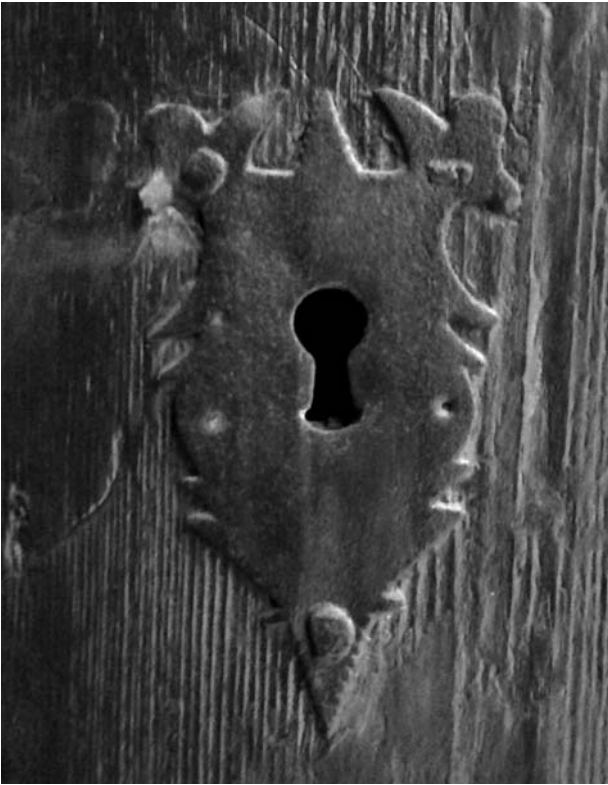
Bocaclau borbònica de la casa de la riera Buscarons, 4