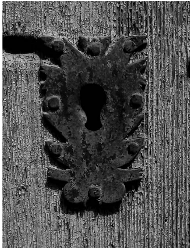
Bocaclau austriacista mutilada, al carrer Romaní, 13