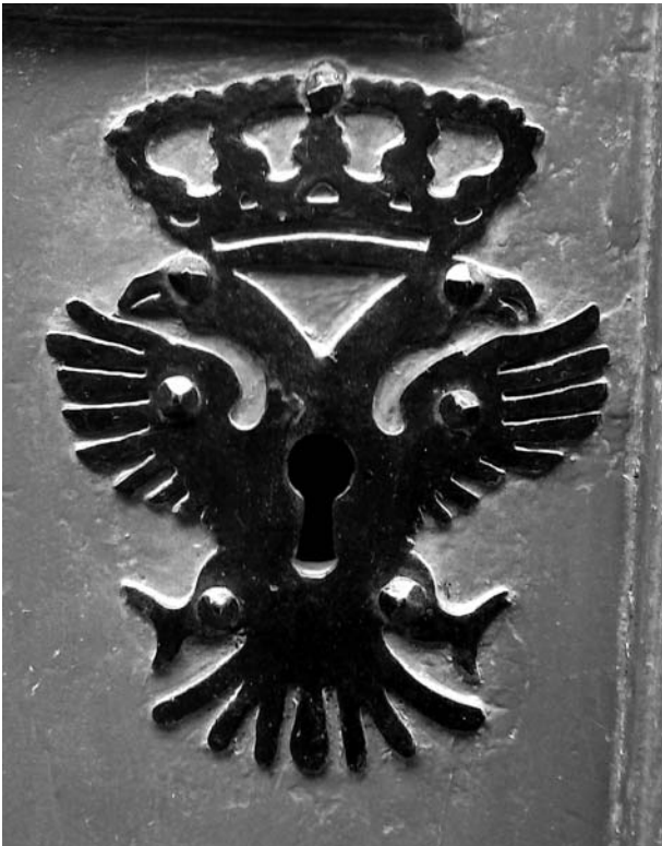
Bocaclau austriacista de la casa del carrer Ample, 7