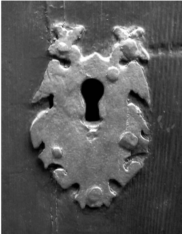
Bocacrau austriacista de la casa del carrer Baix Abell, 4