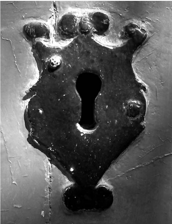
Bocaclau borbònica de la casa del carrer de la Font, 9