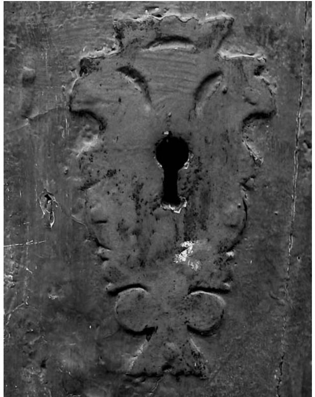
Bocacrau austriacista de la casa del carrer de l'Església, 21

els ferrers locals, seran més curoses i treballades, sempre d'acord amb l'habilitat de l'artesà. En el cas dels partidaris de l'Arxiduc Carles d'Àustria, ja hem dit que eren panys que es representaven amb una àliga bicèfala rampant. Tenim un exemple força treballat, amb corona imperial excel·lentment definida, retallada i calada amb traç simple a la casa del carrer Ample, número 7. Una altra mostra, ben