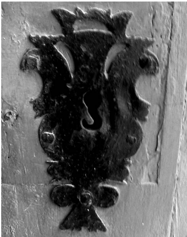
Bocacrau austriacista de la casa del carrer de l'Església, 15