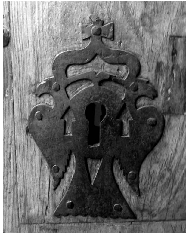
Bocaclau austriacista de la casa del carrer de la Font, 12

desembarcar a Barcelona i van prendre la fortalesa de Montjuïc, fins llavors a mans dels borbònics. S'encetava, d'aquesta manera, un conflicte de gairebé deu anys de durada.