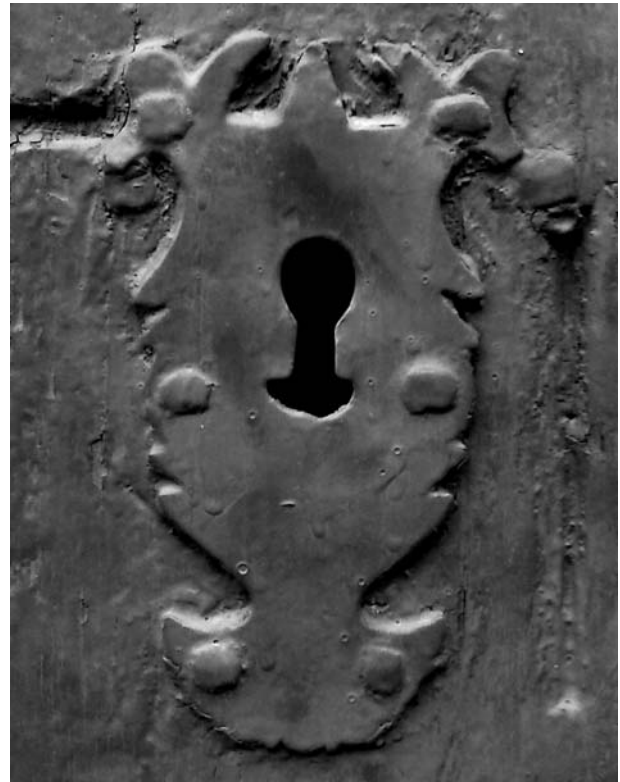
Bocaclau borbònica al carrer Jaume Pagà, 17

de Felip V. 3 Les bocaclaus borbònics reproduïen la flor de lis, la belle fleur . D'aquí surt la paraula, en anglès, beauty fleur , que deriva a botiflers, que era tal com es coneixien als partidaris de Felip V al Principat. De panys borbònics se'n conserven al carrer de la Font, 9, a la riera Buscarons, 4, al carrer Jaume Pagà, 17 i al carrer Església, 22.