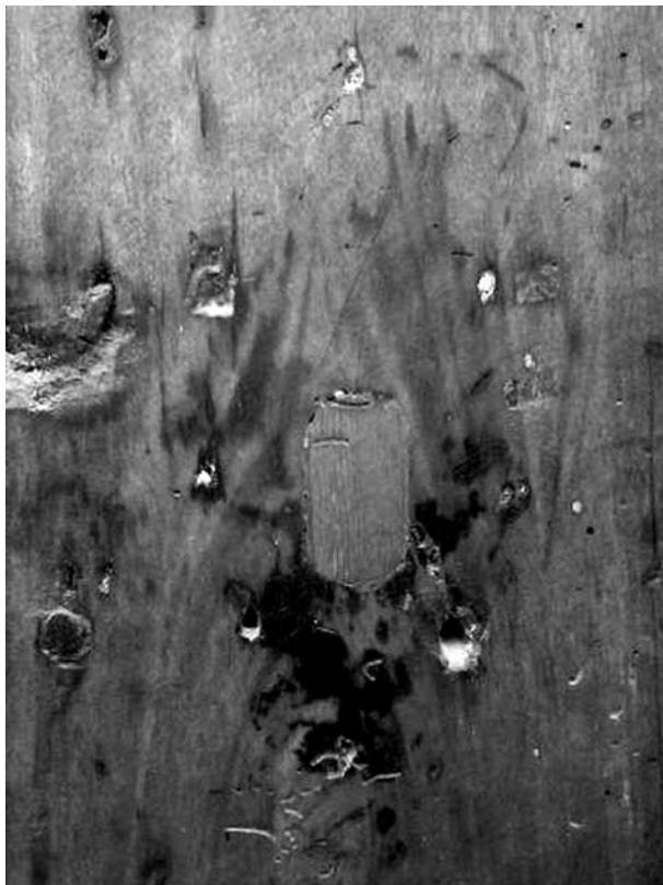
Marca d'una bocaclau austriacista al carrer Caldeta, 12

Per evitar cridar l'atenció de les noves autoritats, els mateixos propietaris dels habitatges van anar retirant part de les bocaclaus austriacistes de les portes. En tenim un exemple al carrer Caldeta, on encara hi ha les marques de la planxa a la fusta de la porta. Aquells que van voler aprofitar les plaques, van optar per desfigurar-les, com podem veure a la casa del carrer Romaní, 13, i així s'evitaven problemes. Ara bé, quan Catalunya quedà tota sota el control de l'exèrcit del rei Felip V, de ben segur que les bocaclaus austriacistes no deurien tenir però massa interès pels repressors, ja que les poques mostres que han arribat als nostres dies no haguessin