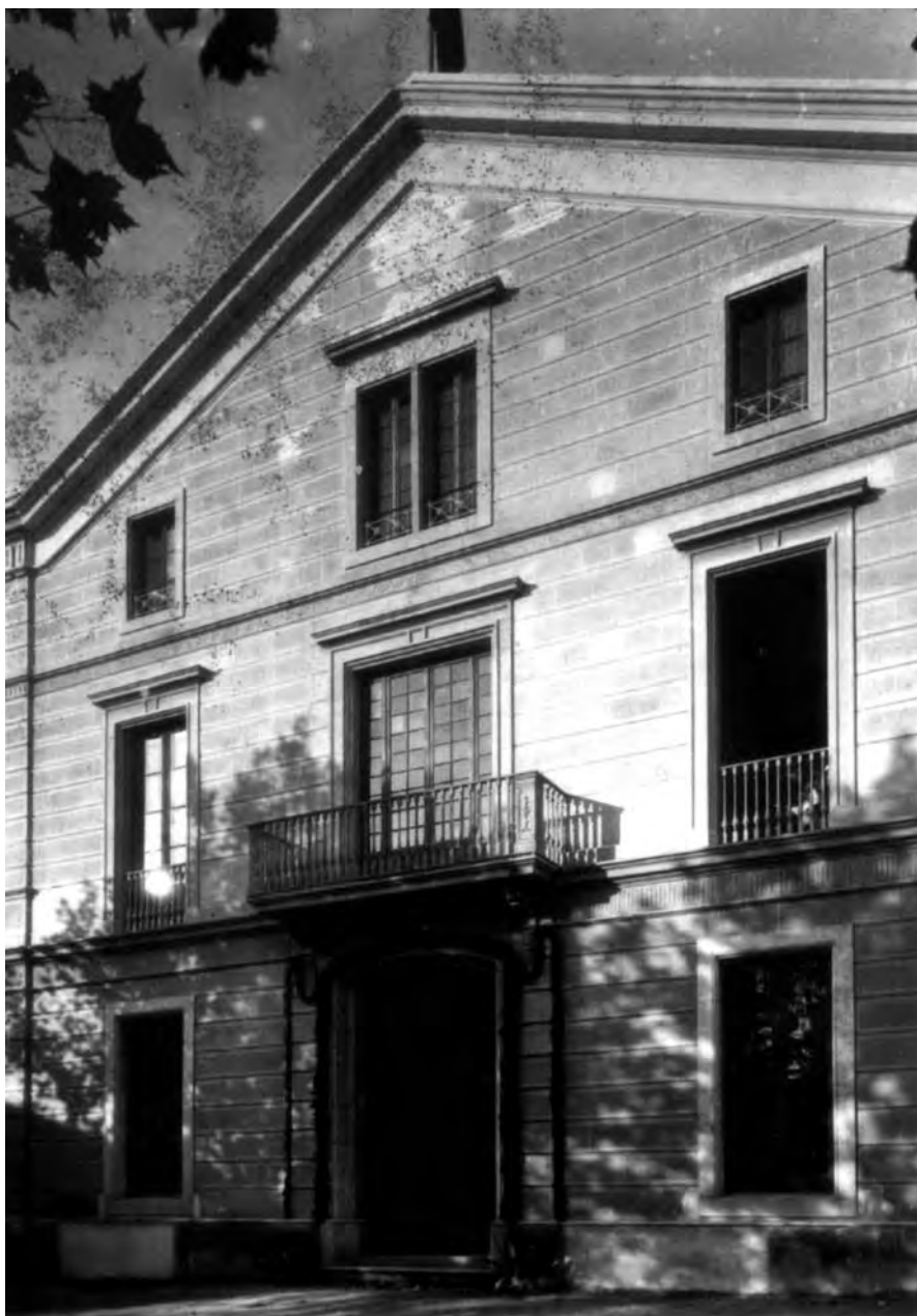
Façana de l'Escola de Teixits el dia de la inauguració (CEC)

El 30 de març de 1920 es va fer la cessió a la Mancomunitat i després de rehabilitar-la per a l'ús docent, i solventar diferents problemes econòmics amb l'Ajuntament monàrquic, 24 el 19 de novembre de 1922 s'inaugurava l'Escola d'In-