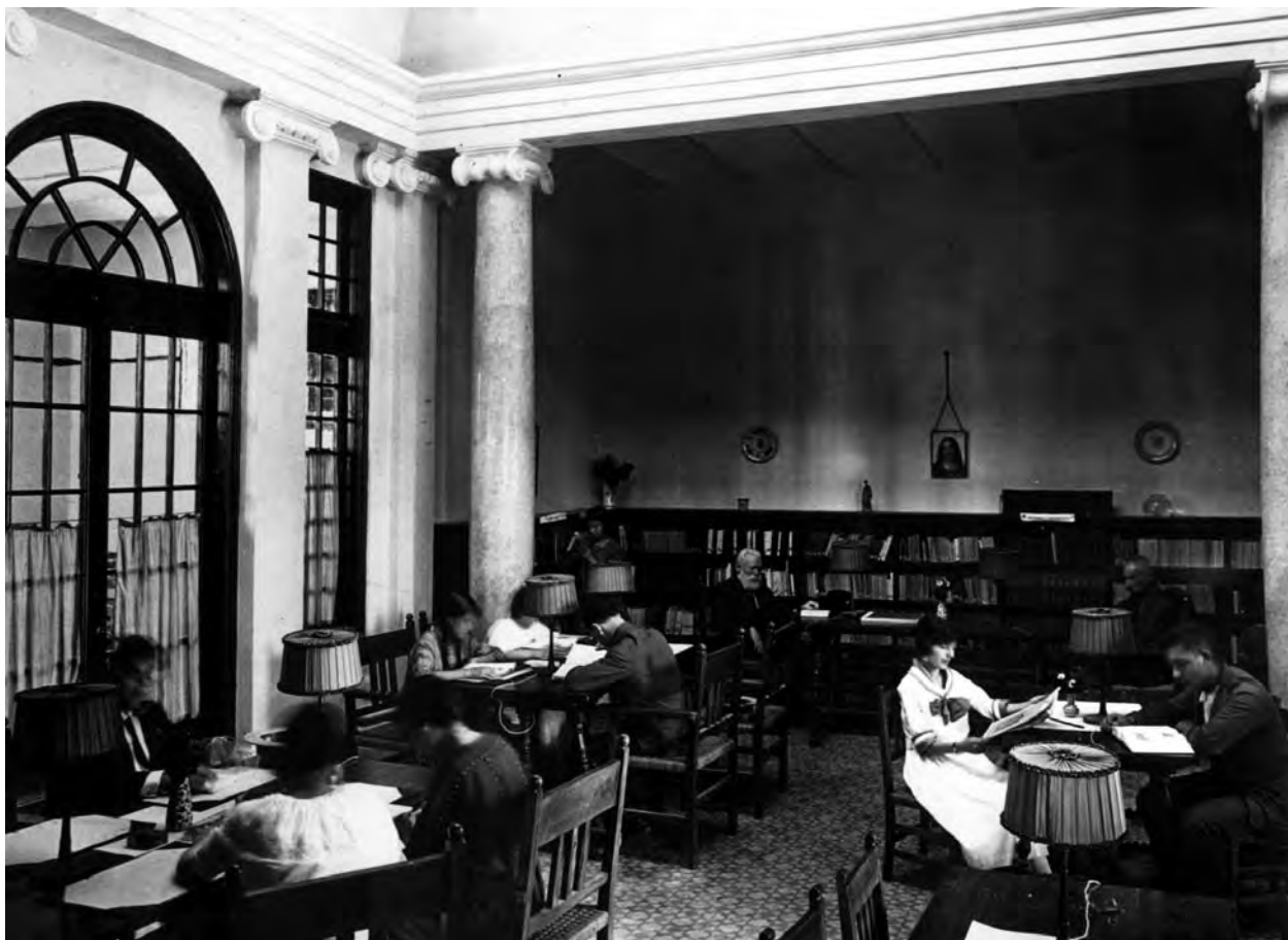
Sala de lectura de la biblioteca de Canet als anys 20