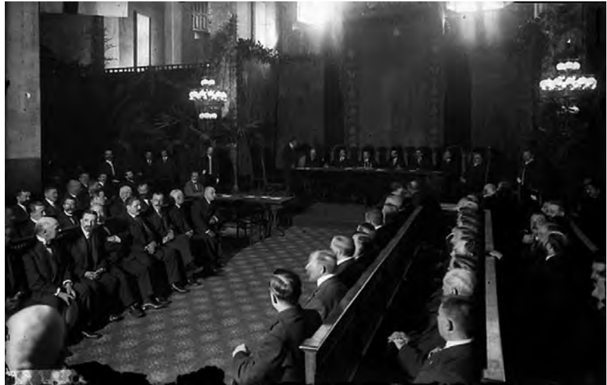
Proclamació d'Enric Prat de la Riba com a president de la Mancomunitat

El juny de 1913 es va reactivar el procés al començar el debat al Senat, però la dimissió de Romanones a l'octubre va deixar un buit de poder i les Corts dissoltes. Davant la nova paralització, a Catalunya s'organitzaren tres «diades regionalistes», a Falset, Cornudella de Mont-