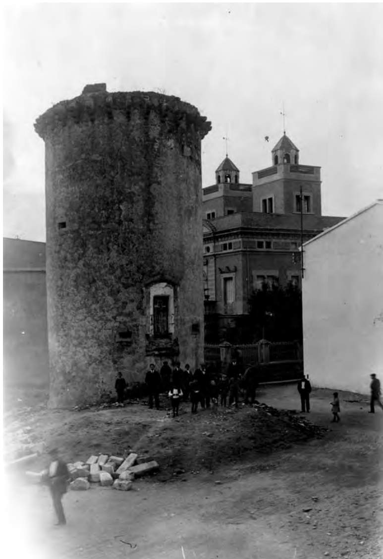
Torre de can Macià, l'any 1918, quan la casa ja havia estat enderrocada (CEC)

A inicis de segle XX a Canet encara es mantenien dempeus la Torre de Mar i la Torre Macià, dues construccions defensives del segle XVI. La Torre de Mar, situada al capdavant de la riera de la Torre havia de ser enderrocada l'any 1914 per reformar la carretera, però l'alcalde Marià Serra va entrevistar-se amb el director General del Ministeri d'Obres Públiques, Pere Garcia Faria, per evitar que la carretera passés per damunt de la torre. 25 Serra, que llavors era alcalde de Canet de Mar, va convèncer el Ministeri, però a canvi hagué de facilitar l'espai necessari per desdoblant la carretera i com que no n'hi havia,