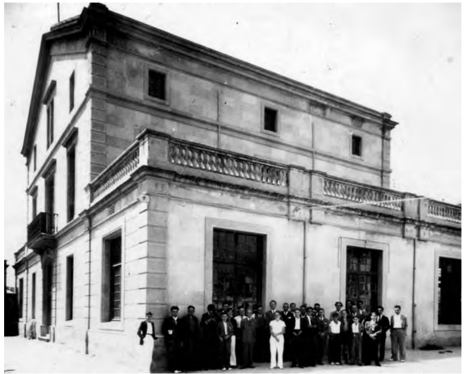
L'Edifici de l'Escola de Teixits, als anys 30 del segle XX.