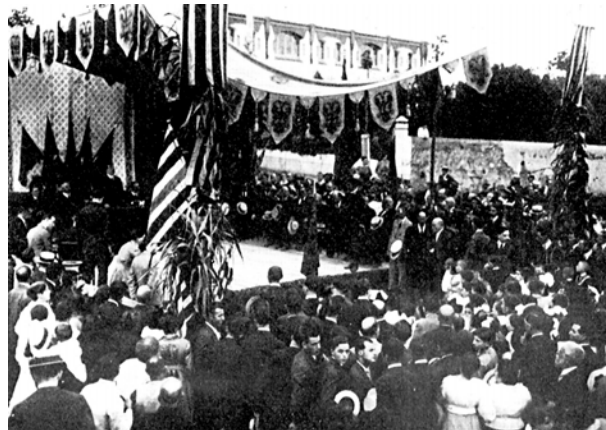
Imatges de l'acte de col·locació de la primera pedra de la biblioteca de Canet, el juliol de 1918