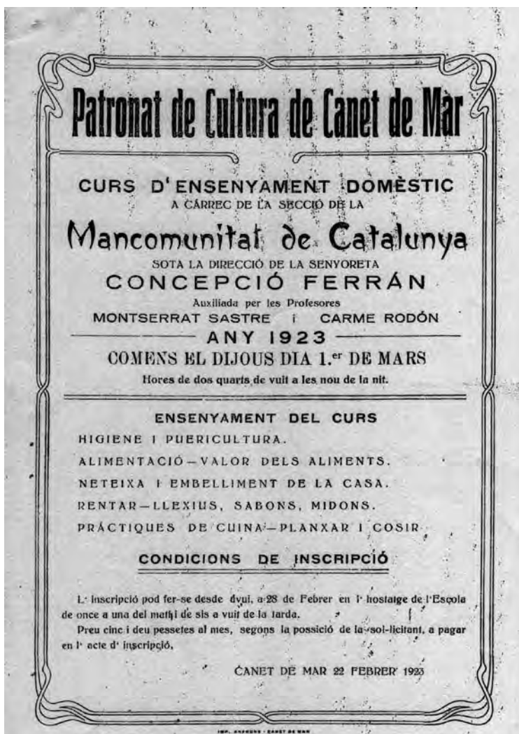
Cartell del curs d'ensenyament domèstic de la Mancomunitat a Canet

La Mancomunitat de Catalunya també creà el Servei de Sanitat a partir de 1920 per combatre les epidèmies de grip, paludisme i tuberculosi. La vacuna antitífica era elaborada pel mateix servei i subministrada als ajuntaments que la demanessin i no envà a Canet es van realitzar diferents campanyes de vacunacions així com d'anàlisi de les aigües.