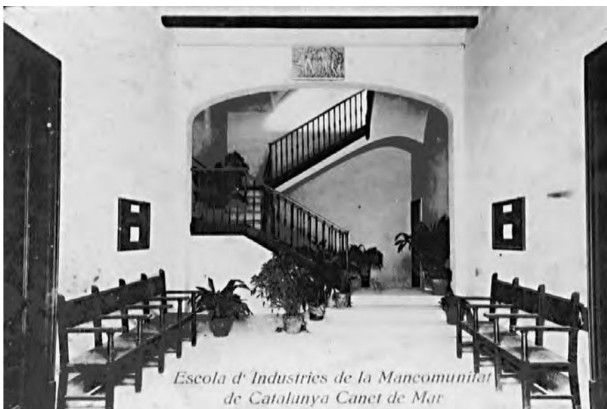
Vestíbul d'entrada a l'Escola de Teixits, poc després d'inaugurar-se