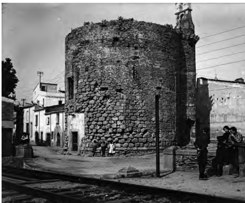
Torre del Mar, als anys 10 del segle XX. (CEC)

l'Ajuntament de Canet de Mar hagué d'expropiar algunes cases del voltant.