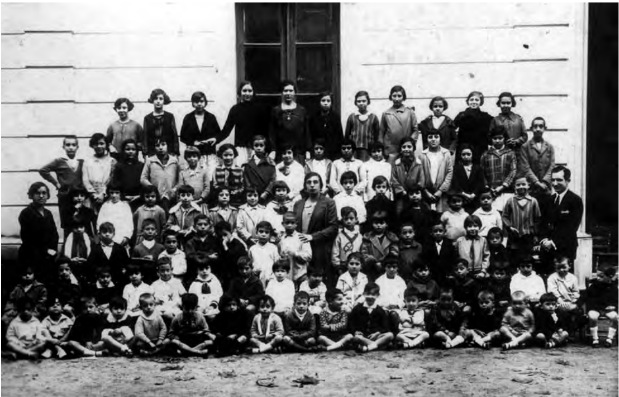
Els alumnes de l'Escola Montessori de Canet, l'any 1928