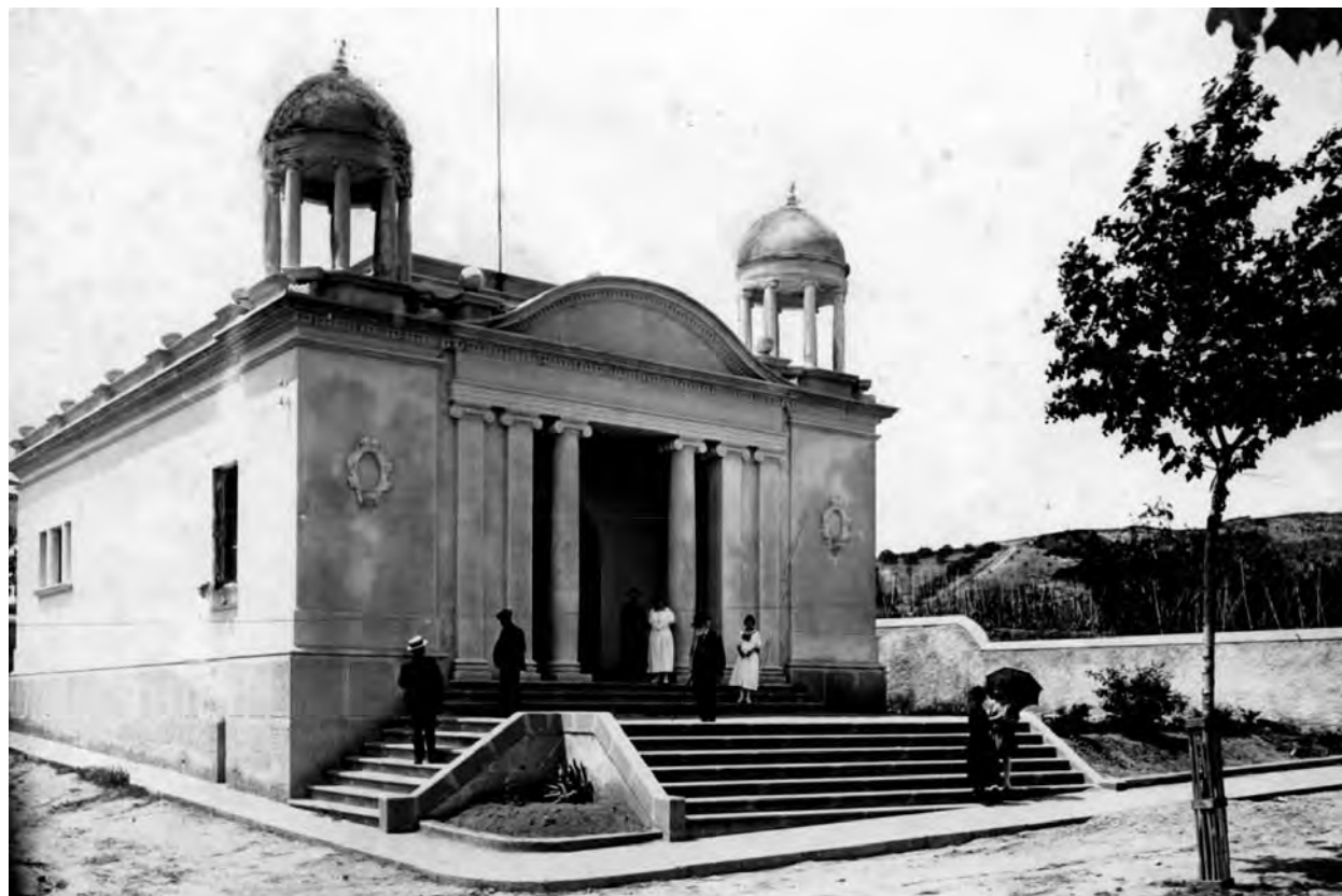
La biblioteca de Canet, als anys 20 (BPGP)