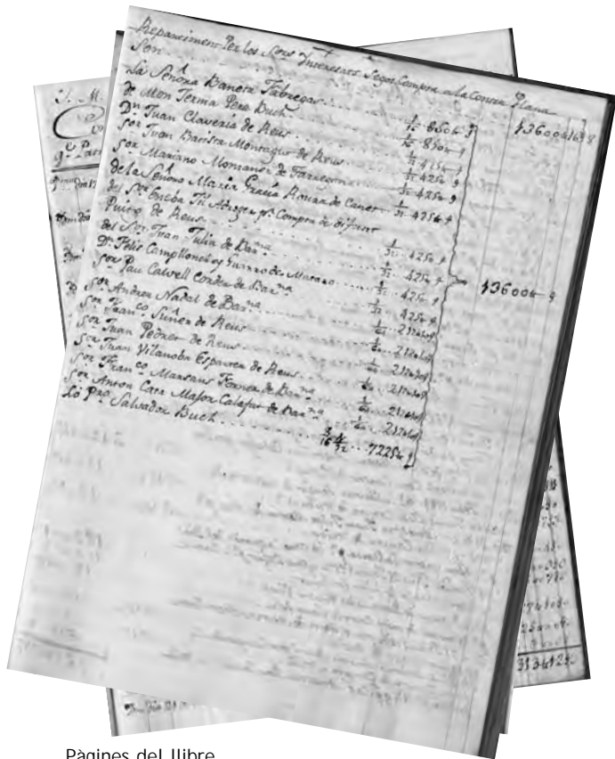
Pàgines del llibre