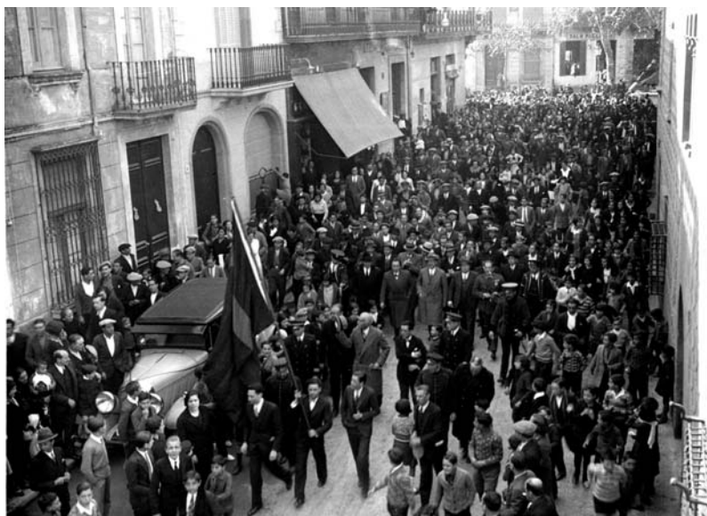
Vinguda a Canet del president de la Generalitat, Francesc Macià, el 1932

I novament aquest esplendor econòmic ens va conduir a una nova renaixença cultural, sobretot a partir dels anys 60. I un altre cop Canet vam ser un exponent essencial d'aquesta renaixença del país, sobretot amb la nostra important aportació dins del moviment de