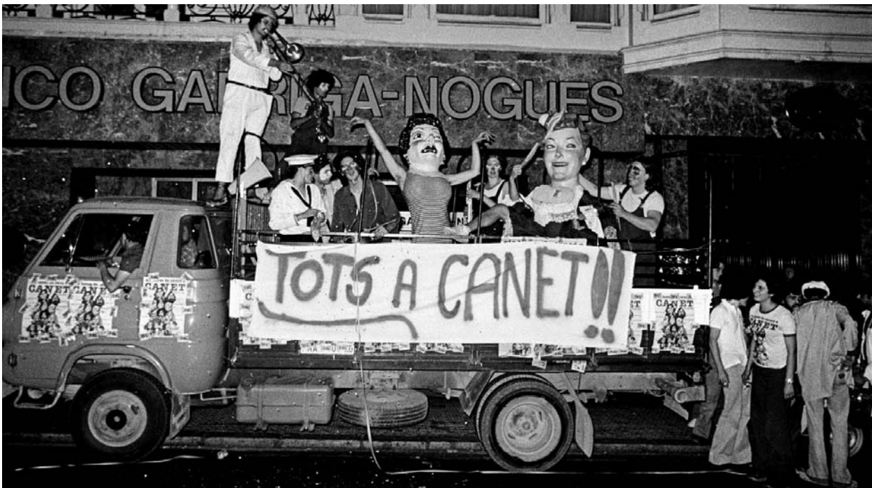
Imatge de promoció de les Sis Hores de Canet de l'any 1977

l'anomenada Nova Cançó. Aquest nou despertar català, també novament, va culminar als anys 80 amb la restauració de l'autogovern de què gaudim avui en dia.