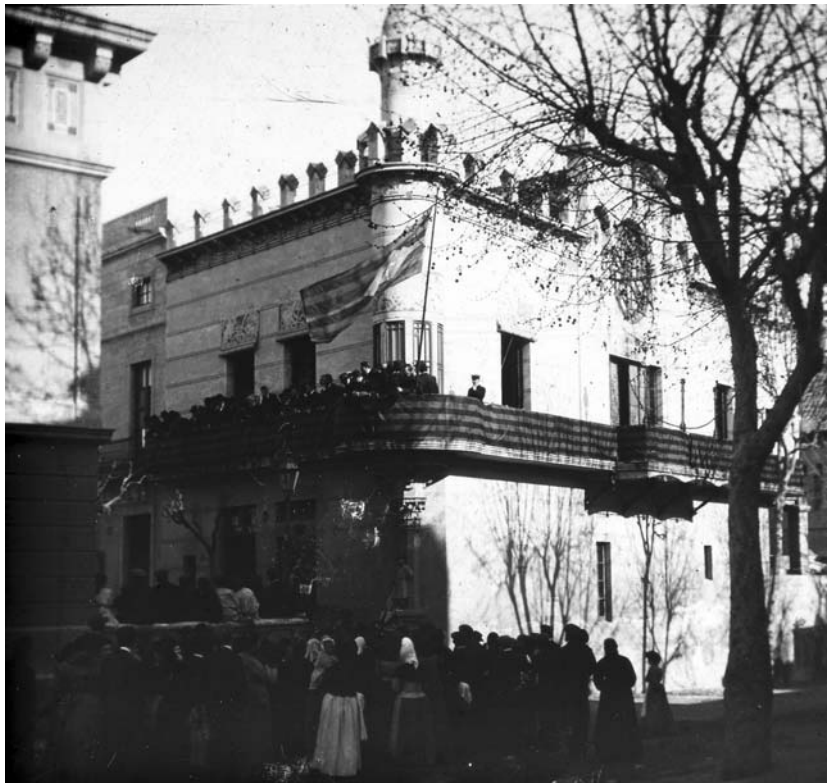
Miting de Solidaritat Catalana al Foment Catalanista, l'any 1907 (CEC - Fons Carbonell)

Malauradament una nova i molt cruenta guerra -la del 1936- va tornar a sacsejar el país. I tot i que aquest cop va ser una guerra civil que ens va fer enfrontar els mateixos catalans, i que per tant hi va haver molts catalans que es van poder considerar guanyadors d'aquella guerra, sens dubte Catalunya com a país va tornar a perdre, ja que li van tornar a arrabassar els