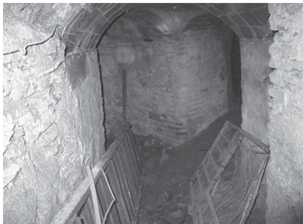
Interior del refugi del carrer Sant Pere, l'any 2005

Era un refugi cèntric i accessible. Es va obrir un pas de comunicació entre la riera Gavarrà i el carrer Rafael de Campalans, que facilitava l'accés al refugi als veïns del centre de la població, que va ser nomenat carrer 19 de juliol del 36. El refugi tenia dues entrades: una davant