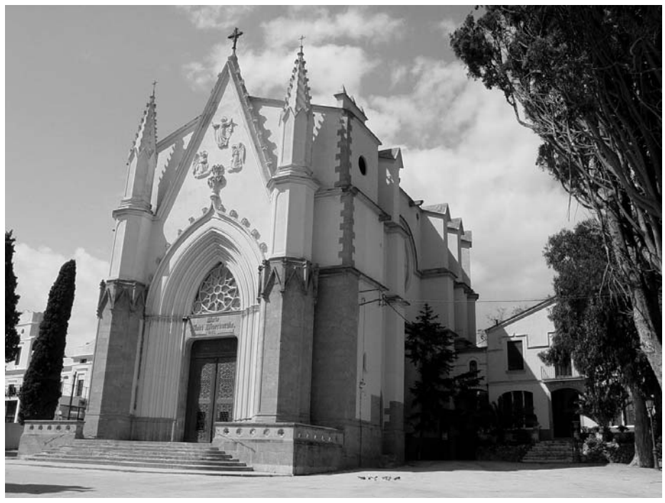
Imatge exterior del Santuari en l'actualitat

Tornant al tema del Santuari, cal remarcar el fet que una població de les proporcions del Canet de mitjans del segle XIX, encarregués el disseny d'un nou temple a l'arquitecte de més prestigi i renom de la seva època. També resulta interessant i sorprenent que