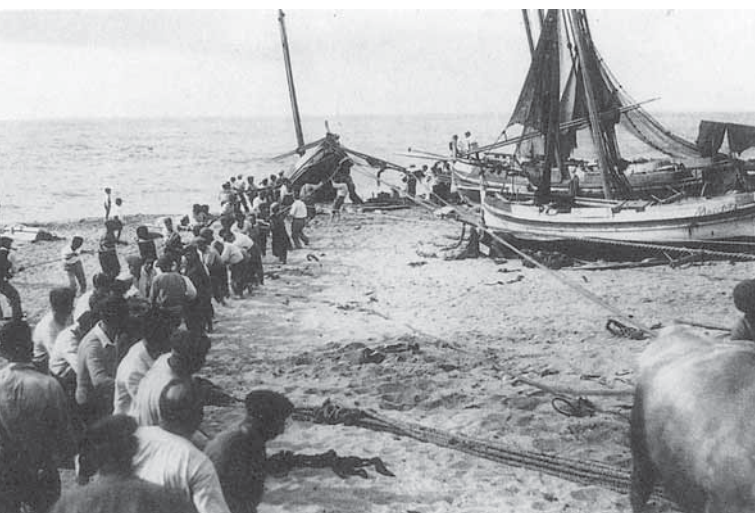
Fotos corresponents a l'anomenat «Temporal de les desgràcies» (6 de gener de 1906)

es posava de manifest a cada ple de l'Ajuntament. En aquest marc de forta rivalitat municipal, la lloable iniciativa d'ajudar els damnificats del temporal es va polititzar ràpidament. El bàndol catalanista, en aquell moment a l'oposició municipal, va agafar la iniciativa de les col·lectes populars; el seu braç civil, representat per la societat recreativa canetenca del Foment Catalanista, va portar-ne la veu cantant deixant en evidència a un Ajuntament monàrquic-conservador que va reaccio-