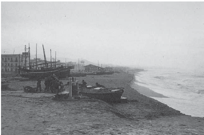
Temporal de migjorn de l'hivern de 1958. Arxiu Família Cabot

El passat dia 31 de gener de 2011, l'home del temps de TV3 anunciava que la pertorbació que feia uns quants dies es passejava pel nostre país marxava definitivament Mediterrani enllà; ho feia després d'haver deixat una emblanquinada de neu al Montseny, algunes volves a les planes interiors i uns dies amb un vent glaçat. A Canet, com a la resta del Maresme, aquest mal temps, anunciat amb antelació, no va passar d'unes roines i unes gelades de matinada; un temps habitual i gens estrany en aquests dies del mes de gener, pels vols