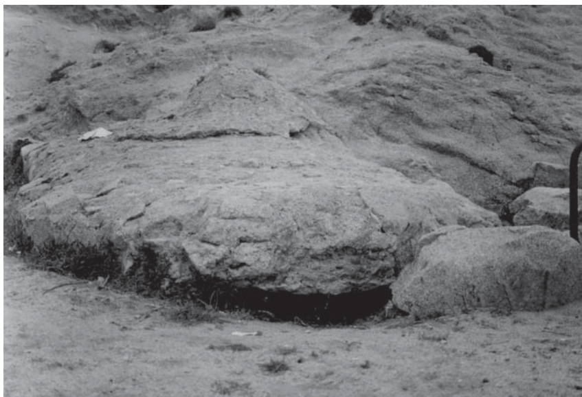
Visió de la finestra per on sortien les metralladores. Fotografia de l'any 1999