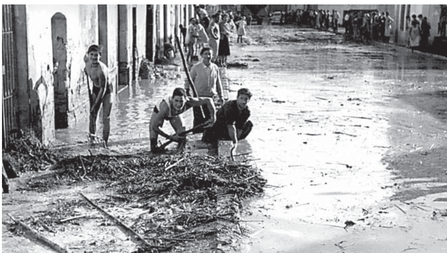
Vista de la barriada de Sant Roc, escenari dels personatges ressenyats en aquest article