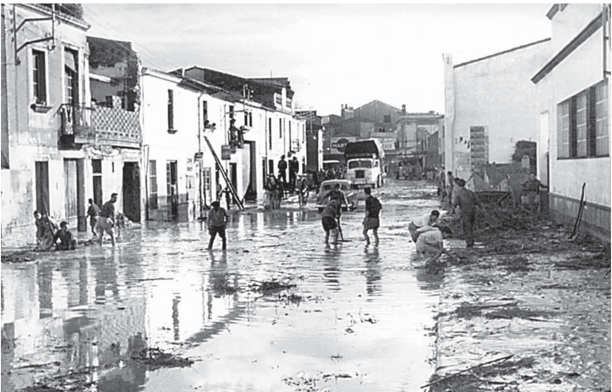
El barri de St. Roc. La font de la qual s parla en aquest article estava al marge dret de la foto, exactament allà on hi ha el carro desenganxat.