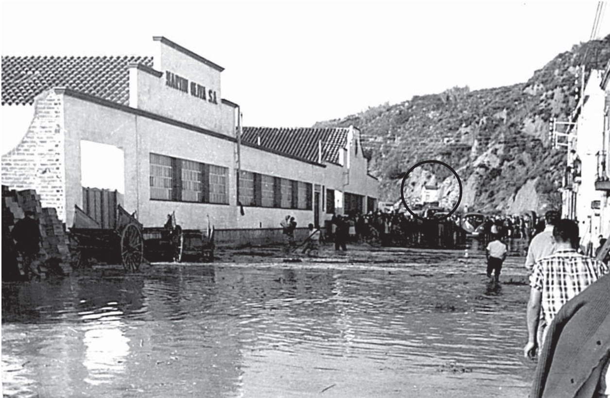
Barri de Sant Roc (inundat) amb la barraca d'en Pepeta Pons al fons