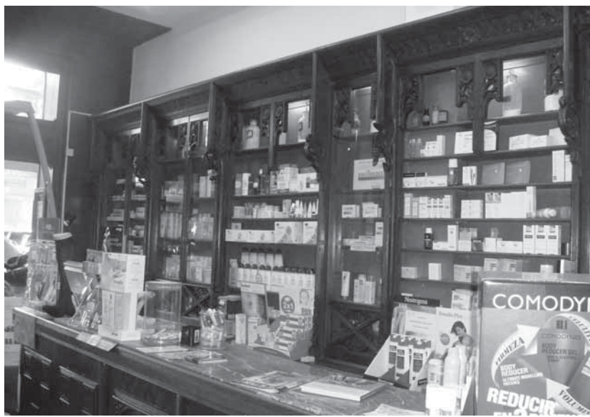
Malgrat tots els canvis, la farmàcia segueix respirant avui l'ambient modernista

pràcticament tots els elements decoratius del mobiliari dissenyat fa més de cent anys per Lluís Domènech i Montaner, les prestatgeries modernistes i el taulell, si bé aquest es va modificar i ampliar posteriorment. No van tenir tanta sort les làmpades modernistes i els aplics que il·luminaven la botiga, que amb el temps i tants propietaris van acabar desapareixent. També s'ha malmès la decoració floral de les parets i el terra original a més a més del cassetonat de fusta que avui es troba camuflat per un sostre fals.