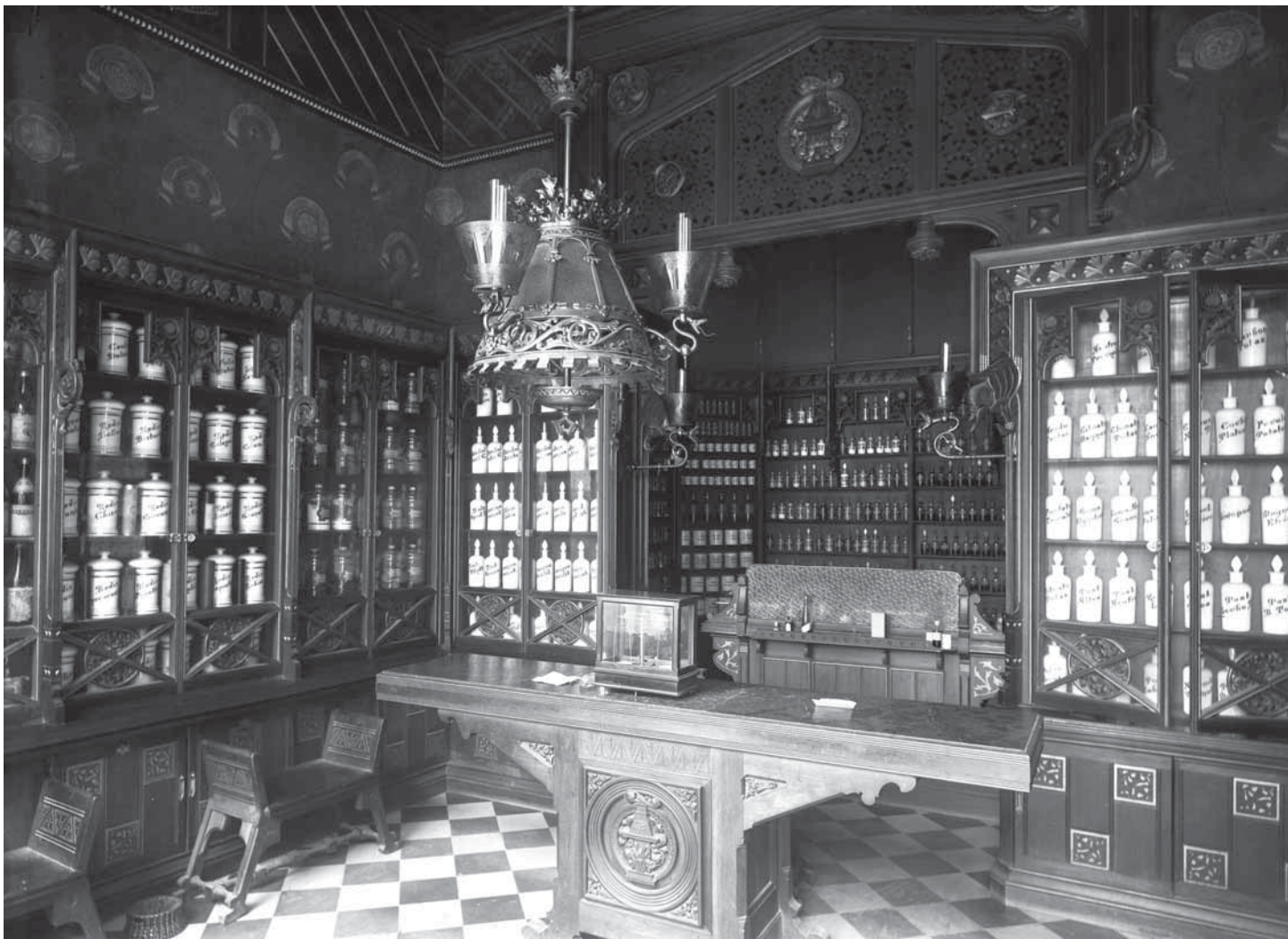
L'antiga farmàcia Duran i España, en una fotografia de l'any 1903

El modernisme ha deixat veritables mostres artístiques a les farmàcies d'arreu del país. Exemples com la desapareguda Farmàcia Gibert, la Farmàcia Guinart, la Farmàcia Sañé -avui Casaus-, la farmàcia Madroñal, la Farmàcia d'Antoni