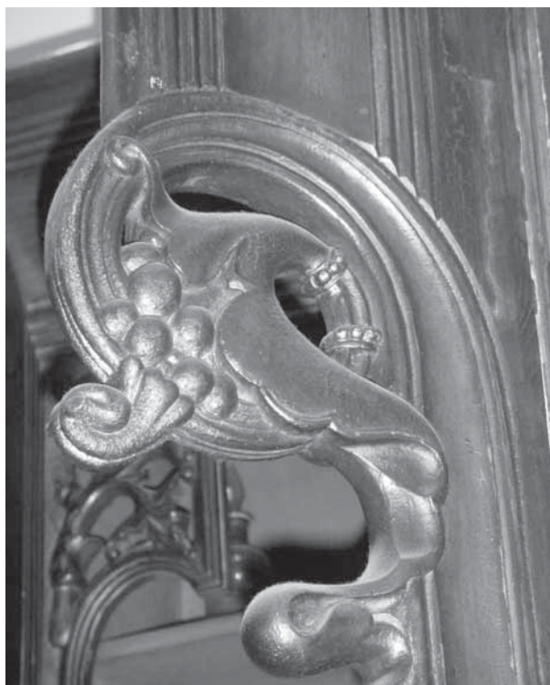
Tota la fusteria escultòrica va estar feta pels germans Viladevall

L'arquitecte va esbossar també un cassetonat de fusta per al sostre, que comptava amb elements decoratius amb pa d'or que va realitzar el prestigiós pintor i decorador Marcel·lí Gelabert, autor també, juntament amb Lluís Bru, de la decoració de l'esmentada