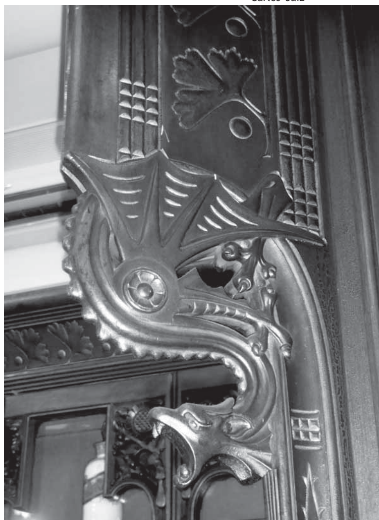
Una interpretació del bastó d'Esculapi, a la farmàcia Duran