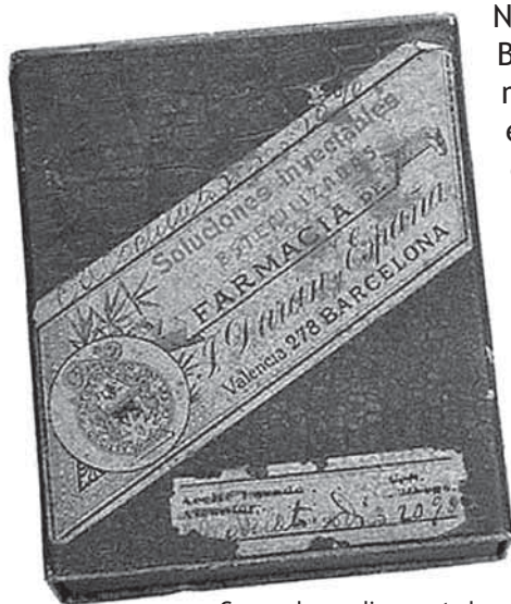
Capsa de medicament de la farmàcia Duran, amb el medalló dissenyat per Domènech i Montaner