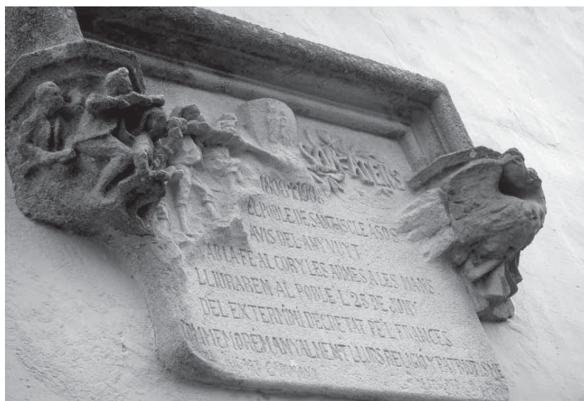
Placa commemorativa de la Guerra del Francès, a Sant Iscle de Vallalta