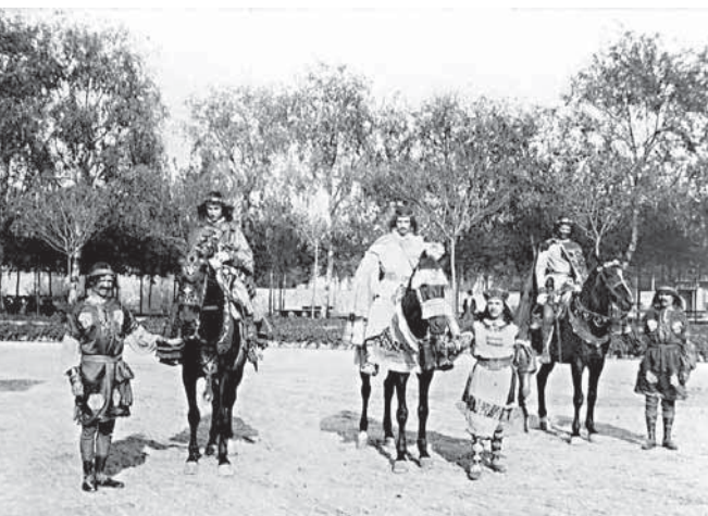
Comparsa dels gegants de Santa Florentina