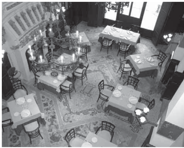
Interior de la Casa Roura, avui