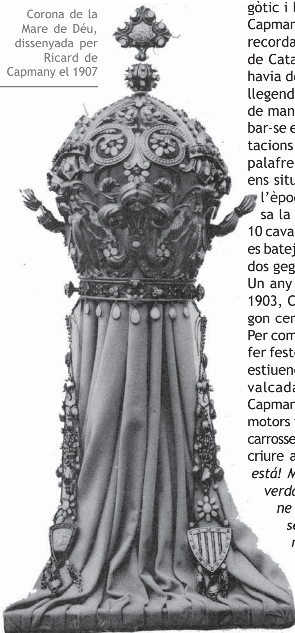
Corona de la Mare de Déu, dissenyada per Ricard de Capmany el 1907

sar dues comparses, una d'estil gòtic i l'altra romànic. Segons Capmany, el grup gòtic pretenia recordar el temps esplendorós de Catalunya i el romànic ens havia de transportar als temps llegendaris de la reconquesta, de manera que la gent, al trobar-se entre aquelles representacions de cavallers i patges, palafreners i portaestandarts ens situaria ben ràpidament a l'època. En total, la comparsa la formaven 30 persones, 10 cavalls, 5 nans, un drac -que es batejà com a momerota- i els dos gegants.