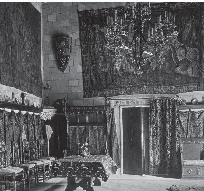
Decoració medieval de Santa Florentina