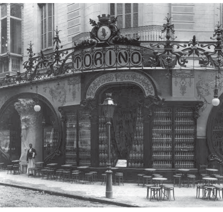
El Cafè Torino, de Barcelona