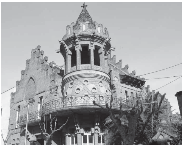
Casa Roura, residència dels Capmany