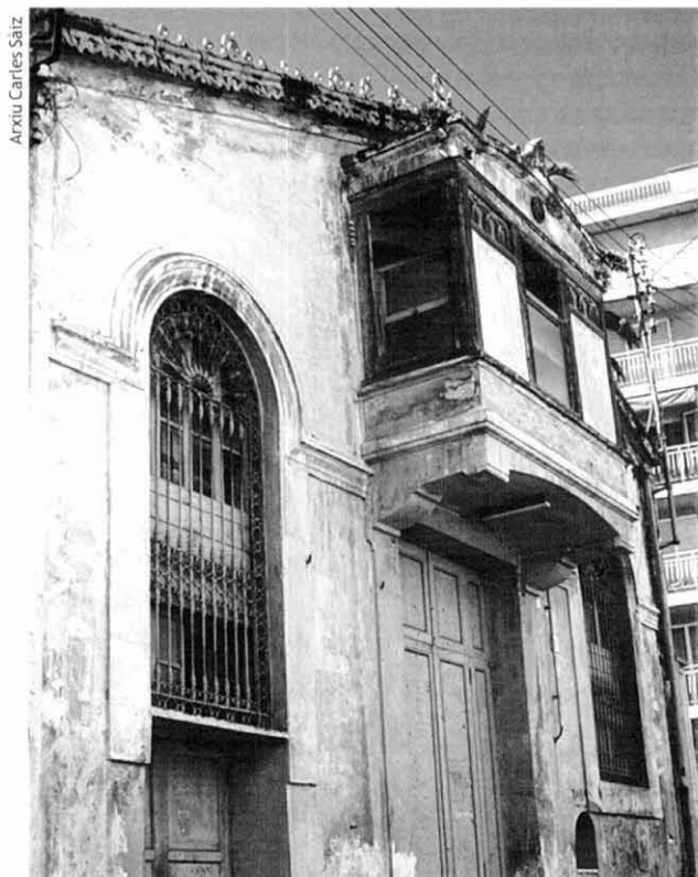
Darrera imatge conservada del Teatre Canetenc, un edifici construït l'any 1880 i derruït el 1995

Els dos teatres de Canet dels que se'n té un coneixement documental són el Teatre Canetenc i el Teatre Principal. No podem precisar, per falta d'una recerca més exhaustiva hores d'ara, si aquests varen