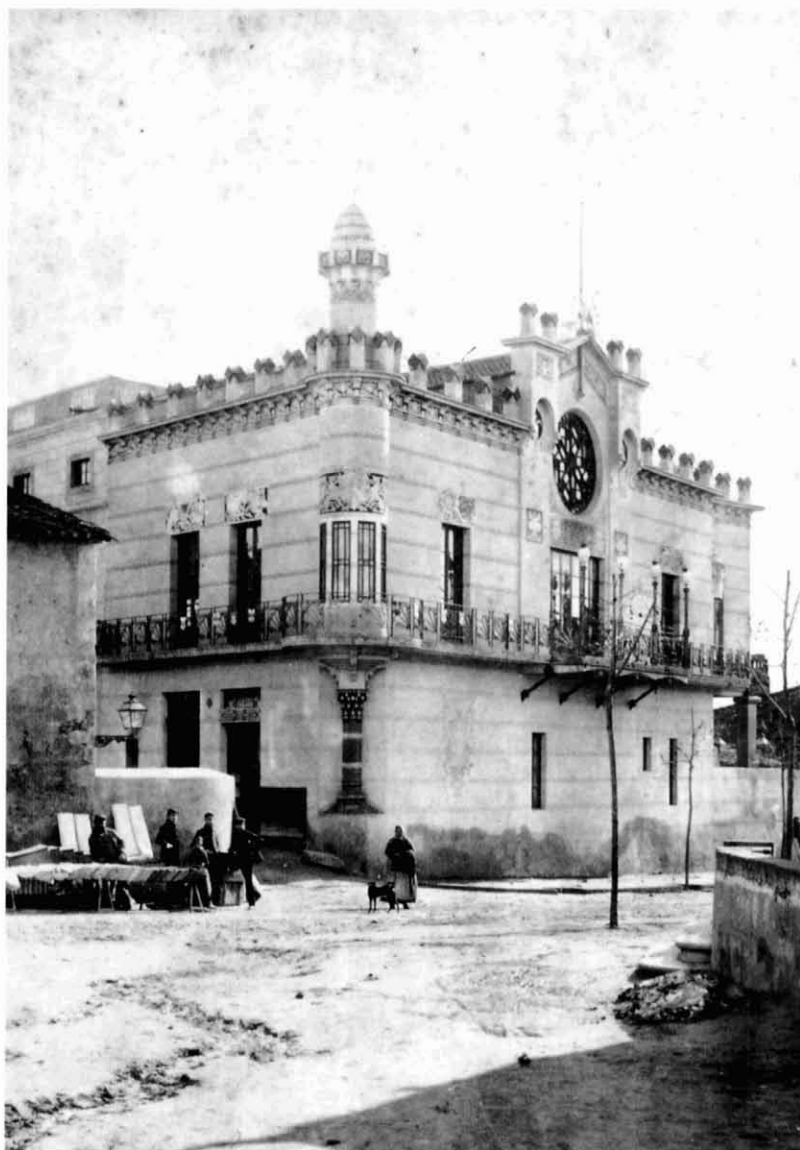
Edifici de l'Ateneu, pocs anys després de la seva inauguració, el 1885

A partir de l'any 1939 aquests locals van ser confiscats i controlats pel Movimiento, coneguts aleshores com Educación y Descanso; l'antiga sala del Teatre Principal durant la postguerra i fins ben entrats els anys 60's va ser una concorreguda sala de ball, on també s'hi prodigaven altres espectacles populars d'aquells anys com ara la boxa. En els baixos hi va romandre fins a finals dels anys 70's el cafè conegut popularment com «can Calixtru».