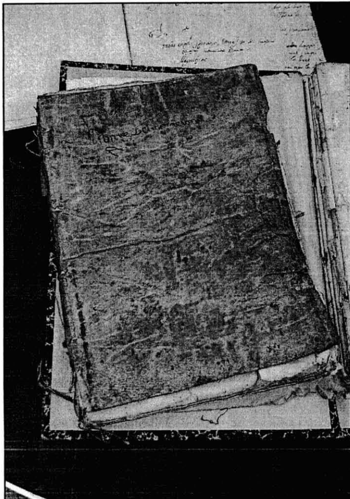
Els exemplars es troben en bon estat de conservació

Cal precisar també, que l'Arxiu no només custodia la documentació administrativa i històrica de l'Ajuntament, sinó també documents cedits o donats per empreses, institucions, associacions i particulars. Gràcies a la generositat de moltes persones i a la difusió d'entitats com el Centre d'Estudis Canetencs, s'augmenta el volum documental de l'Arxiu. D'aquesta forma s'incrementa el nostre patrimoni documental pensant també en les generacions futures, ja que la memòria històrica es construirà en el futur sobre la base de la documentació conservada i accessible. D'aquesta manera, les institucions o les persones de les quals provenen els documents esdevindran protagonistes i testimonis privilegiats de la nostra història.