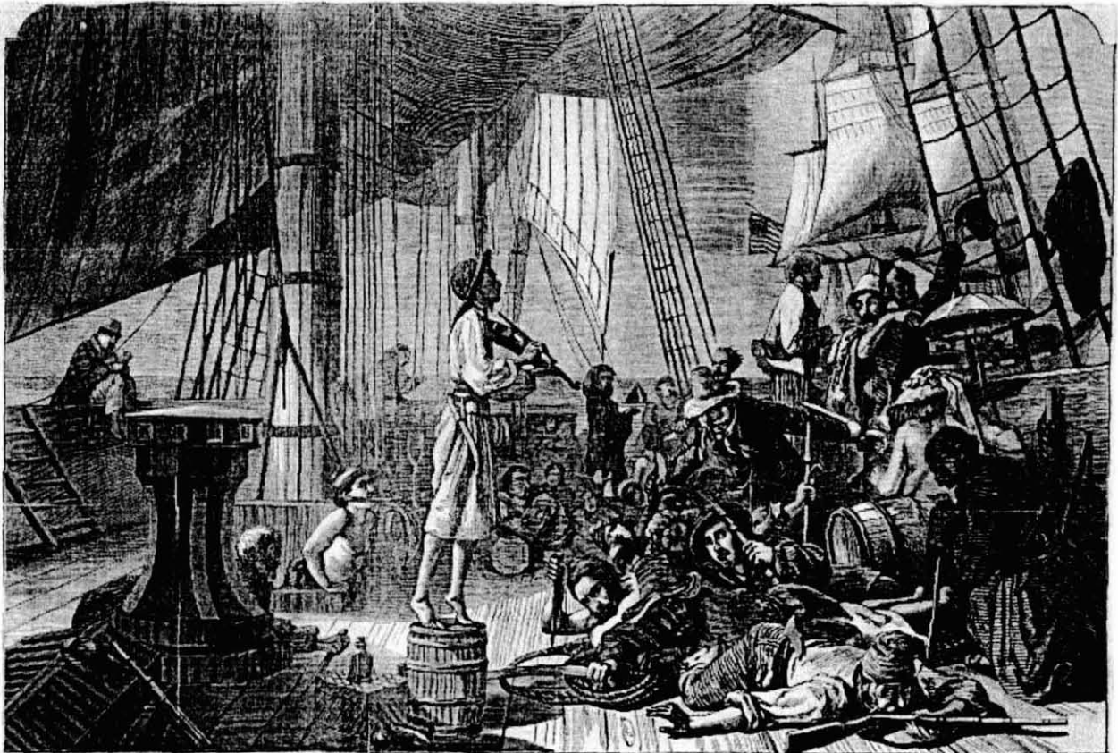
Coberta d'un vaixell pirata

Com podeu veure, el botí principal buscat pels pirates eren els captius, que eren portats cap a les masmorres d'Alger i Tunis en espera de cobrar el rescat. Alguns captius, amb una mica de sort arribaven a veure el moment del seu alliberament, però molts van morir en captiveri. Aquest perill