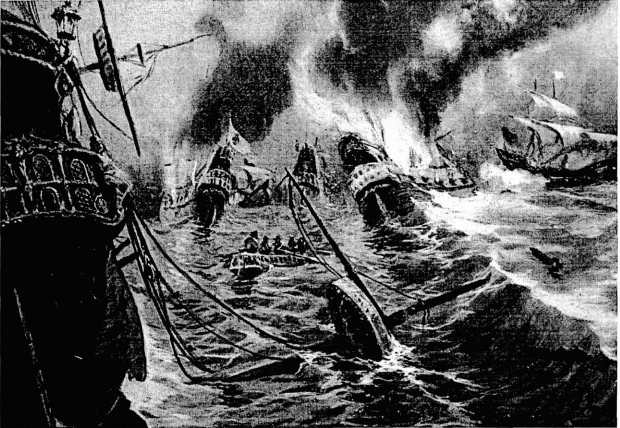
Batalla de Lepanto, el 1571

defensa. Desfet l'efecte sorpresa i sense possibilitats d'abordatge per part dels pirates, es dispararen alguns trets de canó entre els dos vaixells, al temps que els pirates maniobraven per fugir i el patró Pica emprenia la seva persecució, ajudat per noranta arenyencs armats que havien pogut pujar al seu vaixell. Amb el vent de Terral a favor, aviat abastaren el vaixell pirata, entaulant-se una violenta lluita cos a cos. Davant la superioritat numèrica dels nostres, aviat acabà la lluita amb la presa dels enemics i del seu vaixell.