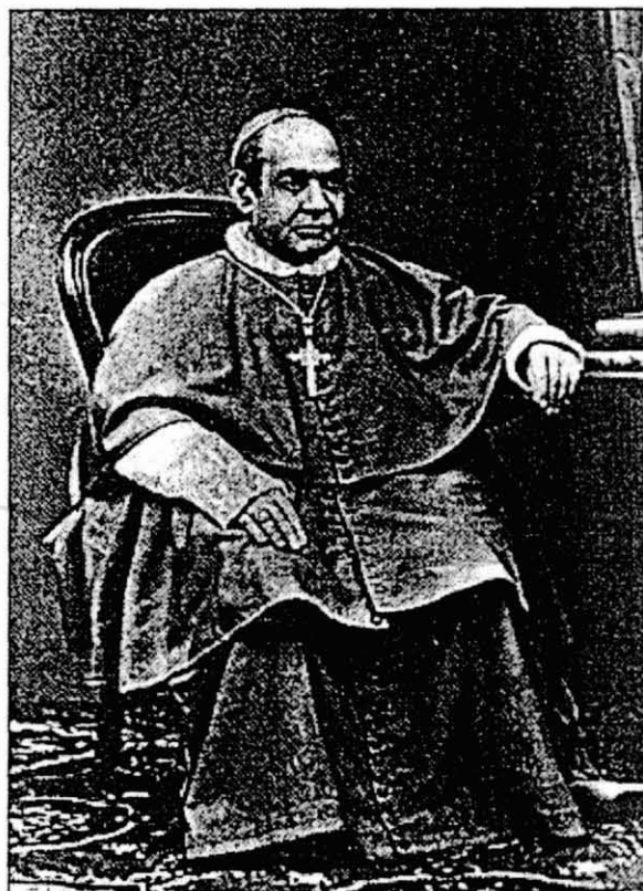
El pare Antoni M. Claret, arquebisbe de l'Havana