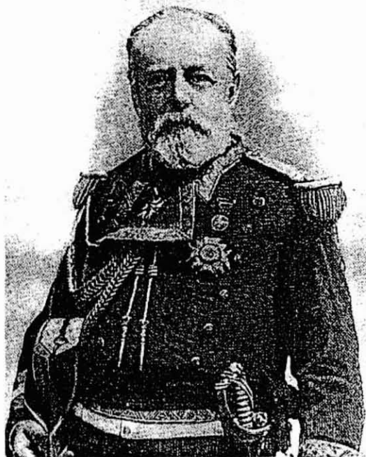
L'almirall Cervera, cap de la flota espanyola

i aquesta decisió va convertir la històrica institució dels escolapis de Guanabacoa en un vedat gairebé exclusiu de religiosos catalans que impartirien l'ensenyament a diverses generacions de cubans, en castellà, sense perdre la condició de catalans. D'aquestes escoles sortiren, en bona part, els corrents independentistes que haurien de portar finalment a la creació de la nació cubana.