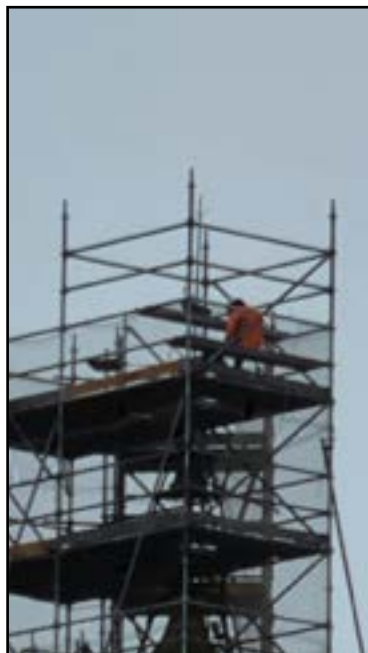
Campanar envoltat per una gran bastida (esquerra). Treballs de manteniment de l'agulla (dreta). Font: autor.