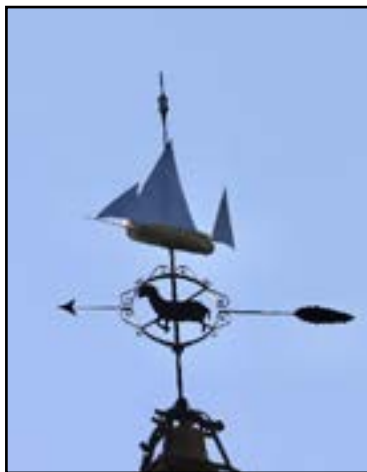
El penell restaurat.