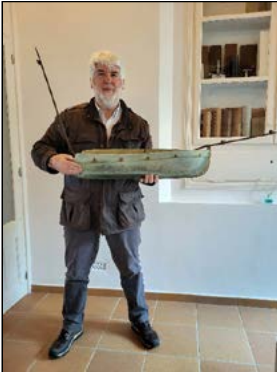
El llagut amb la ferramenta invertida (abans de restaurar-lo).

Sense tenir en compte els pals, les dimensions del buc són setanta-sis centímetres de llarg (eslora) per vint-i-quatre d'ample (mànega). Disposa d'unes ferramentes que configuren un botaló (pal que surt per la proa), un tros de pal principal inclinat cap a proa (retallat) i una pal de mitjana a popa. Vaig adonar-me que el pal de proa o botaló sortia per la popa, per la qual cosa calia fer un gir de cent vuitanta graus al conjunt de la ferramenta, que girava sobre l'eix del parallamps. Fet això, tot l'aparell va quedar ben orientat; ara calia tornar a dissenyar el velam, i gràcies a la presència dels tres pals i a la forma del buc, teníem clar que es tractava d'una barca de bou amb aparell de barca de mitjana.