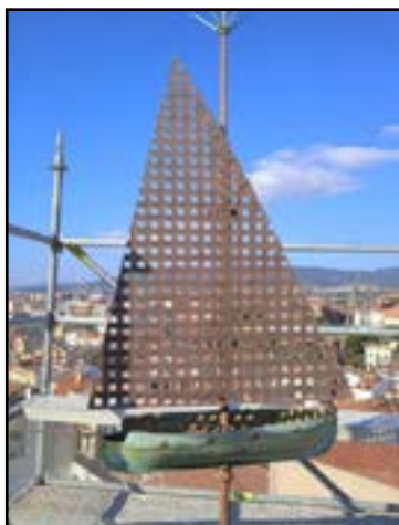
El llagut amb l'única vela llatina.

Mentre escrivia el llibre Ran de mar , vaig tenir ocasió de disposar de diferents fotografies de qualitat fetes des de diferents angles del penell del campanar abans de restaurar-lo. En ampliar-les, vaig adonar-me que hi havia una anomalia: feia la impressió que l'única vela estava al revés, però no n'estava segur del tot.