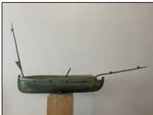
El llagut amb la ferramenta invertida (abans de restaurar-lo).

El mes de març del 2023, en plenes obres de restauració del campanar, vaig poder observar de prop el llagut acabat de despenjar del campanar, a l'estudi de Bernat Carrau. Quan vaig veure el vell buc d'aram 4 , i especialment després de subjectar-lo amb les mans, vaig sentir una sensació d'alegria molt especial.