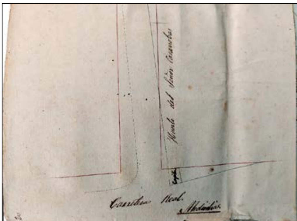
Projecte i detall de l'alineació del carrer de Sant Joan, feta per l'arquitecte Jelinek, on es veu dibuixada la capelleta, assenyalada amb la paraula 'capilla', al peu del Camí Ral.