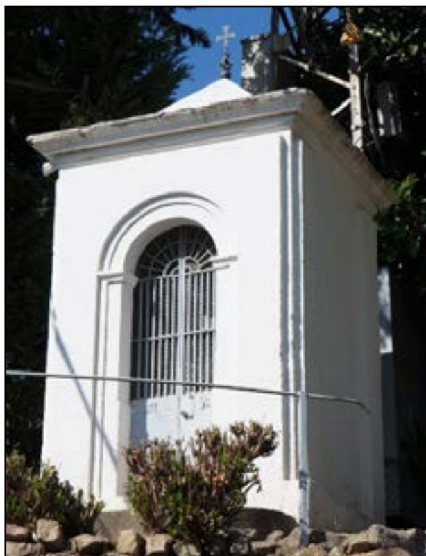
Capelleta del Sant Crist del Molí, al Camí del Mig.

De moment, i tot esperant localitzar la possible documentació que pugui donar crèdit a la tradició, ens hem d'acontentar amb la hipotètica capella de què parlaven els nostres besavis. Hom pot imaginar-se —a l'encreuament del Camí Ral de Mar amb el torrent que passava fregant can Mir de Mar— un senzill oratori de camí, del tipus del Crist del Molí o del Crist Mujal, ambdós a peu del Camí Ral del Mig [...].” 5