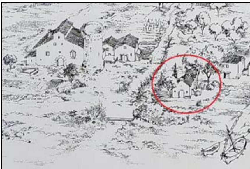
Detall de la làmina publicada pels Amics de Vilassar: 'Paisatge estimatiu del Veïnat de Mar de Vilassar a l'últim terç del segle XVIII', dibuixada per Vicenç Casanovas i Vilà.