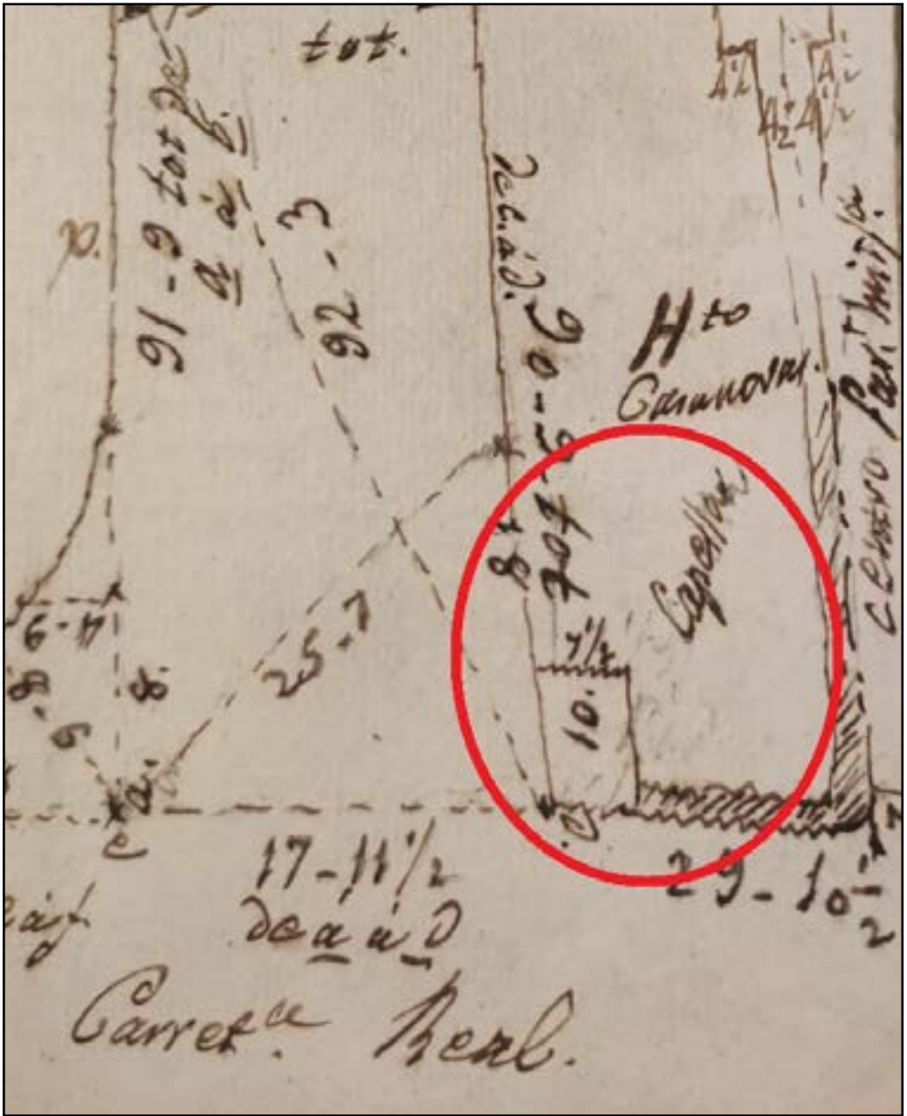
Croquis d'un plànol del 1845 de la Biblioteca de Catalunya on surten l'Hort Casanovas i la capella de Sant Joan.