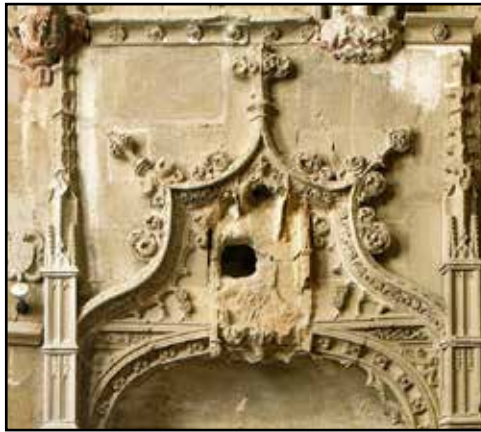
Detall de la tomba de Ll. de Requesens a la capella de l'Epifania (Seu de Lleida).

Segons Yeguas, la importància del retaule de Sant Genís de Vilassar rau en que apareix per primer cop trets que indiquen la introducció d'elements classicistes en la seva obra, sobre tot en la imatge de sant Genís que presideix el retaule. Aquest italianisme clàssic es veu en el plec del vestits, la forma de representar el cos que alterna amb elements encara pròpiament gòtics que es poden veure en la forma de representar els cabells. 26