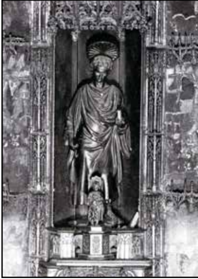
Retaule de Sant Genís de Vilassar. Detall de la imatge de Sant Genís.

Basant-nos en l'esquema d'altres retaules cohetànics com el d'Argentona i en la documentació conservada podem deduir que les escenes representaven diversos episodis de la vida de Sant Genís i la passió de Jesús.