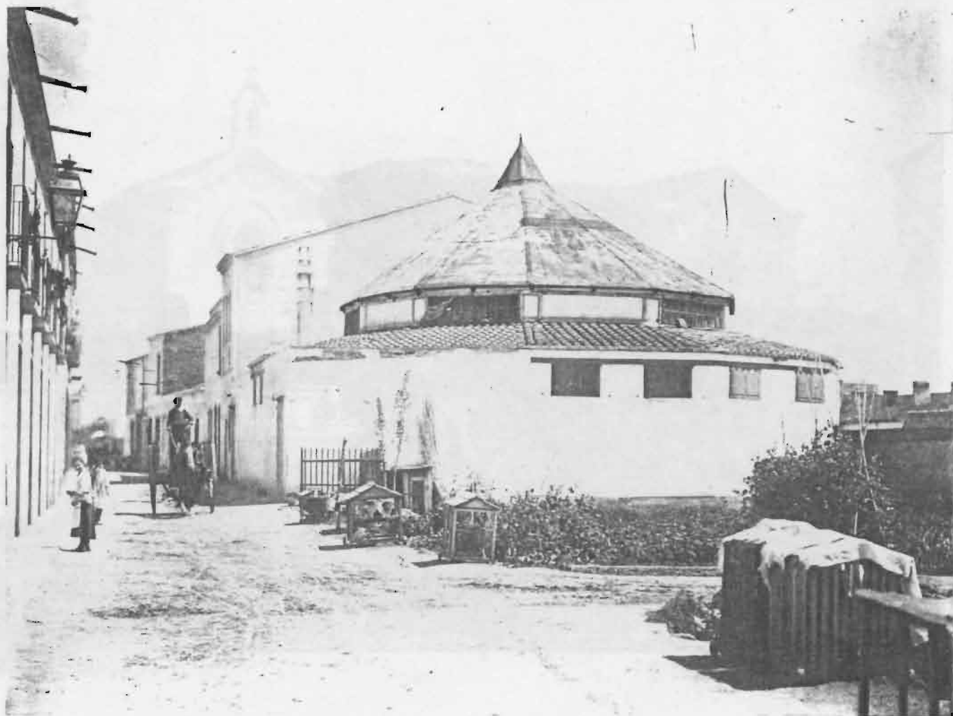
La Chiesa di S. Maria della Pace - La piazza del paese