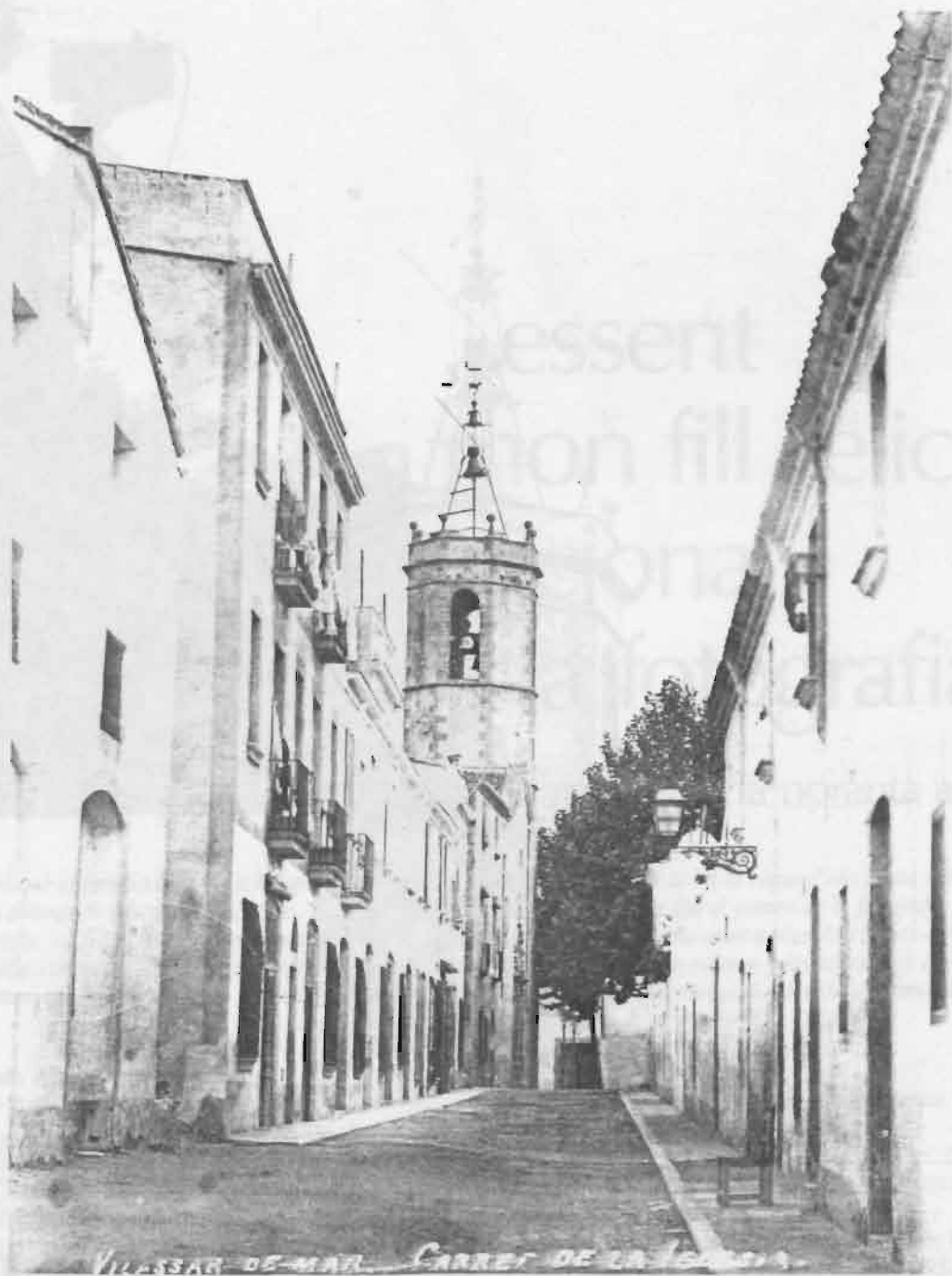
VUE DE MER. CARRER DE LA EGLÉSIA.