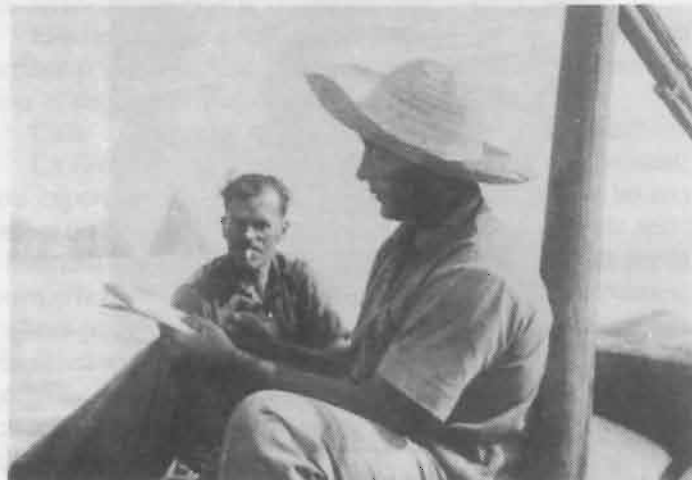
Escrivint el Diari de Bord

A mi em falten braços i barret per fer senyals, enfilat a la proa, però els de la Rebeca , que ens han entès, després