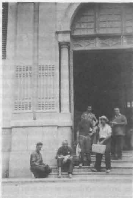
Proveint a Palamós