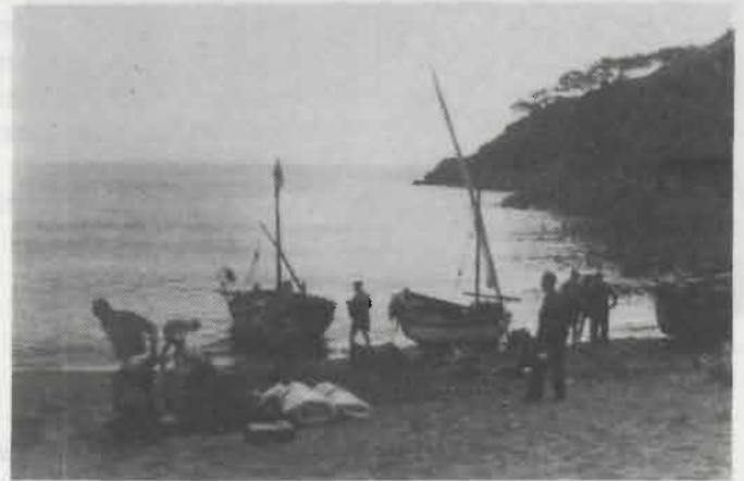
Sa Riera, Begur

Ens banyem i cap a dinar d'hora. La pesca ha estat fluixa, encara que el dinar està força bé. Patates bullides amb pebrot i peix fregit per darrere, i peres. Sense cafè per tal de guanyar temps, perquè aquesta tarda volem sortir i anar molt lluny. A dos quarts de dues sortim, hem passat ja el far de Sant Sebastià i Tamariu. Som en plena zona de cales fortes i coves, i caminem amb dificultat, saltant molt, amb mar planera però de llevat.