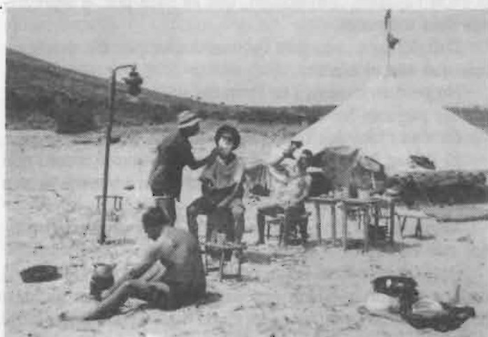
Acampats a Cala Mongó

rames submarins, ens fan passar una bona estona. Arribem cap a les 2 de la matinada i entrem sense fer soroll a l'altra cova: la dels gripaus.