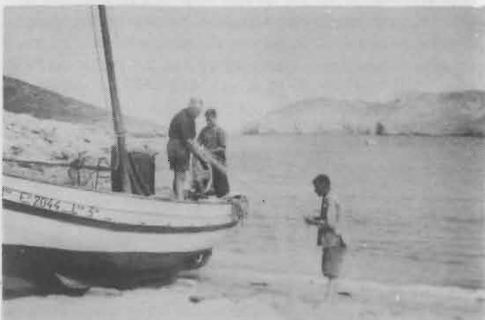
A Cala Mongó

Arribem fins a la platja conduïts per un mariner, ens n'anem a protegir de llevant i a la vora dels rocalls de la punta