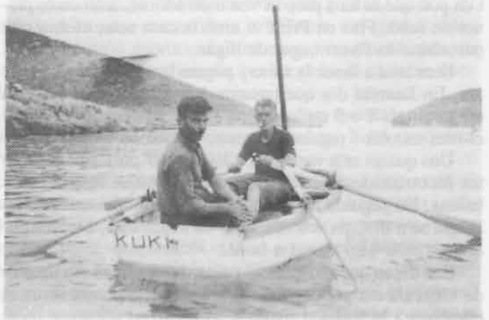
En Prim i en Jaumitu

A nosaltres no se'ns veu i hem d'anar arrapats on podem