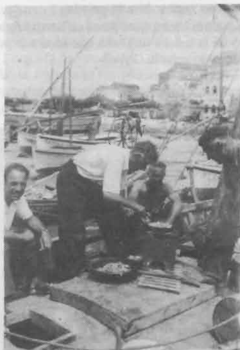
Al port de Palamós

Ens tornem sibarites i els programes de menjar són molt discutits. Després de tot, no és poc mèrit variar els plats sem-