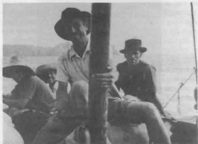
La tripulació de la «Rosa»

A les 6 de la tarda un cop de vent s'emporta el tarot d'en