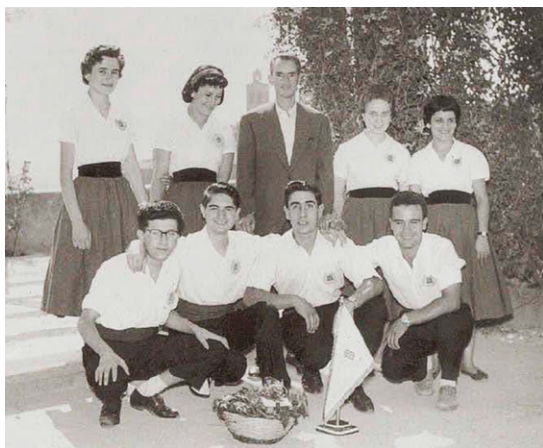
Figura 14 Colla sardanista Jovencells, en una foto de l'any 1956 a la Pèrgola.

La majoria de colles ballaven segons el sistema empordanès, en el qual les tirades s'han d'acabar obligatòriament cap al costat esquerre. Aquest va ser el cas dels Jovencells. En canvi, una minoria seguia el model selvatà, en què s'ha d'acabar sempre a la dreta.