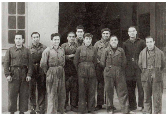
Figura 2 Garatge del Celestino Roca l'any 1949 (només hi treballaven deu mecànics, que feien reparacions de tota la comarca). Font: Història Gràfica de Cervera, p. 128, fig. 109 autor de la fotografia: Gómez Grau, propietaris de la còpia original: Francisco Castelló Gasull i Alfred Carcasona.

El garatge comptava amb deu treballadors habituals (fig. 2 i 3), una xifra suficient tenint en compte el baix nombre de vehicles que circulaven prop de Cervera. A la ciutat molt poca gent tenia cotxes i la majoria eren dels taxistes. Els camions, de marca Internacional, Ford, Chevrolet o Citroën, es feien servir per al transport de productes agrícoles: gra, palla, oli i ametlles. No obstant això, tampoc n'hi havia gaires.