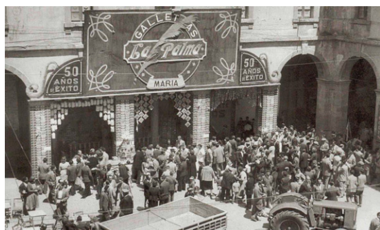
Figura 4 Exposició de rebosteria a la Fira de Sant Isidre.

A la Història Gràfica de Cervera , la foto que apareix de La Palma (fig. 4) és de l'estand que la mateixa empresa muntava a la plaça Major el 15 de maig per la Fira de Sant Isidre —el patró dels pagesos— anualment exposant-hi el seu ventall de productes, ja que era la fira més important del poble.