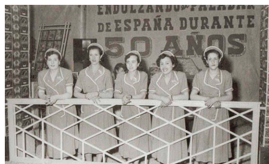
Figura 5 Treballadores de l'antiga fàbrica de galetes La Palma.