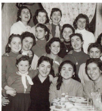
Figura 9 Cosidor de Teresina Albareda. Celebració de Santa Llúcia.

Celebraven el dia de Santa Llúcia, com tots els cosidors, i també participaven en la festa de la Reina de las Modistillas, com també ho feia la fàbrica de punt Giralt.