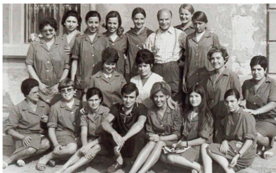
Figura 1 T treballadores i treballadors de la fàbrica de punt Giralt, dècada dels seixanta.

En primer lloc, a la fàbrica de punt Giralt es confeccionava majoritàriament roba per a infants, però també samarretes de dona, calces, calçotets, faixes, jerseis, etc. Cal dir que generalment tota la roba era manufacturada per la mateixa empresa, però de vegades s'havien realitzat treballs destinats a altres marques, com ara Ralph Lauren i Robin's Jean.