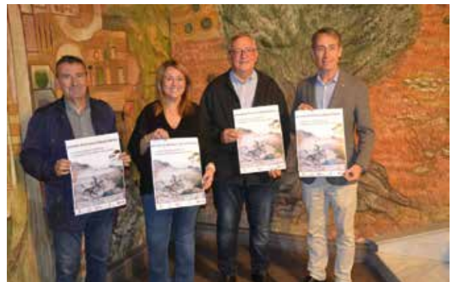
Foto 3: Presentació de la Jornada «La darrera ofensiva republicana a Catalunya (1938): Robert Capa a Aitona»

El CECS va participar en les jornades de formació i difusió didàctica «La darrera ofensiva republicana a Catalunya (1938): Robert Capa a Aitona», que es van celebrar els dies 5 i 6 de novembre de 2022 a la sala d'actes de l'Ajuntament d'Aitona i a la Serrabrissa. Aquestes jornades van completar la inauguració feta l'any 2021 de la Ruta Robert Capa, que ressegueix els passos pel fotoperiodista Robert Capa, que durant el període comprès entre el 7 i el 22 de novembre del 1938 va documentar fotogràficament la darrera ofensiva de l'exèrcit republicà durant la Guerra Civil espanyola, i més concretament la batalla del dia 7 de novembre a Aitona. (Foto 3)