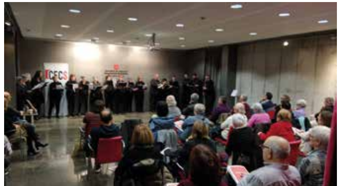
Foto 5: Presentació del número 9 de Shikar

l'arxiu. La intervenció, molt aplaudida, del Cor Absis d'Ivars, amb dos villancets acompanyats per un baixó, va posar punt final a la presentació. (Foto 5)