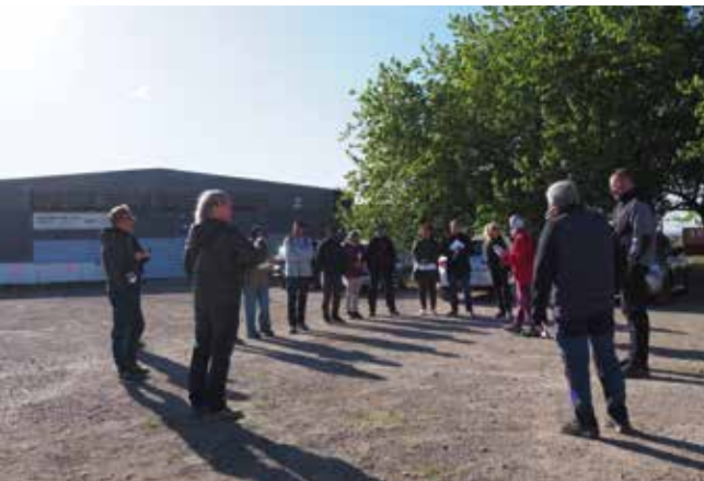
Foto 8: Ruta d'Alfès a Descobrim el Segrià

Durant el 2023 s'han realitzat tres sortides pedagògiques del programa Descobrim el Segrià. La primera fou la Ruta Arqueològica al Baix Segre (18 de març de 2023); el programa contemplava la visita al jaciment de Genó d'Aitona, el jaciment de les Roques de Sant Formatge de Seròs i el Jaciment de Bòvalar de Seròs. La segona sortida fou Paisatge Estepari (15 d'abril de 2023): visita a la Timoneda d'Alfès i ruta a peu d'Alfès fins a Aspa (ruta de les peixeres). Finalment, la tercera sortida fou Espais de Memòria, a Vilanova de la Barca (6 de maig de 2023); es va visitar la Plaça de la Pau, on hi ha un Tanc de la Guerra Civil, la part del poble reconstruïda per «Regiones Devastadas», la Sala cultural Macià Polo Verdú i els Espais de memòria: trinxeres del Tossal Roig, trinxeres de les Coves i niu de metralladores Pijuan, a més del Tossal de la Nora, amb trinxeres de la guerra civil i tombes medievals excavades a la roca. (Foto 8)