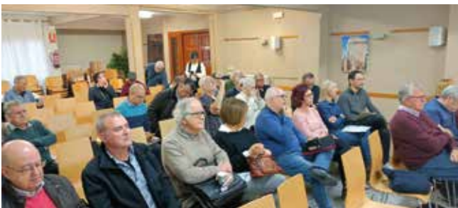
Foto 4: Aspecte general de les 10es Jornades d'estudi del Segrià (Alguaire)

Les jornades són acollides cada any per un poble diferent; l'any 2022 ha estat Alguaire, i són coorganitzades entre l'ajuntament respectiu i el CECS. Repartides en tres sessions, dos matinals i una a la tarda, i amb una exposició que no excedeix els 10 minuts, es succeeixen temes diversos que tenen un únic punt en comú: el Segrià. En acabar les sessions matinals, abans de dinar, es va fer una visita a les restes del monestir santjoanista femení d'Alguaire. Totes les propostes presentades aquest dissabte les podrem llegir en el número 10 de Shikar . (Foto 4)