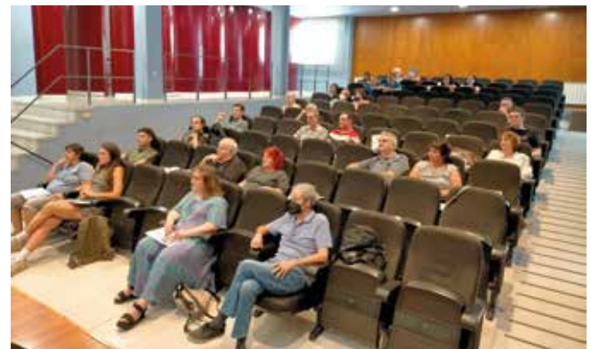
Foto 10: Curs d'estiu UdL sobre el Front del Segre a Alcoletge (juliol 2023)