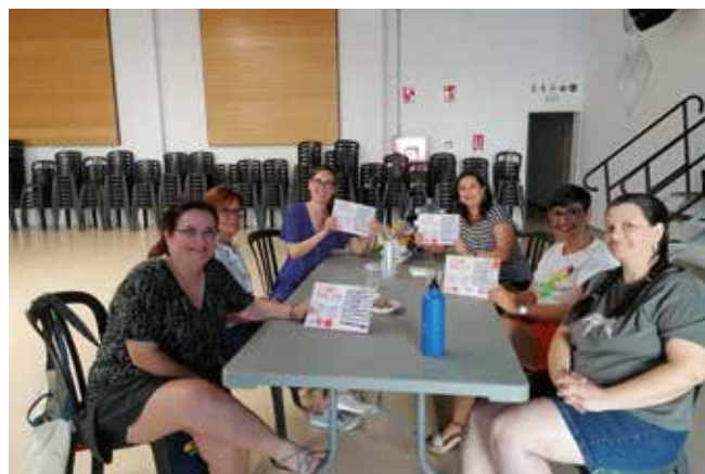
Fig. 3. Club de Lectura «L'Hora violeta» (darrera sessió de 2022).