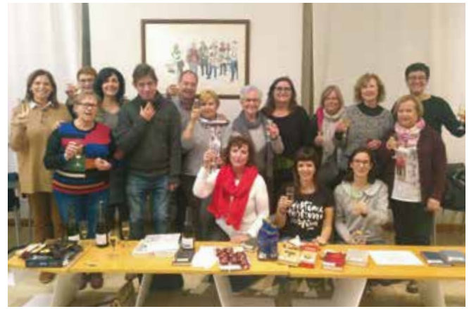
Fig. 4. Club de Lectura «Una habitació pròpia» de la Biblioteca Pública de Lleida.

Aquest interès es demostra en el fet que hi ha usuàries que participen en el club Una habitació pròpia des de la primera edició (2015), i en el cas de L'hora violeta les usuàries han repetit en la segona edició. Entre els motius que assenyalen per repetir en aquest tipus de club, es menciona de manera unànime la relació que s'ha establert entre elles com a grup, destacant el bon ambient, el fet de compartir experiències i teixir xarxa en companyia, alhora que continuar aprenent, créixer en comunitat i treballar l'esperit crític sobre les experiències i la societat en què viuen des d'una perspectiva de gènere. Sobre com defineixen el vincle que es crea entre les assistents al club, les paraules més utilitzades són aquestes: compartir, companyonia, empatia, enriquidor i confiança . (Fig. 4.)