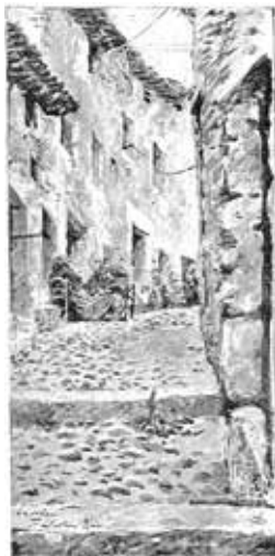
Fig. 5. Dibuix d'un dels carrers de Lleida realitzat per Francesc Llorens a La Ilustración ibérica . Núm. 174. Barcelona, 1 de maig de 1886, p. 279.

otras mucho mejores; sin embargo como el artista debe buscar siempre lo más típico de una localidad, de ahí que el Sr. Llorens y Riu, realista convencido, se haya fijado en una de las más características callejuelas de la capital, con sus comadres sentadas a la puerta y charlando o jugando al chilindró, etc., etc. 21