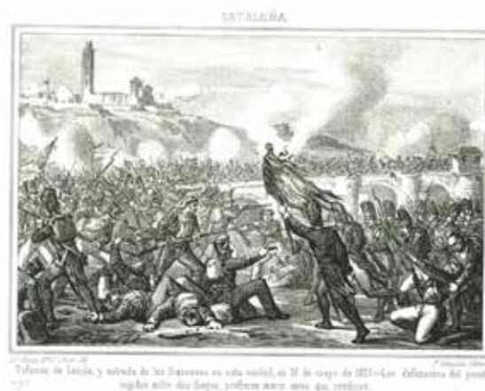
Fig. 2. Dibuix del setge del 13 de maig de 1810 a Adolfo Blanch. Cataluña. Historia de la Guerra de la Independencia en el antiguo principado . Barcelona, 1861, vol. 2, p. 6.

Els testimonis gràfics preses per Padró mostren l'arc triomfal instal·lat a la Rambla Ferran i la decoració de la casa del senyor Nuet construïts per l'ocasió. No era la primera vegada que el dibuixant barceloní plasmava un esdeveniment històric relacionat amb Lleida, perquè anteriorment deixà constància del setge patit el 13 de maig de 1810 per tal de ser inclòs a Cataluña: Historia de la Guerra de la Independencia en el antiguo principado (1861), d'Adolfo Blanch (fig. 2). La imatge recorda les escenes bèl·liques difoses durant la primera meitat del vuit-cents a París i alguna altra apareguda a Madrid, 7 ciutats a les que Padró viatjà al llarg de la seva trajectòria professional.