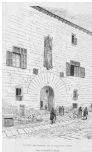
Fig. 4. Dibuix de l'antic hospital de Santa Maria realitzat per Josep Lluís Pellicer per a La Llumenera de Nova York . Núm. 70. Nova York, febrer 1881, p. 1.

al menos lo bon sentit de no embrutar la estàtua, ni las parts ornamentades, que contrastan vigorosament ab sos tons obscurs sobre la massa blanca de la cal. 17