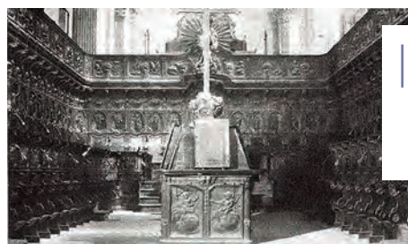
Fig. 1. Cadirat i faristol de la Catedral Nova de Lleida.

Fins que no s'obrí al culte la nova catedral i es restabliren les funcions en la seva plenitud, es perdé una part dels materials musicals copiats, principalment els que ho estaven en fulls solts, no tant però pel que fa als rics cantorals per a l'ús del cor capitular i que es situaven en el gran faristol central. 2 Posteriorment, i pel que fa a la documentació musical, hi hagué diversos daltabaixos anticlericals durant el segle XIX i fins arribar a la crema de 1936, quan molta part de la documentació musical, litúrgica i religiosa es convertí en cendres. Tots aquests fets comportaren que a la catedral de Lleida es conservés tan sols una petita part de la documentació musical que secularment li havia pertangut. 3