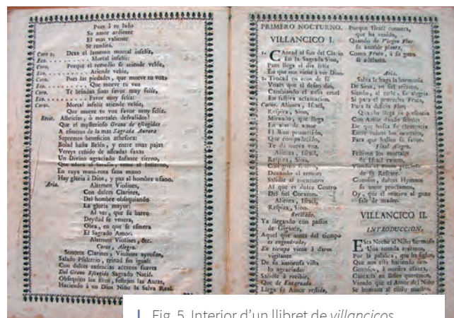
Fig. 5. Interior d'un llibret de villancicos d'Antoni Sala.

En total sabem de l'existència de 469 composicions litúrgiques i paralitúrgiques de músics relacionats amb la catedral de Lleida. Aquest és un extraordinari corpus de documentació que ens ve a mostrar una part de la vida musical de la catedral durant més un segle, un tresor que cal conèixer, estudiar i treure'l a la llum.