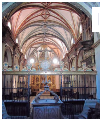
Fig. 2. Cor i orgue de la catedral d'Albarrasí (xarxa).

No tot està perdut però; una part de la música religiosa que s'escrigué a Lleida —i que s'hi interpretà— durant el segon i tercer terços del segle XVIII i primers anys del XIX, en un moment o altre feu cap a la catedral d'Albarrasí, diòcesi de Terol. 4 A l'arxiu capitular de la catedral d'Albarrasí es troba un destacat nombre de composicions —exclusivament obres destinades a la litúrgia i villancicos — de mestres de capella que havien exercit a la catedral de Lleida, la major part dels quals no tenien cap mena de relació amb la seu terolenca. 5 La música conservada correspon a diversos mestres de capella i organistes que exerciren a la catedral de Lleida des de poc abans de ser clausurada la Seu Vella, fins a inicis del segle XIX. 6 Aquests compositors visqueren el daltabaix de la vella catedral i la construcció de la nova, fins al ple domini de la segona. 7 En definitiva, es tracta d'un rellevant corpus de documentació musical que es componia i practicava a Lleida, i que coneixem gràcies a la conservació que se n'ha fet gairebé durant dos-cents anys en aquest centre aragonès.