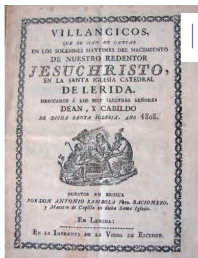
Fig. 4. Portada d'un llibret de villancicos d'Antoni Sambola.

Cal considerar que alguns d'aquests villancicos foren reaprofitats per Teixidor Latorre, ja que en els llibrets apareixen anotacions que així ho venen a mostrar. Per tant, a part de la intencionalitat que Teixidor volgués guardar o conservar un bon nombre d'obres d'altres autors, en aquest cas lleidatans, també tenia la clara intenció de reaprofitar-los per les seves pròpies interpretacions amb la capella musical d'Albarrasí.