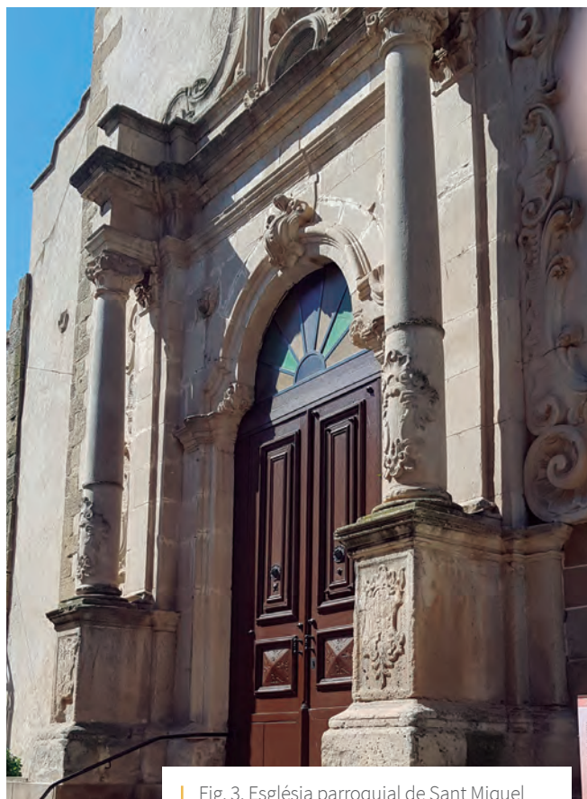
Fig. 3. Església parroquial de Sant Miquel

Vegem ara la descripció de les restes que tenim del segle XVIII 5 (RUBIO 2006: 81-88): L'església parroquial de Sant Miquel Arcàngel va ser el nou temple aixecat el 1762, una de les conseqüències del redreçament econòmic i demogràfic del poble (Fig. 3).