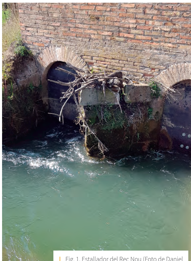
Fig. 1. Estallador del Rec Nou

L'estructura de la propietat mostra, en general al Segrià, un gran nombre de parcel·les petites i petits propietaris al costat d'alguns grans propietaris. Casa Cortasa, Casa Mo, Casa Comes, serien les hisendes més grans al nostre poble. A la documentació de Casa Cortasa es diferencia l'horta de la terra de secà. L'horta la tenim prop del riu Segre a parcel·les regades per la séquia de Fontanet. A la segona meitat del segle XVIII es procedeix a construir un ramal nou, a partir de l'esmentada séquia, anomenada avui dia Rec Nou o Secleta. No tenim encara confirmació documental d'aquest fet. 1 La nostra argumentació té altres fonamentacions: l'arqueològica, els exemples d'altres poblacions properes i l'intent de fer aquest braçal a finals del segle XVI (Fig. 1). A l'escomesa d'aquest ramal ens trobem estructures de pedres molt semblants a altres construccions d'Alcoletge a les mateixes dates com és el pont sobre la séquia de Fontanet —ara traslladat a la rotonda on comença carrer La Nora (Fig. 2)—, situat prop d'un altre pont anomenat de Sant Miquel, aixecat a la primera meitat del segle XVI, amb arc apuntat, i que pel seu mal estat no es va poder aprofitar com el posterior i ja citat del XVIII al fer-se les obres de canalització. Trobem també aquest tipus de pedra al campanar de l'església parroquial de Sant Miquel i a Casa Cortasa. Al Set-cents altres poblacions amplien les zones regades amb noves séquies: rec nou a Tèrmens, rec nou a Torres de Segre, nova séquia a