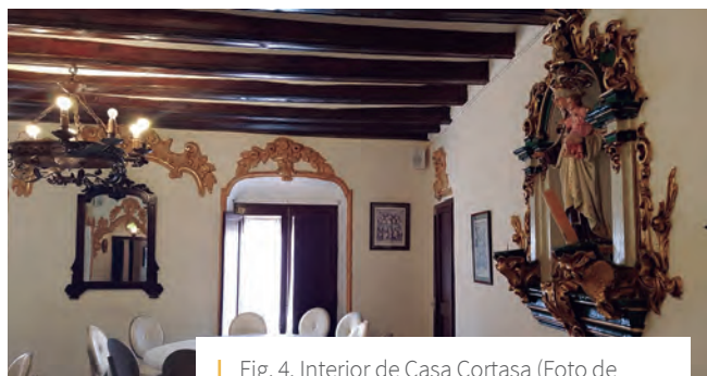
Fig. 4. Interior de Casa Cortasa

Cal Pelat, al núm. 10 del carrer Major, és avui dia un bloc de pisos, al qual podem observar encara 6 filades de carreus de pedra del segle XVIII; a la clau de la volta de la porta d'entrada figura la data de 1783 (Fig. 5). A la part baixa es conserven uns cellers de pedra amb volta de mig punt.