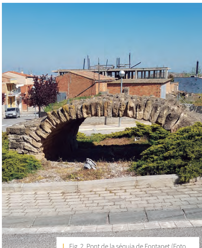
Fig. 2. Pont de la séquia de Fontanet