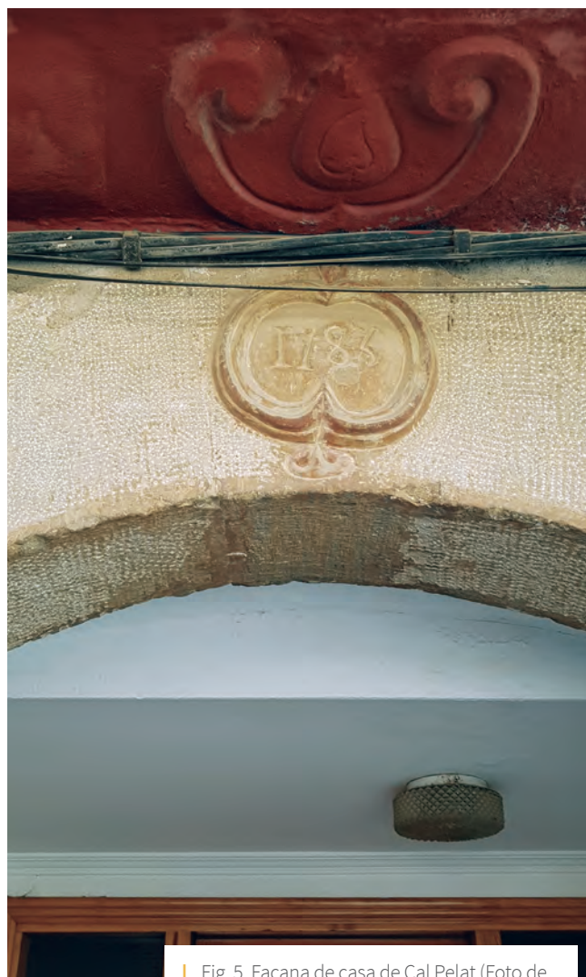
Fig. 5. Façana de casa de Cal Pelat

Cal Pelat, al núm. 10 del carrer Major, és avui dia un bloc de pisos, al qual podem observar encara 6 filades de carreus de pedra del segle XVIII; a la clau de la volta de la porta d'entrada figura la data de 1783 (Fig. 5). A la part baixa es conserven uns cellers de pedra amb volta de mig punt.