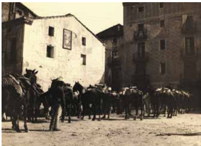
Fig 1. Soldats davant del segon emplaçament de la Font de les Piques, a la cruïlla entre el carrer Boters i plaça Cervantes.

Tot comença amb la troballa d'una fotografia a l'Arxiu Municipal de Lleida i la voluntat de voler-la descriure. S'hi veia un grup de soldats amb els seus cavalls en algun indret indeterminat de la ciutat; semblava que estaven fent una parada per menjar o beure. Al fons de la fotografia s'intuïa una construcció adossada a la casa; s'hi entreveïa un escut fet en pedra i de seguida vam deduir que es tractava d'una font. Per les seves característiques semblava la Font de les Piques, però l'emplaçament de la fotografia no responia al que coneixem actualment. A partir d'aquí vam treballar amb aquesta hipòtesi i vam recollir la màxima informació sobre l'esmentada font. Gràcies a l'ajuda de l'Archivo General Militar de Madrid, vam esbrinar que la fotografia es devia realitzar entre 1909 i 1918, i que els soldats podrien formar part del «Regimiento de Cazadores de Caballería Tetuán número 17», però això estaria per confirmar. El que està clar és que l'esmentada fotografia ha donat peu a escriure un article sobre la Font de les Piques i de retruc de totes aquelles fonts monumentals de Lleida que en algun moment de la seva història van ser traslladades del seu emplaçament primitiu i/o modificades de la seva construcció original. (fig. 1)