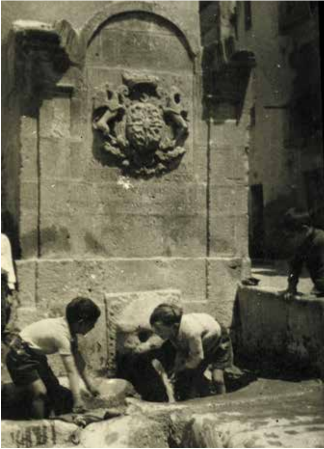
Fig 2. Nens bevent a la Font de les Piques.

En tenim una descripció en l'escrit de l'Ajuntament de Lleida del 28 de maig de 1783: