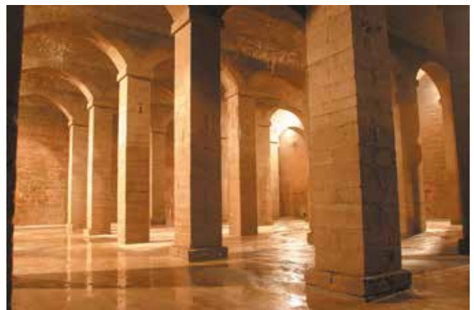
Fig 4. El Dipòsit del Pla de l'Aigua en l'actualitat.

Es construeix un dipòsit subterrani de 10 metres de profunditat i de 30 per 30 metres d'ample. Es va cobrir amb 6 voltes de canó sustentades per 25 pilars i arcs rebaixats. Per als pilars i murs es va utilitzar pedra calcària procedent de la partida de l'Astor (al Sud del terme de Lleida, a tocar del d'Artesa) i maó per a les voltes. En una de les voltes s'obrí un respirador per ventilar l'espai, que a l'exterior s'aprofità per instal·lar-hi una font que lluia al bell mig de la plaça. (fig. 4)