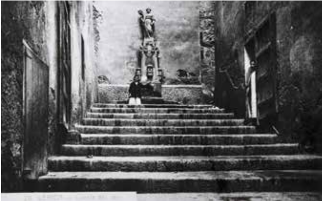
Fig 6. Primera configuració de la font de la Costa del Jan.