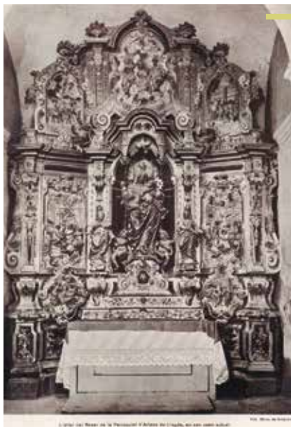
Fig. 3 - Retaule del Roser de l'església d'Artesa de Lleida (SERRA 1925, làmina LXV entre les pàgines 236-237)

diu que ho va fer sense el permís del Bisbe, el seu superior, tot i que en data de 25 de desembre de 1823 s'havia fixat un edicte públic a la porta del temple parroquial d'Artesa de Lleida segons el qual, en un termini de trenta dies, se li ordenava de tornar a la seva parròquia a complir amb els seus deures religiosos. 18