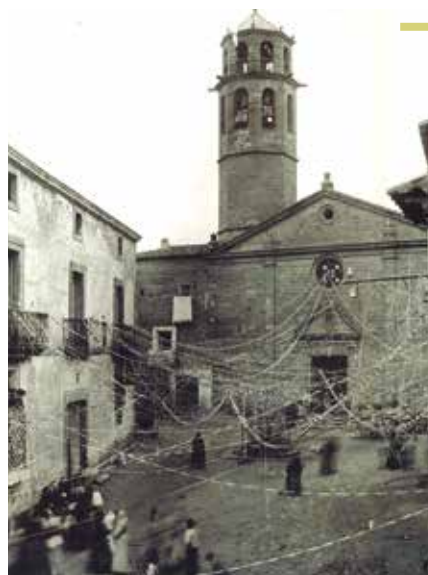
Fig. 6 - Plaça Major de Puigverd de Lleida un dia de Festa Major, 1905.