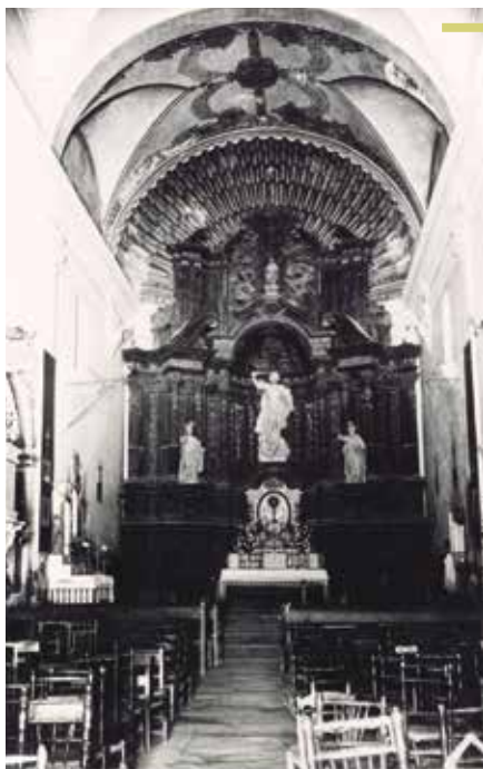
Fig. 2 - Retaule de l'altar major de l'església d'Artesa de Lleida (autor desconegut).