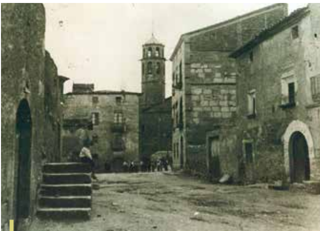
Fig. 4 - Puigverd de Lleida, 1907. Autor: Ceferí Rocafort, Arxiu fotogràfic del Servei de Patrimoni Arquitectònic Local de la Diputació, clixé 35135

El 1814 mossèn Roig va arribar a la parròquia de Sant Pere de Puigverd com a prevere i rector. 37 Va romandre a la parròquia fins el 8 de maig de 1822. 38 En aquests gairebé vuit anys diferents sacerdots van haver de substituir mossèn Roig en la celebració dels ritus cerimonials, tot i que no en sabem els motius. 39 Com a rector de Puigverd havia de cuidar-se també de les ànimes dels habitants dels despoblats de Binferri, on hi havia l'ermita de Sant Jordi i dels de Margalef, on hi havia l'ermita de Sant Bartomeu. La parròquia consistia en una renda de 100 lliures barcelonines del Monestir d'Escaladei, 140 lliures de diferents censals que feien alguns particulars subjectes a diferents celebracions, unes 70 lliures de funerals, noces, batejos i altres cerimònies. 40 També percebia per arrendament unes 16 lliures per les terres o heretats de la parròquia. En total unes 326 lliures anuals, que equivalien a uns 3.477 rals.