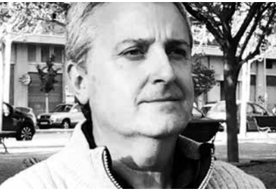
Felip Gallart Fernández Centre d'Estudis Comarcals del Segrià