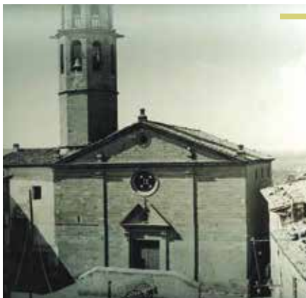
Fig. 5 - Plaça Major de Puigverd de Lleida l'any 1907. Autor: Josep Massot Palmés, Arxiu Fotogràfic del Centre Excursionista de Catalunya, Barcelona

Cura, Alcalde y ciudadanos de Puigvert, y sepan las Cortes que son dignos del premio al paso que otros merecen un castigo ejemplar. 44