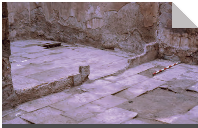
Fig. 15 - Detall del paviment.