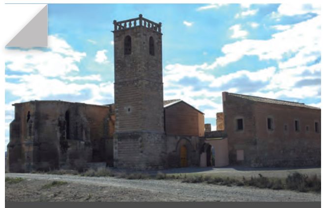
Fig. 3 - Vista general d'Avinganya.