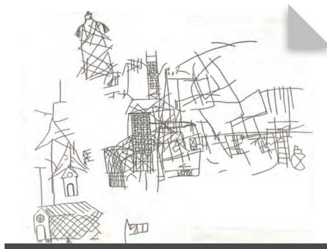
Fig. 18 - Calc de grafit de temàtica diversa al mur oest de l'edifici. (Fot. Servei d'Audiovisuals de l'IEI).