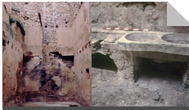
Fig. 16 - Cuina de l'hostatgeria amb l'empremta de la xemeneia i els fogons i la pica d'aigua.

La llum entraria en aquest àmbit per la finestra amb llinda de l'any 1714. L'altre àmbit, il·luminat per la finestra més petita, serviria com a menjador o lloc d'estada i on vàrem poder veure l'empremta d'una gran xemeneia, al costat de la qual, en l'angle NE, hi havia vestigis de l'escala d'accés al primer pis.