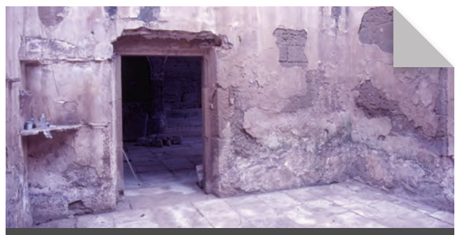
Fig. 10 - Porta d'accés a l'hostalgeria.