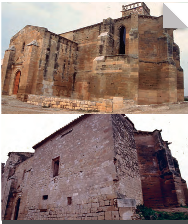
Fig. 19 - L'hostatgeria, abans i ara.

Per les característiques de l'edifici i tenint en compte que una de les funcions de l'orde trinitari era donar aixopluc als pobres, creiem que es tractaria d'una hostatgeria i que, a part d'auxiliar els pobres de la zona, serviria també com a allotjament tant pels peregrins que fessin el camí de Sant Jaume com pels viatgers que empraven les importants vies de comunicació que passaven per l'entorn estratègic del monestir, tot i que ens crida molt l'atenció el fet que solament tingués un accés per l'interior del temple.