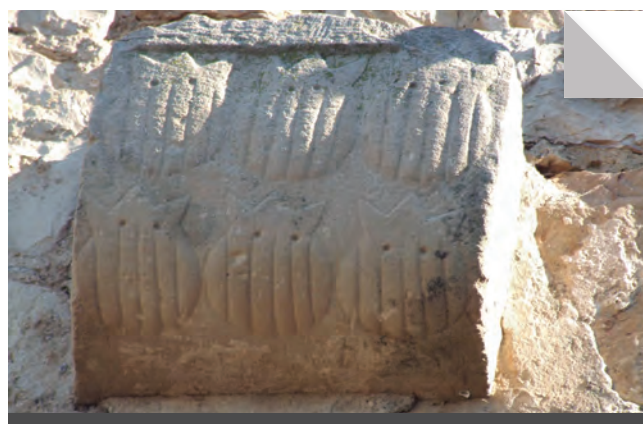
Fig. 8 - Mènsula s. XIII.