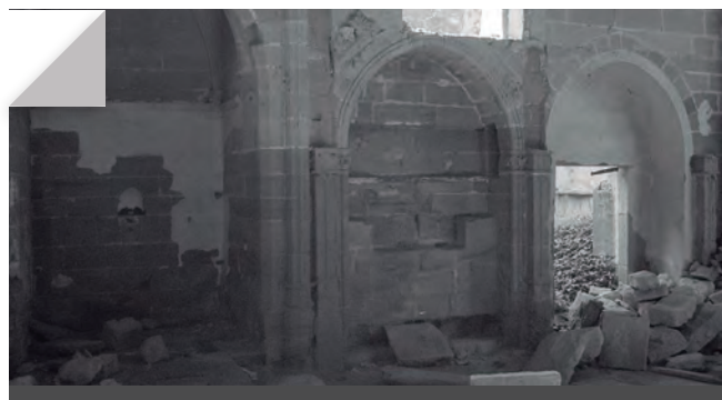
Fig. 9 - Accés des de l'interior de l'església a l'hostalgeria.

A l'exterior, es construiran noves edificacions, de les quals destaca una realitzada a l'est de la capella del Remei l'any 1714, que es comunicava directament amb el temple a través d'una porta oberta al mur gòtic i que és l'objecte del present treball. Era un edifici de planta rectangular de dos plantes i golfà, adossat al temple pel costat NE, raó per la qual fou destruït el contrafort nord de l'absis del segle XIII. La peculiaritat és que s'hi accedia directament des del temple, a través del primer arcosoli del mur est de la capella del Remei, tot i que l'obertura fou de forma totalment rectangular sense ajustar-se a la forma semicircular de l'àmbit funerari. Igualment, però a sobre del segon arcosoli, hi hauria també una gran obertura de comunicació amb el temple des de la primera planta de l'edifici.