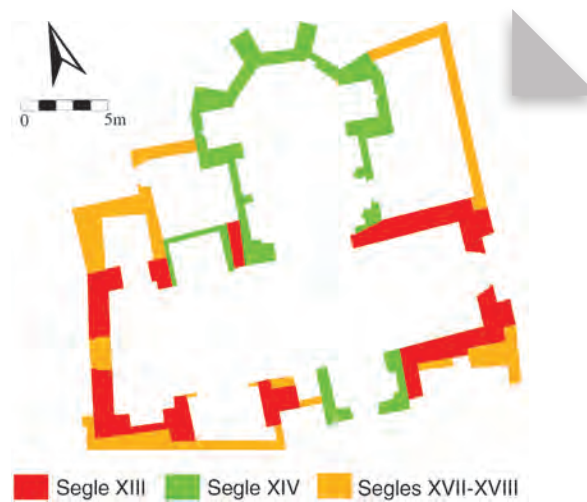
Fig. 6 - Planta s. XVI–XIX.