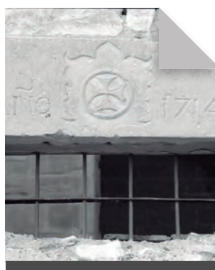
Fig. 12 - Finestra amb la data de 1714. (Fot. Servei d'Audiovisuals de l'IEI).