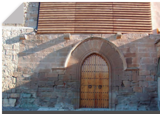
Fig. 7 - Façana de l'església del s. XIII.

No tenim constància, però, que a Avinganya hi hagués un hospital en època medieval, al contrari que a Lleida i a Anglesola. El que sí que sabem és que era un dels punts per on passava el camí de Sant Jaume, per una mènsula col·locada a la façana del segle XIII de l'església amb sis petxines, cosa que fa suposar que era lloc de pas i d'estança dels peregrins que es dirigien a Santiago de Compostel·la. 1