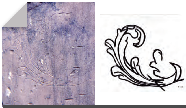
Fig. 17 - Grafit i calc d'una fulla, al mur oest de l'edifici. (Fot. Servei d'Audiovisuals de l'IEI).

Als murs, arrebossats, excepte a la part de la golfa, encara s'hi podien veure els forats on eren les bigues que configuraven el terra del primer pis i s'hi varen poder recollir una bona mostra de grafit de temàtica diversa, tot i que els més abundants eren els que representaven edificis, especialment al mur est (GONZÁLEZ I XANDRI 1998).