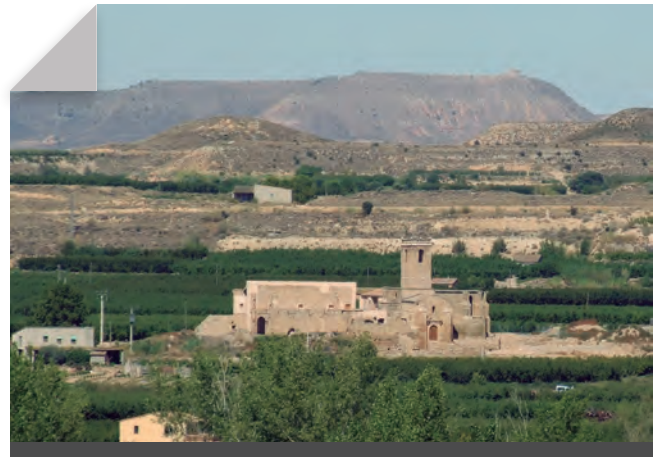
Fig. 2 - Vista general d'Avinganya des del NE.

Des de l'any 1997, després de recuperar-lo arquitectònicament, es convertí en el Centre d'Arqueologia adscrit al Servei d'Arqueologia de l'IEI, la funció principal del qual és la difusió de l'arqueologia i del patrimoni en general de la zona. Dos audiovisuals han estat l'atractiu del visitant juntament amb una àmplia oferta didàctica, però malauradament en els darrers quatre anys s'hi ha aturat qualsevol inversió, igual que el desenvolupament del projecte dinamitzador i la degradació global de l'edifici, agreujada pel tancament normalitzat al públic, l'han fet entrar en una de les etapes més tristes de la seva història recent (GONZÁLEZ I XANDRI 2000 i 2008).