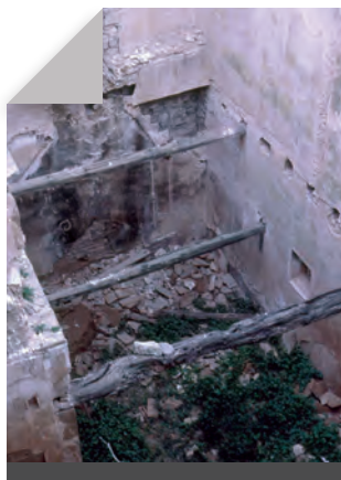
Fig. 14 - Interior de l'hostatgeria.