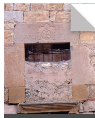
Fig. 13 - Detall de la llinda de la finestra amb la data de 1714.

● Els murs eren de maçoneria ● amb la cantonada de carreus ben ● esquadrats, amb tres finestres ● rectangulars