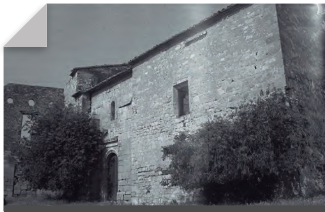
Fig. 11 - Hostalgeria 1714.

Com hem dit, era un edifici de planta rectangular de dos plantes i golfà. La coberta era d'una vessant, cap a l'est, i formava un ràfec que la rematava. Els murs eren de maçoneria amb la cantonada de carreus ben esquadrats, amb tres finestres rectangulars, la més gran al primer pis i dues de més petites a la planta baixa; una de les quals tenia una llinda amb la inscripció AÑO-creu-1714 ; la creu trinitària al mig d'un oval és un baix relleu limitat per una orla de gust clarament barroc.