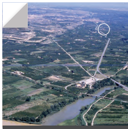
Fig. 1 - Aiguabarreig Segre-Cinca.

A Seròs, a la sortida de la població, a 2 km en direcció a la Granja d'Escarp hi ha el monestir d'Avinganya, primera casa trinitària de la Península Ibèrica i seu del Centre d'Arqueologia de la Diputació de Lleida.