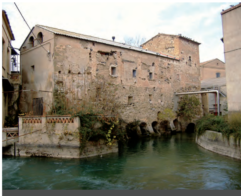
Fig. 4: Façana est del Molí d'Alfarràs l'any 2005.

Les dades de caire arqueològic que es presenten consisteixen en una valoració preliminar que pot ajudar a preveure com s'ha d'entendre l'edifici. Aquesta valoració es limita a l'observació dels alçats realitzada entre el novembre de 2012 i el gener de 2013 (fig. 4). L'edifici sobre el canal de Pinyana presenta la façana principal o est vers el Toll del Molí, on se situa la sortida d'aigües, de cara al carrer Trinitat. La façana sud presenta la porta principal cap al carrer Trinitat i dona al salt d'aigua de la fàbrica Viladés. La façana nord confronta amb els dos ramals del canal de Pinyana (en paral·lel a aquests se situen les naus de la fàbrica). La façana oest presenta l'antiga entrada d'aigües a sobre de la qual actualment hi ha un pas que permet l'accés a les golfes del molí.