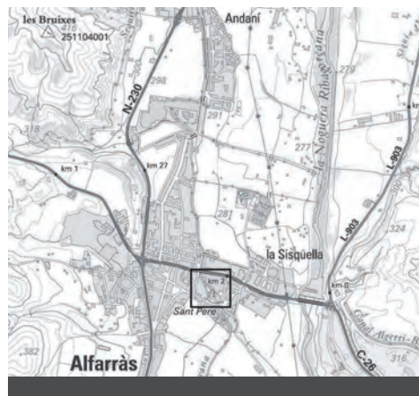
Fig. 2: El Molí d'Alfarràs en la trama urbana. Mapa: Marisa Grau i Ramon Dalfó.