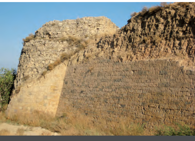
Fig. 3: Vista de l'extrem nord-est del mur de tancament del recinte sobirà i de la torres est, on es pot apreciar en detall l'aparell regular del parament exterior d'aquesta estructura així com el nivell de la part que en fou espoliada.

A una cota inferior, el recinte jussà s'articula en dos nivells que queden delimitats per un mur perimetral que els tanca. Aquesta estructura està molt malmesa i només ha conservat en alçada dos trams del recorregut originari, una de les torres que flanquejaven el portal, que des del poble accedeix al conjunt castral. Amb tot, el traçat d'aquesta estructura de tancament s'ha preservat pel fet d'adossar-s'hi les cases de la part alta del poble.