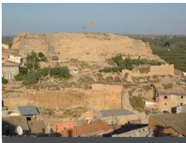
Fig. 1: Vista general del turó del castell on es poden apreciar els dos recintes de la fortificació i l'estat que presenten actualment el conjunt de les estructures preservades.

El setge que durant la Guerra dels Segadors patí el castell, amb la seixantena de defensors que hi havia, féu un flac favor al conjunt constructiu, el cop de gràcia final del qual va ser l'autorització de desmuntatge pedra a pedra, del castell i de l'església de Sant Antolí, signat pel marquès d'Aitona, en aquell moment ja resident a Madrid, molt integrat en la cort espanyola i molt allunyat dels territoris que donaven nom al seu títol. El desmuntatge fou sol·licitat pels vilatans d'Aitona l'any 1754, 3 ja que volien construir una nova església amb les pedres de l'antic castell i l'església parroquial, més al gust de l'època. L'actual església parroquial de la vila.