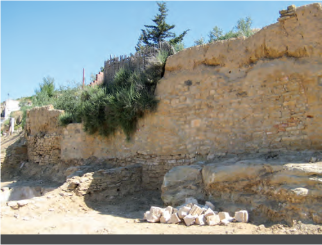
Fig. 4: Detall de l'estat que presentaven les estructures conservades de la nau de l'església durant els treballs de delimitació d'aquest espai on es poden apreciar alguns dels elements arquitectònics de l'edifici que es van recuperar.

La branca lleidatana de la família Montcada, començà en època moderna una política de matrimonis amb famílies nobles castellanes, traslladà la seva residència a Madrid i s'introduí en la cort de Castella (MOLAS 2000). El patrimoni de la plana de Lleida i Aitona amb el seu castell quedaren molt allunyats dels interessos de la família que abandonà aquests edificis a la seva sort (TORRAS 1996).