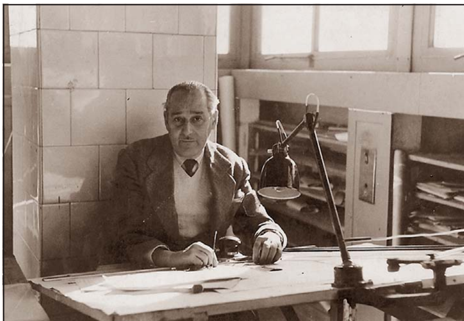
Hispano Olivetti, any 1967.