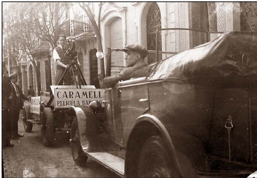
Rodatge de Las Caramellas , any 1927.