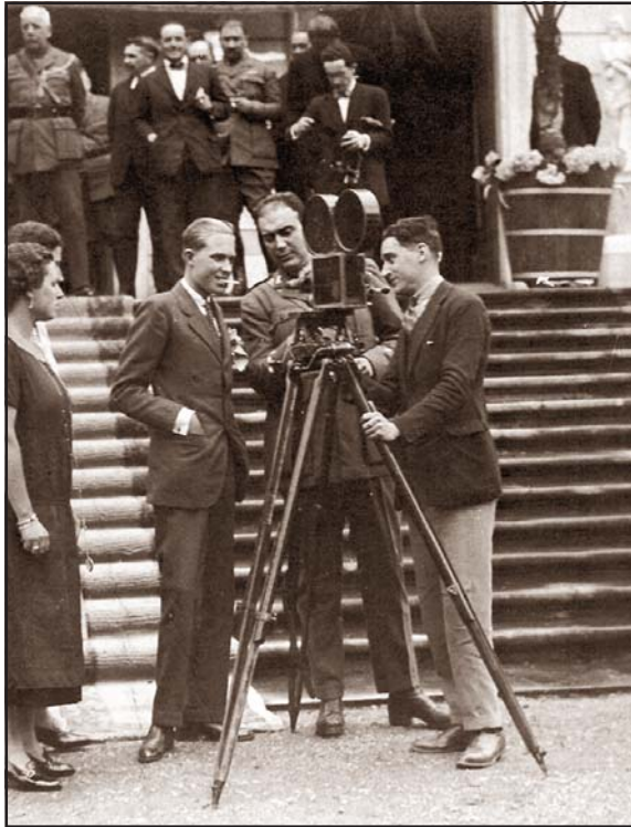
SAR el Príncipe d'Astúries, any 1925.