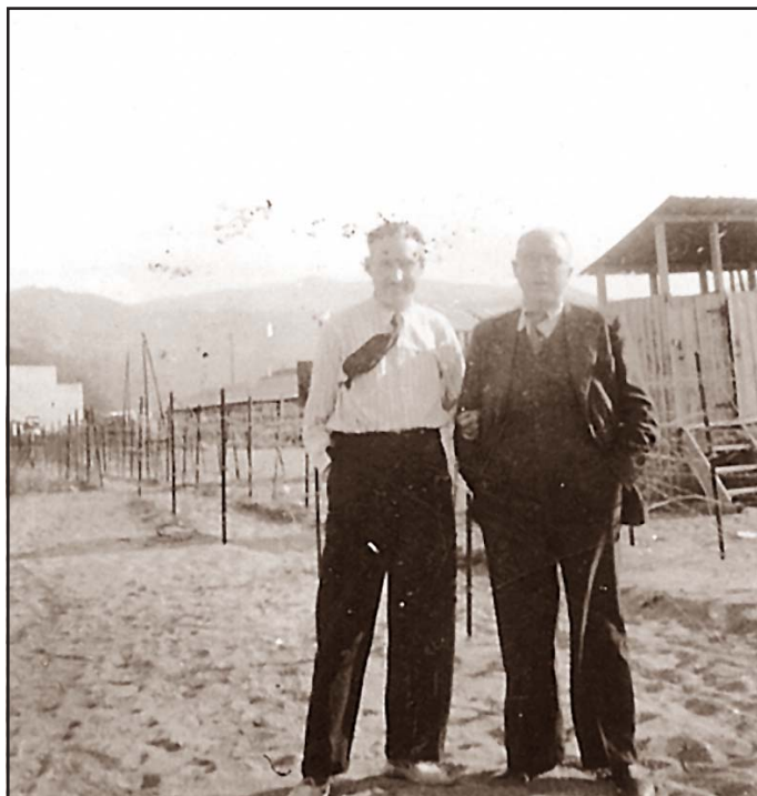
Soler al camp d'Argelers, any 1939.