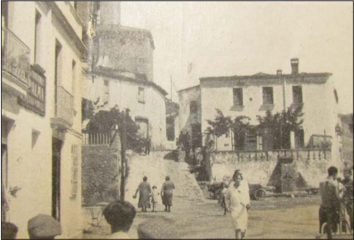
Plaça de Dosrius als anys 30. Pensament Marià 29-08-1930