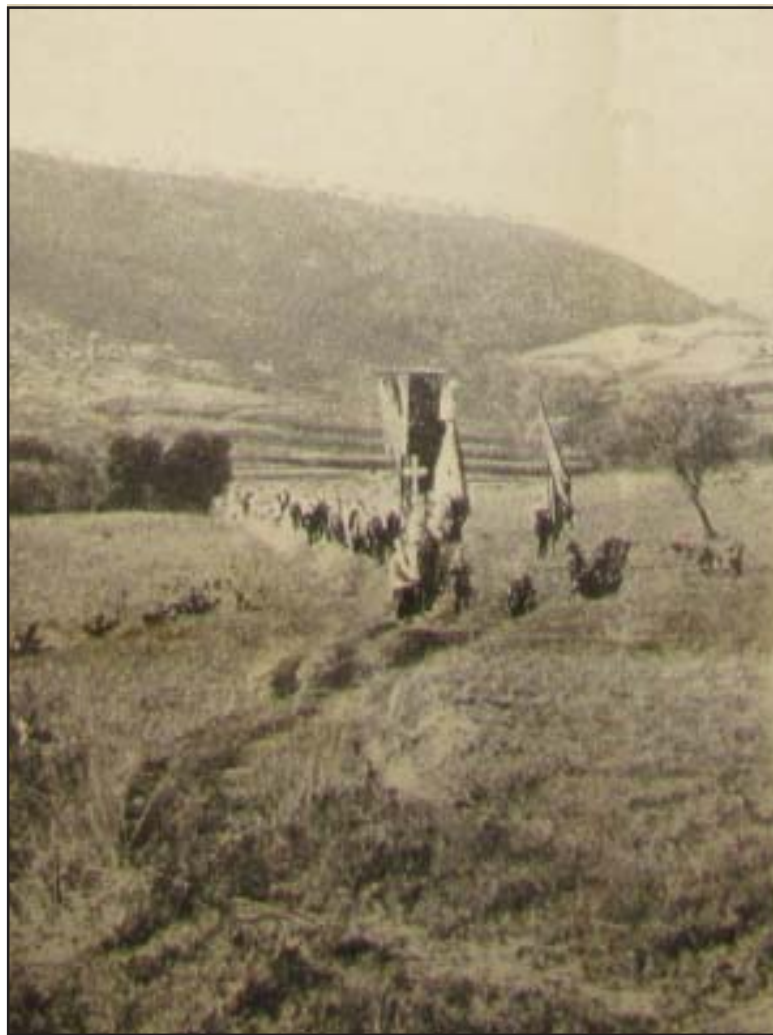
Processó a Dosrius als anys 30. Pensament Marià 29-08-1930