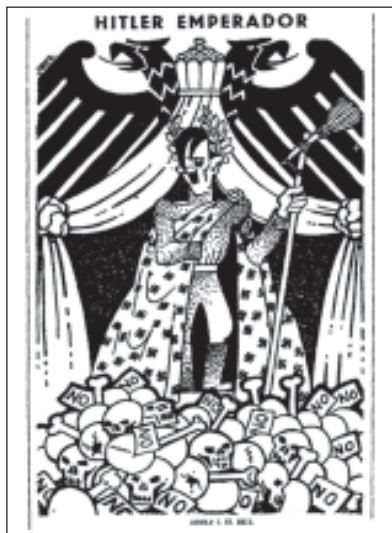
Hitler