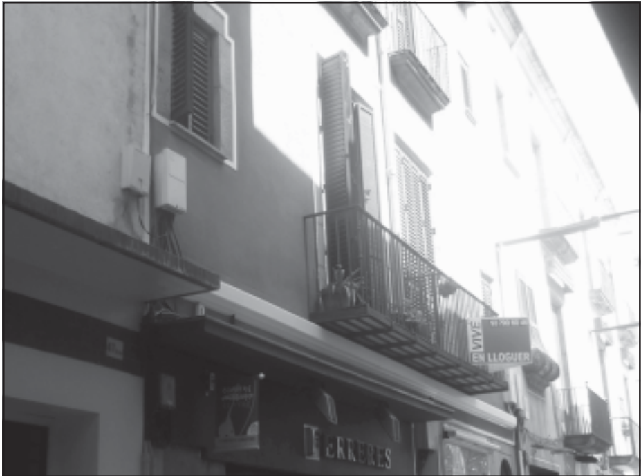
Casa natal del Fontanals, al carrer de Barcelona, núm. 49.