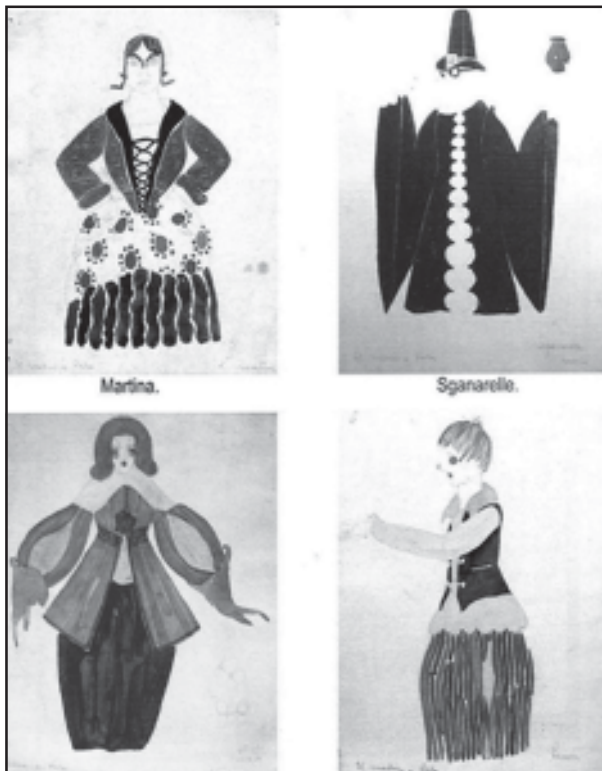
El médico a Palos de Molière. Figurins dissenyats per M. Fontanals (Museo Nacional de Teatro de Almagro. Donación Enrique Fuster).

(Aquestes imatges i les següents de Manuel, reproduïdes del llibre de Rosa Peralta).