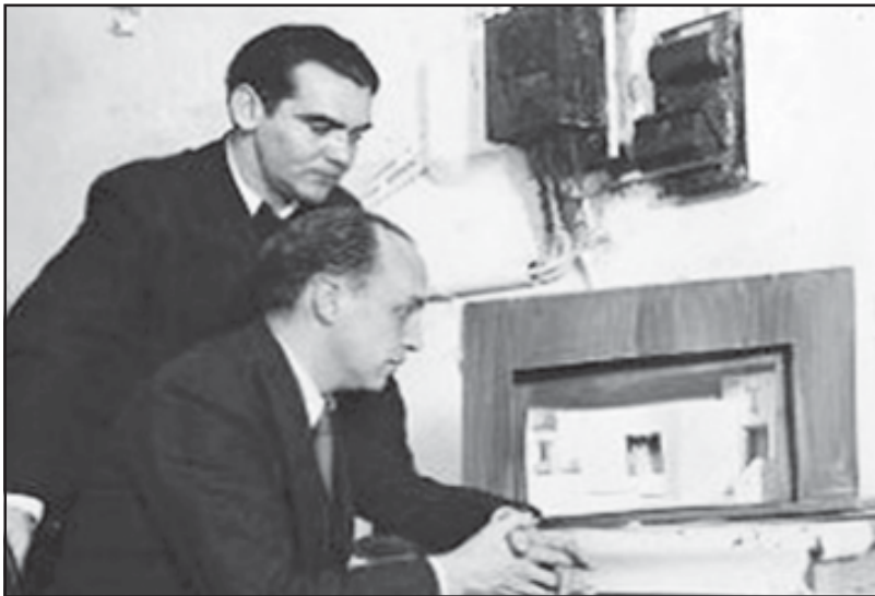
Amb García Lorca observant la maqueta d'una escena de La zapatera prodigiosa (1933).