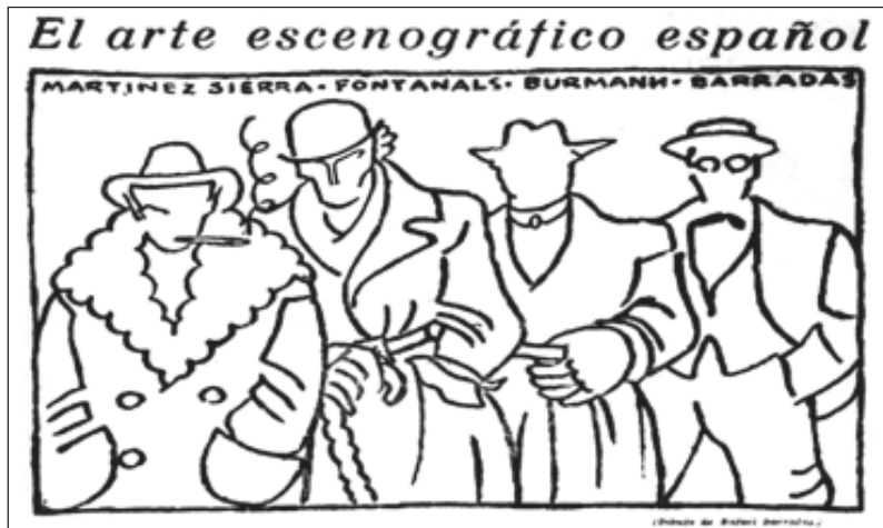
«El equipo que mató los viejos decorados», segons R. Barradas.