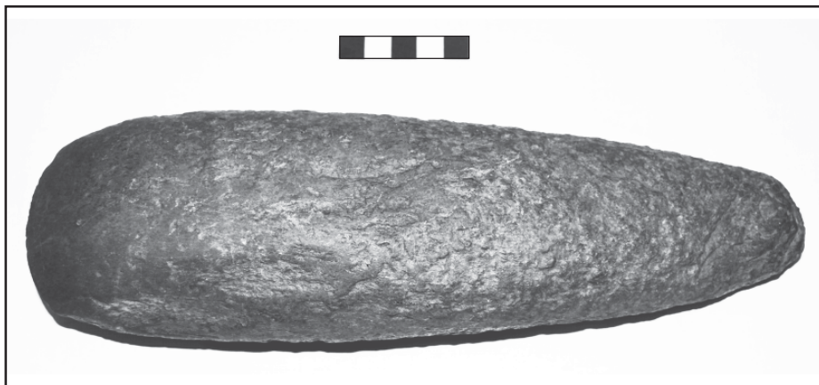
Fotografia de la destal de la Murtrera de Teià.