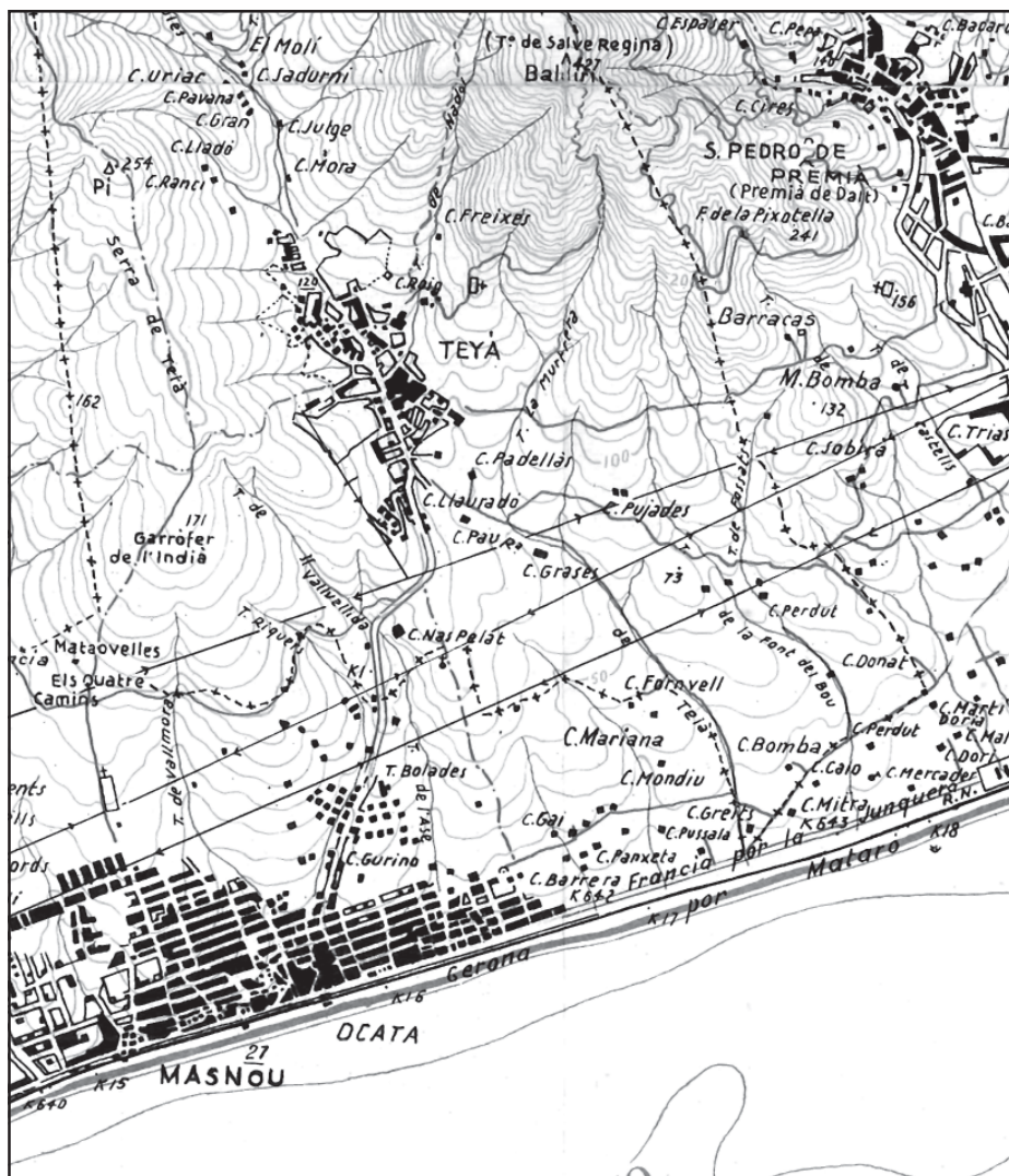
Mapa topogràfic de la zona. Sant Mateu, cercanías de Barcelona, Sant Jeroni de la Murtra, La Conreria, Céllecs, Vallromanes, Vall del Mogent, Congost, Besòs, Tenes. Ed. Alpina, Granollers. 3a edició, 1963.