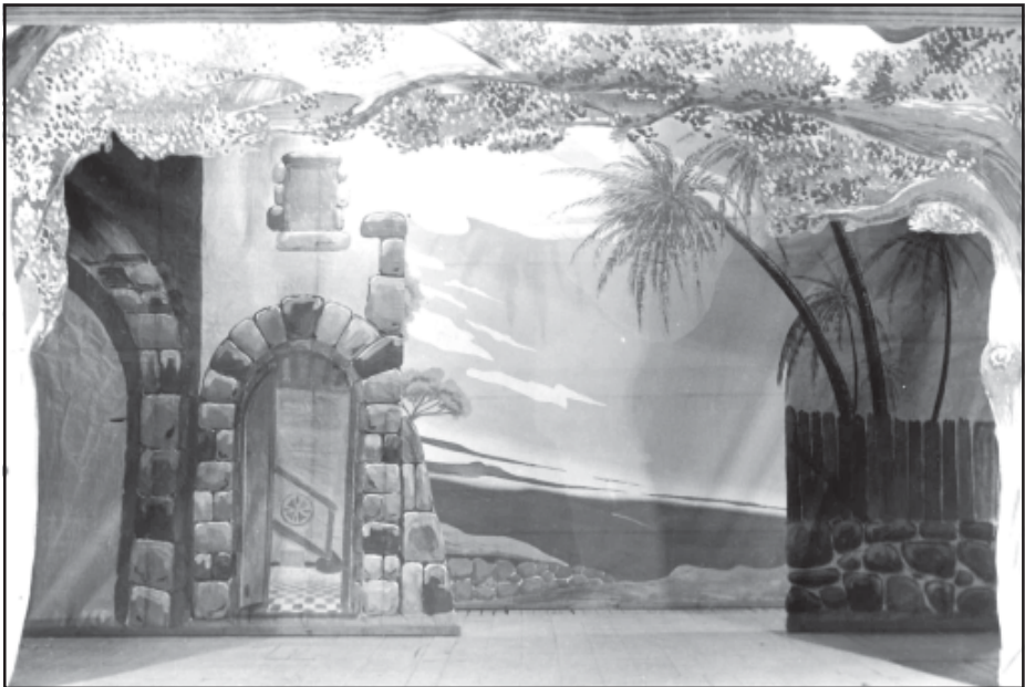
Decorat dels Pastorets (1941), realitzat per l'autor.