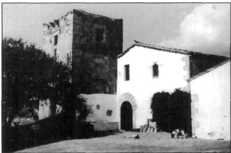
Sant Vicenç. La torre d'en Brunet (1968).

Ara giro l'esguard envers un poblet de muntanya i de mar, aquí als meus peus, Sant Vicenç de Montalt, amb el terme esmentat ja l'any 968 ( Monte Alto , el nom d'un castell desaparegut), amb les llars adossades al peu del campanar, al centre geogràfic del Maresme, i les residències temporals en expansió concèntrica davallant fins a la platja.