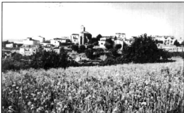
Camp de clavells a Sant Vicenç. (1966?). Reproduït d'una targeta postal comercial.

Veig l'evolució de les herbes, plantes, arbres i mentre uns tiren a centenaris, altres són de temporada. Contemplo els arbres bosquerols, uns com neixen, altres que creixen, i molts ja revellits, com alzines, pins i roures, que malgrat les xacres i replens d'esvorancs, seguint el cercle de les estacions, al seu temps van brollant, revivint i empenyent els segles, compactes després de fullatge.