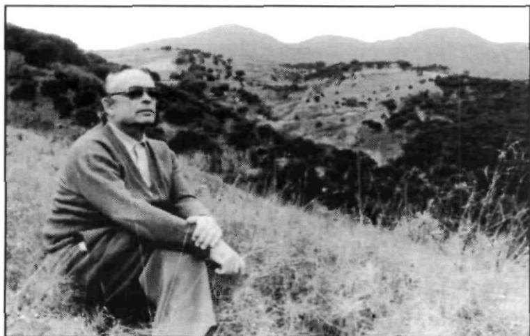
L'autor, contemplant «el bell Maresme» des de Sant Vicenç de Montalt (1977).

Mentre em vaig preparant, ja grinyola l'animal, cada cop amb més neguit, a l'eixida de la casa i, tot amb cura, per no despertar els veïns i per por del meu regany, algun lleu lladruc se li escapa, frisant ja per marxar.