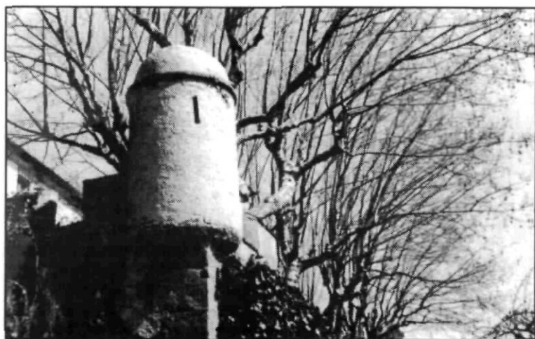
Detall de Can Milans del Bosch. Sant Vicenç (1964).

Caldes d'Estrac, vall xica de Caldetes , lloc ja anomenat al segle xi; en veure varats a les teves cales llaguts i palangreres, semblen ajocats com els pollets d'una llocada, i en aquesta hora tendra del mati, amb somris del seu esclat, em sembla que són de nacre les façanes de les llars; la tradició de vila marinera i turística et distingeix.