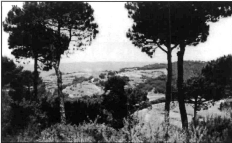
Els pins del Maresme emmarquen arreu la bellesa del paisatge (1966).

Ara, amb el sol més alt, de cara, que em fereix les parpelles, s'ha perdut en bona part aquell encant de l'alba, emperò el paisatge ha guanyat amb el contrast de l'ombra potent que s'ajeu darrere tota criatura esposada al sol i que de la superfície sobreïx.