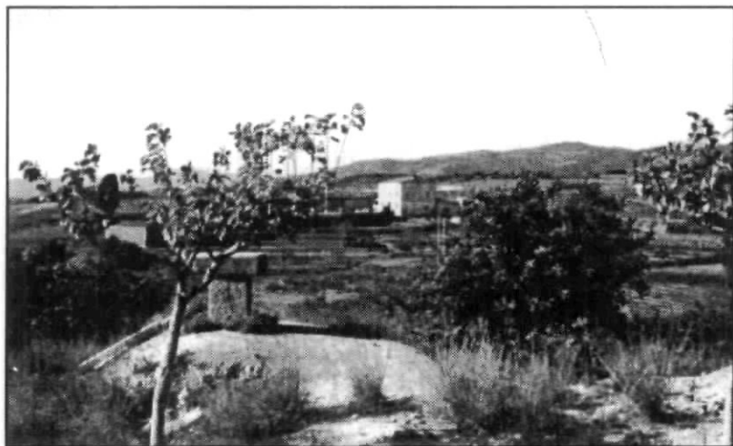
Sant Vicenç. La creu de terme del pedró i la masia de Can Jordà (1964). Ara és el Golf.

En Babú, indiferent, corre i juga esbojarrat, embocant ara una pinya seca o bé un roc i, si li plau, s'orina al peu d'un arbre. També, com tal cosa, deixa per tot arreu uns altres presents.