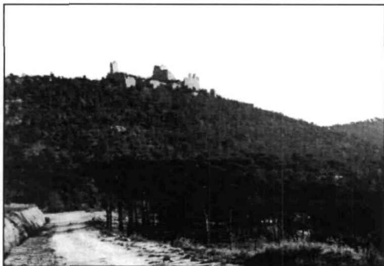
El castell de Palafolls (1966).

Més cap a muntanya, entreveig el centre d'una baronia que és el castell de Palafolls, des del 947, fent ombra de bon matí al poble de Sant Genís i bon aixopluc per al de Palafolls, ambdós atresorant preclara història.