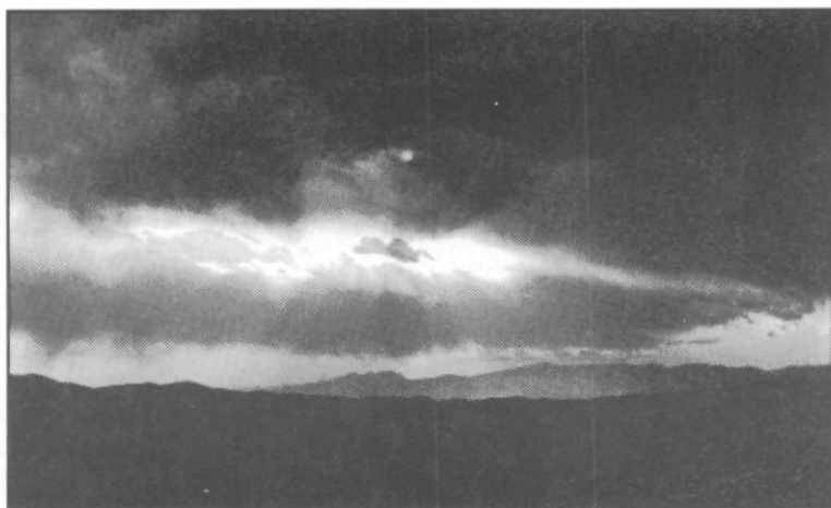
Des del Pont de la Vila, sobre Mataró, s'albira la serralada i es veu Montserrat (1967).

Jo, amb més modèstia, igualment m'haig d'acomiarar, perquè el camí i el meu temps s'han acabat. La tasca del dia m'espera.