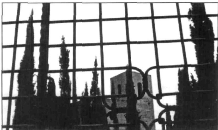
Sant Andreu de Llavaneres. Església vella i cementiri.

Sant Andreu de Llavaneres, esmentat des de l'any 968 ( Levandarias ), el teu terme extens, des del mar fins al Montalt, podria centrar-se en el monument que has erigit al teu fill il·lustre, el cardenal Vives i Tutó. Les altres virtuts que t'adornen, són de més a més.