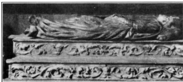
Imatge jacent de sant Desideri màrtir. Escultura en talla policromada, obra del mestre Antoni Riera de Mataró (s. XVII). Figurà fins al segle XVIII en la caixa reliquiari del sant.

La iniciativa de les rogatives partia de l'Ajuntament quan aquest detectava una forta preocupació entre els pagesos i terratinents a causa de la persistent sequera que posava en perill els conreus. Les autoritats civil i eclesiàstica s'implicaven plenament en tot el procés de les rogatives. Les autoritats locals estigueren presents