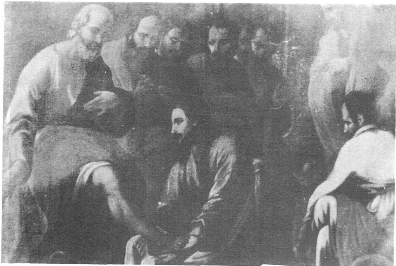
"El Lavatori dels peus a Sant Pere" , En dipòsit al Museu d'Art de Catalunya. (Detall).