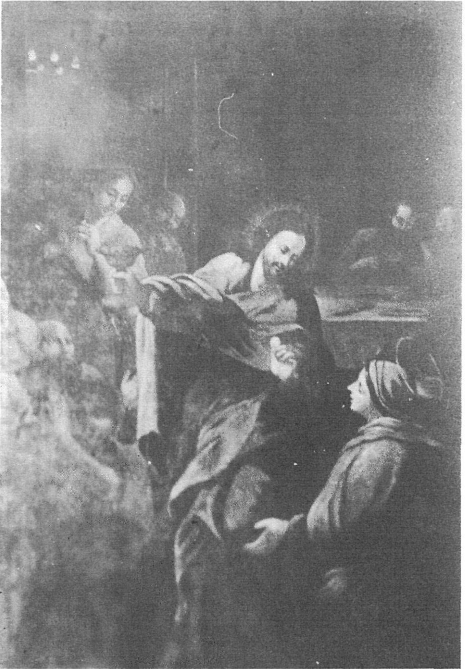
Un dels "dos quadres grans" de la Capella del Sagrament, avui a la Basílica del Pi de Barcelona. "Jesús dona la Comunió a Maria" . Restaurat pel Servei de Restauració de la Generalitat de Catalunya.