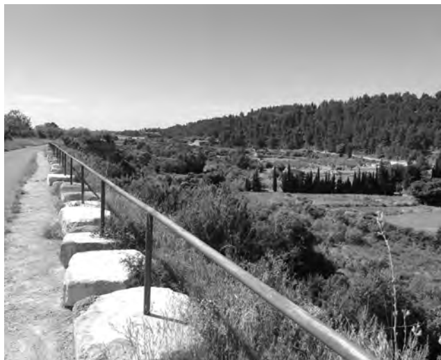
Camí de la Timba de Marraixa. Autor: Manel Serra

En aquest grup trobem un conjunt de noms que al·ludeixen a aspectes funcionals o característics molt diversos. N'hi ha que extreuen els aspectes sociològics del món rural ( camí dels Barruts ), els trets geogràfics ( costa del molí l'Abella o variant de la Timba de Marraixa ), referents a la ubicació ( camí de la Punta ), relacionats amb poblament de caire singular ( camí de casa Martí ) o agrònims de recent encunyació ( camí dels Horts ).