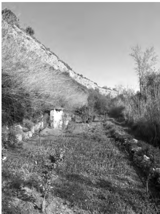
Zona d'horta de la Timba de Marraixa. Autor: Manel Serra

L'extensió territorial comprèn 375 ha i s'estructura en unes 2150 parcel·les aproximadament. A pesar que algunes xifres apunten que l'àrea de regadiu té una extensió de 225 hectàrees (GRAU i ALMUNI, 2012: 75), s'ha considerat l'extensió "potencial" d'aquesta zona i el treball s'ha circumscrit a les partides de terra on es dona aquest ús.