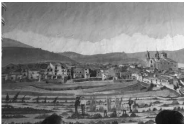
Mural de Cinctorres pintat en una paret del Molí Hospital.