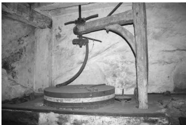
Mola del molí de farina que encara es conserva.