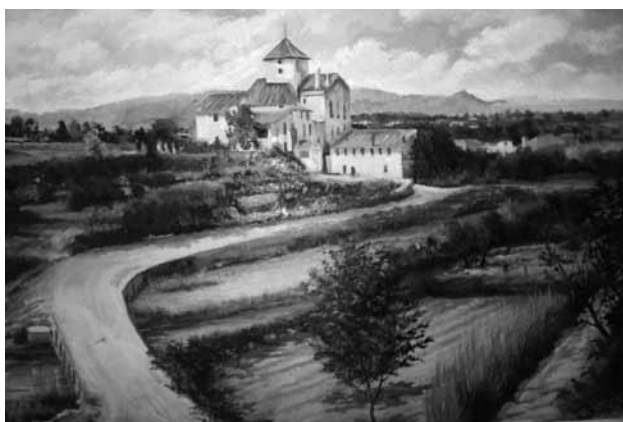
Pintura del Molí Hospital que representa la vista anterior.