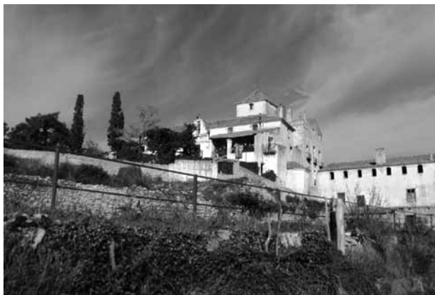
Vista exterior del Molí Hospital.

Per últim, volem agrair a les nostres famílies el seu suport.