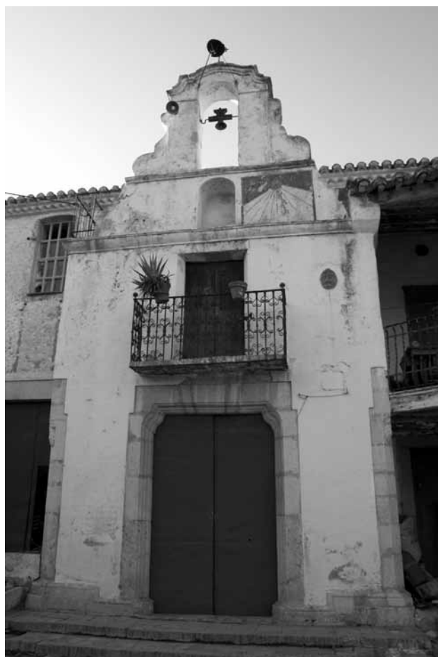
Exterior de la capella del Molí Hospital.