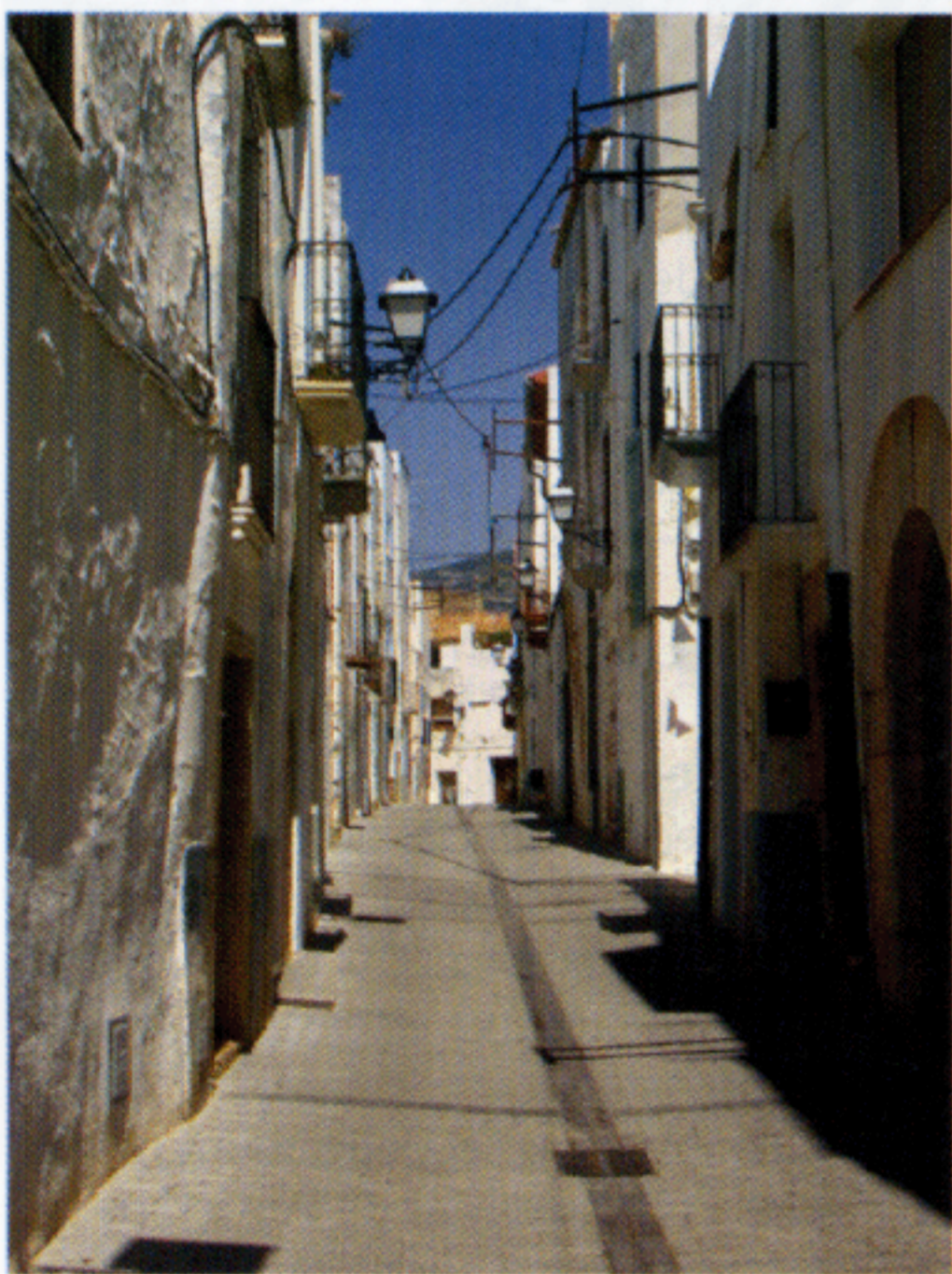
Carrer Major, un dels escenaris urbans que van ser testimoni de la presència dels exèrcits carlins a la població.

Després de la derrota soferta a Maials les partides carlistes que actuaven pel sud català i nord valencià van anar refent-se, malgrat que a l'estiu va manifestar-se un brot de còlera per tot el territori. Les partides, definides per la premsa del moment com grups de lladres, es caracteritzaven per actuar en petits destacaments i defugir de les grans concentracions, cosa que els conferia major mobilitat. Tal i com havia succeït durant la guerra