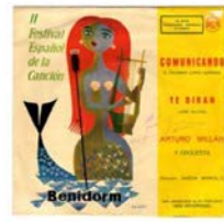
Guanyadora 1960 Arturo Millán Cançó: Comunicando