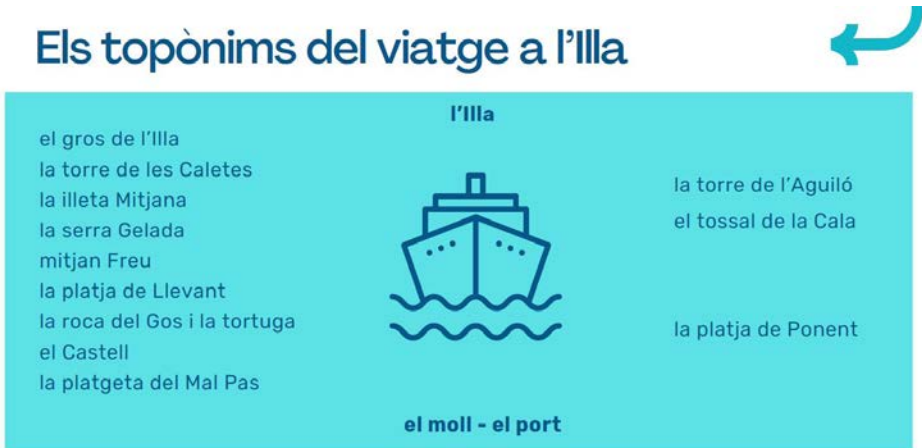
Fig. 4. El recorregut dels topònims en el viatge a l'Illa proposat.

Per a il·lustrar este trajecte, es va triar fer un Viatge a l'Illa de Benidorm , on s'estudien els topònims que apareixen durant la travessia.