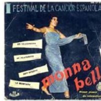
Guanyadora 1959 Monna Bell Cançó: El telegrama