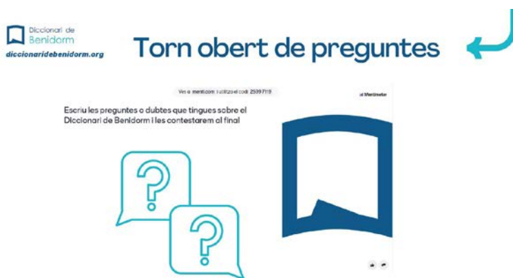
Fig. 3. Torn obert de preguntes.

Per tal de presentar propostes didàctiques per poder aplicar a les aules i produir un impacte directe i més efectiu en l'alumnat a l'hora d'utilitzar el Diccionari de Benidorm i totes les seues possibilitats, vam decidir posar com a exemple dos trajectes didàctics que ajudaran al professorat i a l'alumnat a: