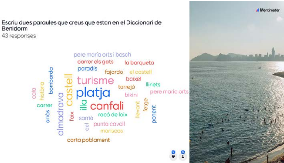
Fig. 2. Segona pregunta formulada als assistents i el seu resultat.

La segona pregunta va ser: «Escriu dues paraules que penses que estan al Diccionari de Benidorm.» Amb un total de 43 respostes, estes serien les respostes: