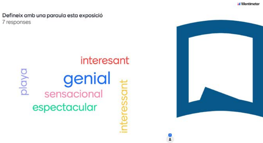
Fig. 6. Respostes dels assistents de la pregunta final resumint la ponència.