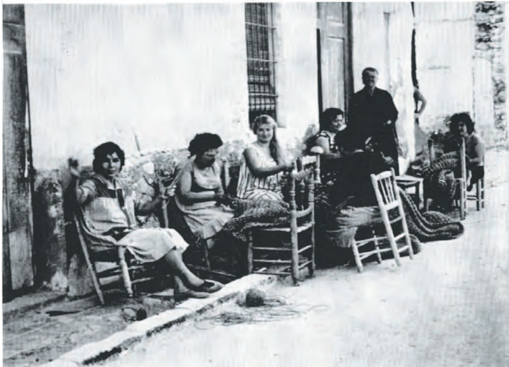
Foto 32. Xarxieres situades al mateix lloc que Sylvia Plath les veuria. Foto de primeries dels anys 62

També cal dir que el carrer de Tomàs Ortuño va ser descrit per la poetessa nord-americana Sylvia Plath en la poesia The net menders ( Les xarxieres ). Aquest poema, la traducció, el vaig trobar en BENIDORM BOLETÍN DEL AYUNTAMIENTO DE LA VILLA, corresponent a juny de 1961 i vaig escriure un article per a la Revista de Festes Majors Patronals , de l'any 2007, en què a partir del diari personal, les cartes a sa mare, aquesta poesia i les de l'aleshores marit, Ted Hughes, explicava l'estada a Benidorm. Ara ha estat reeditat en el núm. 6 de la revista Sarrià .