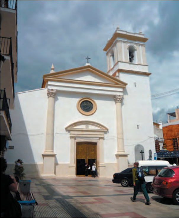
Foto. 19. L'església de Sant Jaume i Santa Anna

L'església de Sant Jaume i Santa Anna presideix la plaça on se celebren els actes religiosos de les festes patronals, les quals són el segon diumenge de novembre en honor a la patrona de Benidorm, la Mare de Déu del Sufragi. El nom original és Naufragi tal i com apareix inicialment en algun document eclesiàstic però la mateixa autoritat eclesiàstica el va canviar per Sufragio que traduït al valencià, en principi seria Sufragio i posteriorment i col·loquialment Sofratge, ortografiat així arran de l'any 1976, el qual no significa res. La primera documentació de l'església data del segle XV si bé l'actual edifici és del segle XVIII. Ara mateix, acaben de modificar la façana principal tot afegint-li dues columnes.