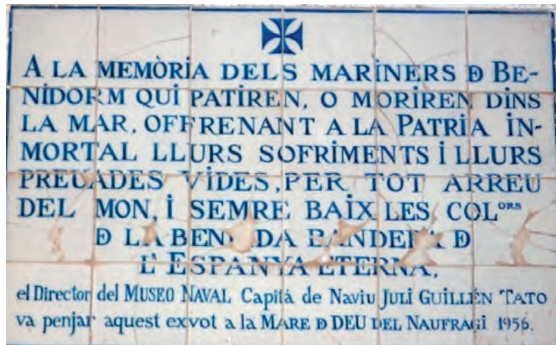
Foto 23. Placa a la memòria dels mariners de Benidorm. Arnau Almiñana

Va ser director del Museo Naval de Madrid, membre de la Real Academia Española de la Lengua i de la Real Academia de la Historia . Són nombrosos els llibres i articles que va publicar; va participar en el I Congrés d'Història del País Valencià i com a defensor de les nostres tradicions cal dir que usava la nostra llengua per parlar i escriure i quan es trobava a la casa de la partida de l'Almafrà tenia hissada la senyera amb la qual va ser soterrat.