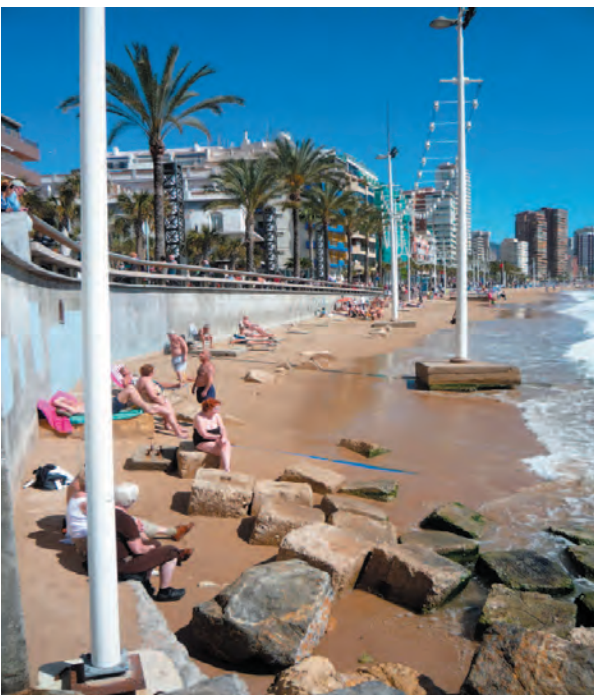
Foto 26. Blocs de ciment del Torrejón.

En aquesta mateixa plaça comença el carreró dels Gats que també està construït amb esgraons amples del mateix estil que el carrer de la Costera del Barco i la plaça de la Senyoria i amb dibuixos i té la particularitat de l'estretor en un determinat punt. Acaba en les proximitats de la plaça de Sant Jaume. El significat hem de considerar-lo descriptiu per la quantitat de gats que hi campaven per ser la part posterior de les cases dels carrers Major i del Metge Cosme Bayona anteriorment carrer del Forn.