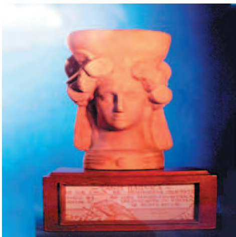
Foto 18. Deesa Tanit

causava impressió no solament per la dimensió sinó pel tipus d'arquitectura i perquè va ser capdavanter en la utilització del formigó. Durant la guerra civil, el govern de la República va instal·lar-hi un hospital. Encara es conserva l'escala que els propietaris usaven per baixar a la platja.