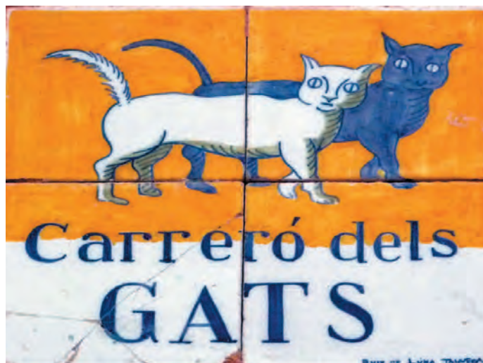
Foto 24. Placa del carreró dels Gats.