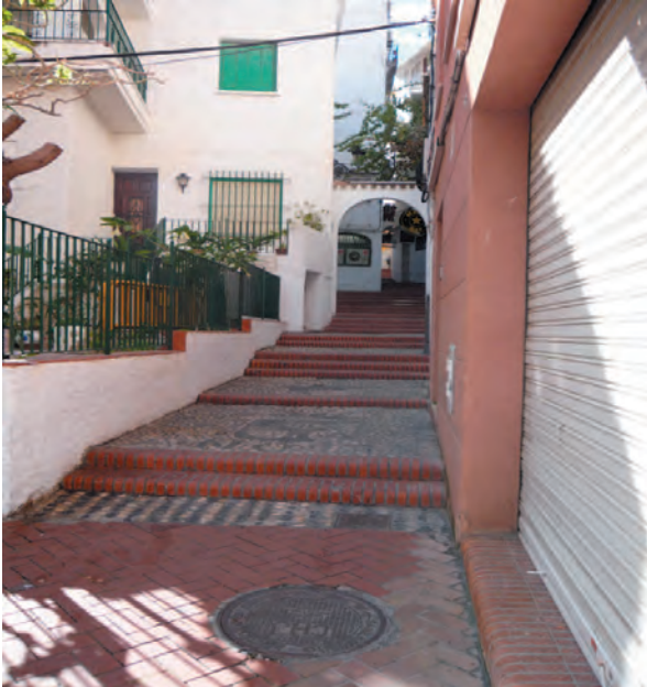
Foto 25. Carreró dels Gats.