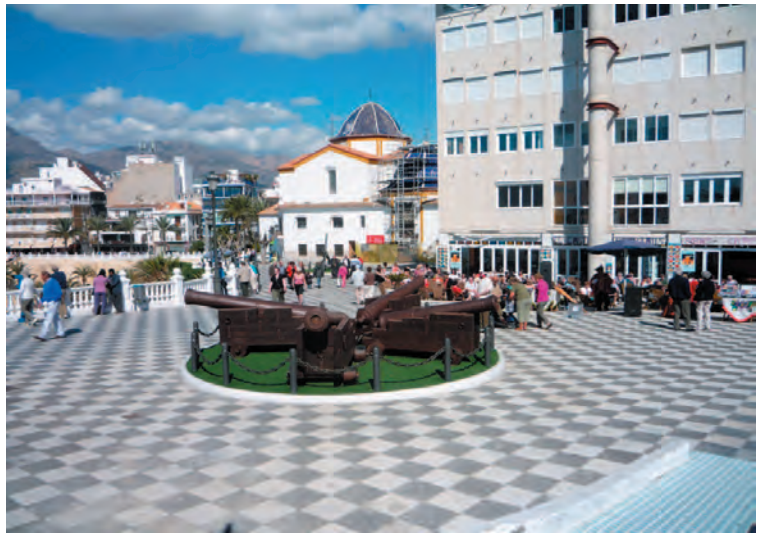
Foto 9. La plaça dels canons.