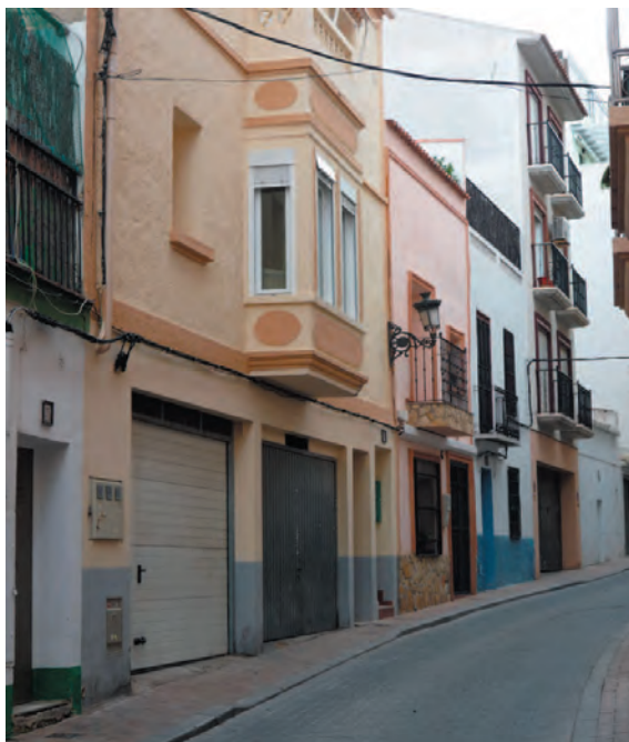
Foto 20. Cases del carrer Alacant.

Eixim de l'església per la porta lateral que dóna al carrer del Mal Pas i a uns quants metres, al cantó amb el carrer de la Santa Faç, descobrim el Restaurant del Mal Pas del qual parlarem més avant. Entrem a la plaça de la Senyoria que es troba just a la part posterior de l'església. La creu dedicada als mariners ofegats, obra de l'escultor Juan de Ávalos, presideix la plaça, entre altres elements. De la plaça, cal observar el tipus de disseny. El paviment de pedretes, cinques de platja sense arena, que formen dibuixos.