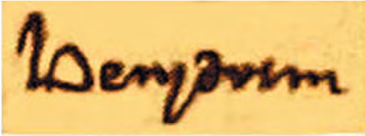
Foto 1. Primera aparició del topònim Benidorm en la Carta de Poblament

El nom de la nostra ciutat, el topònim, és d'origen preromà, PĪNNA TŪRMI , i significa penya del torm, o siga, penya de la penya que és la definició d'on ara ens trobem. Al mateix temps, tenim un altre topònim que anomena aquesta punta que divideix les dues platges, Alfalig, que ha evolucionat a Canfali i significaria el mateix però en àrab.