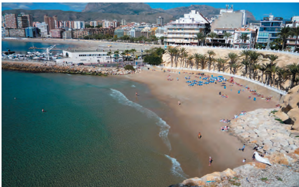
Foto 14. Platgeta del Mal Pas.

De nou, dalt, a la plaça del Castell, a l'oest, la platja de Ponent. En primer terme, tocant el Castell, la platgeta del Mal Pas, nom provinent de la perillosa baixada fins a la mar abans de la construcció del moll l'any 1925 i que en un altre moment del passeig contemplarem amb una altra perspectiva. El moll sempre havia estat un espigó però des de fa uns quants anys és un espigó amb un resguard per a les barques. El Club Nàutic, tocant.