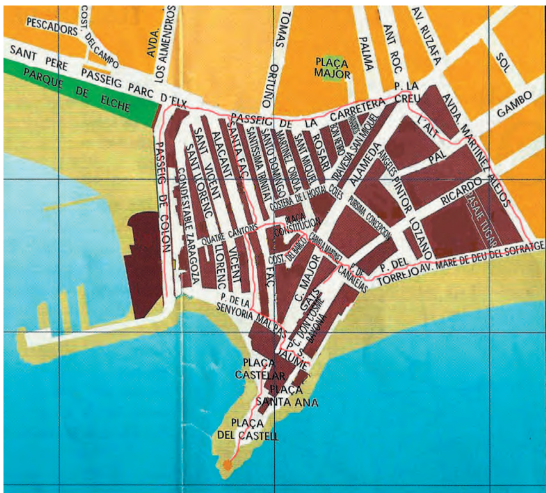
Foto 38. Plànol de la ruta

El passeig s'ha acabat i la conversa també. Ara és el moment d'usar les noves tecnologies i explicar a familiars, amics i coneguts les impressions, fotografiades o no, que hem sentit. És el moment, també, de l'anàlisi o simplement de recordar per on hem passat i què hem vist i de sentir-nos satisfets, o no, de la informació rebuda. Siga el que siga, ens haurem transformat de turistes en viatgers perquè haurem mirat i entès a poc a poc el paisatge urbà del passeig, que era, en definitiva, el que volíem