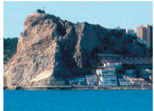
Foto 17. El tossal de la Cala.

Durant els anys cinquanta es van començar a fer excavacions arqueològiques i fruit de tot allò va ser el descobriment d'un pebeter de la deessa Tanit que roman al Museu Arqueològic d'Alacant. També es va desenterrar un bou, el qual es troba per alguna dependència de l'ajuntament de Benidorm.