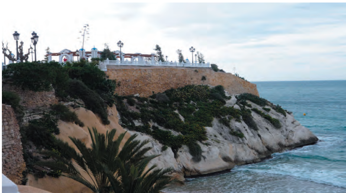
Foto 6. Restes de les muralles.

Els canons sí que sembla que van ser els últims que van defensar el bastió i que arran l'ocupació de les tropes de Napoleó i posterior retirada van llançar-los a la mar i més tard foren recuperats. I també queden restes de la muralla a la part de ponent. Serà a primeries del segle XIX quan són enderrocades les muralles. El Castell com a defensa de la costa havia tingut importància des que l'almirall Bernat de Sarrià va fundar Benidorm el 1325. Era el lloc de salvaguarda, primer de les incursions àrabs, i, posteriorment, dels atacs dels pirates que pul·lulaven pel Mediterrani. Posteriorment, dins la línia de defensa, el Castell tenia dues torres de guaita, de vigilància, situades a l'est de la badia, a la serra Gelada, la torre de les Caletes que la podem veure mig enderrocada i l'altra, a l'oest, en terme de la Vila Joiosa, la torre de l'Aguiló, la qual ha estat reconstruïda recentment. La torre de les Caletes va ser construïda a mitjans segle XVI i no ha tingut la sort de ser reconstruïda per la municipalitat benidormina tot i ser l'edifici històric més antic de Benidorm.