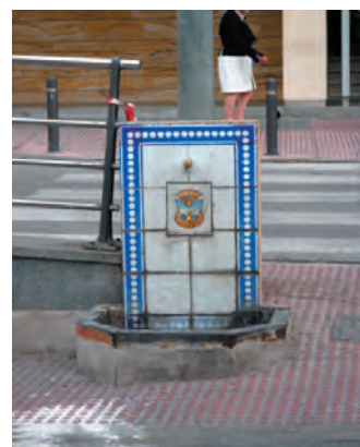
Foto 36. Font de la Costera del Campo.

Arribem al carrer de la Santa Faç i pugem en direcció al Castell i ens trobem una capelleta amb la imatge de la Santa Faç, la placa commemorativa és posterior a la imatge; no és l'única existent en d'altres carrers dedicats a sants.