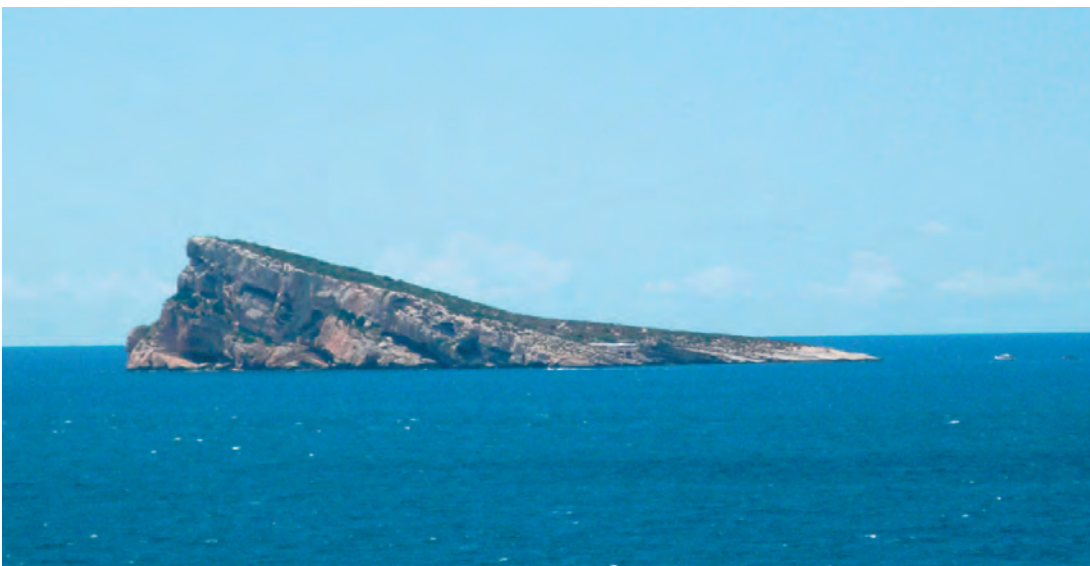
Foto 2. L'Illa

Segons conta la llegenda, l'Illa es troba enmig de la badia perquè la va posar d'una potada el cavall blanc de sant Jaume i per això al Puig Campana li falta un tros. El tall del Puig Campana en realitat és un efecte òptic des de la perspectiva de Benidorm. Si el mirem des de la Vila Joiosa o des d'Altea no es veu igual. Com a exercici visual podem contemplar-lo en un viatge des d'Altea a Benidorm per l'autopista i comprovarem com és de diferent, es veu una muntanya amb un cim punxegut; de la mateixa manera podem mirar-lo des de la Vila Joiosa i tampoc serà igual com el veiem des de Benidorm. El Puig Campana és la serra més alta que podem veure des del Castell, situada quasi tota al terme municipal de Finestrat.