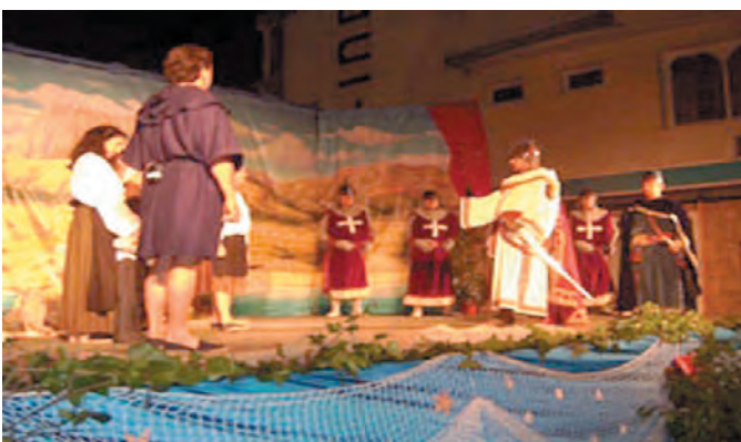
Foto 3. Representació de la Fundació de Benidorm