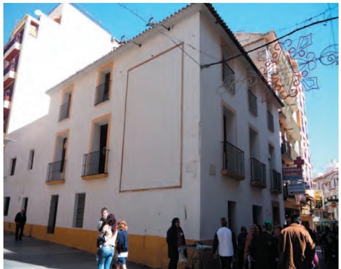
Foto 31. L'Ajuntament vell.