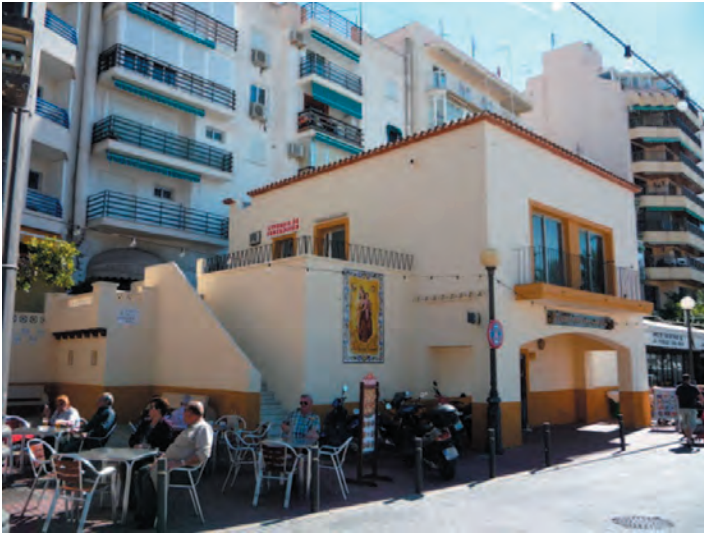
Foto 33. Antic edifici del Pòsit de Pescadors.

Situats en aquest punt, podem contemplar el moll i la platja de Ponent de nou, la qual si arriba on ens trobem és perquè es va construir el moll l'any 1925, com ja havíem dit des de la perspectiva del Castell, perquè sinó continuaria arribant la mar fins ací. També veiem l'edifici que era el Pòsit de Pescadors i que ara és el Centre Cultural Marítim . En aquest punt, fa uns anys s'ha condicionat el voltant i ha aparegut la placeta dels Tarrafers en homenatge als pescadors de tarrafa. Aquest art de pesca consisteix a pescar peix blau, sardines i aladroc, sobretot, durant la nit amb unes barques amb fanals i amb xarxa. Durant les nits es podia veure una filera de llumetes en l'horitzó de les tarrafes mentre pescaven. I ara, caminant pel passeig de Colón , és el moment d'explicar per què aquesta part de Benidorm és diu barri de les Roques i ho fem mirant en direcció al moll i comprovem com els edificis estan construïts sobre roques, per això el nom del barri de les Roques. I si arribem al final del moll, veurem l'escala del Mal Pas i compredrem el nom. I també veurem la platgeta del Mal Pas, les restes de la muralla i el Castell.