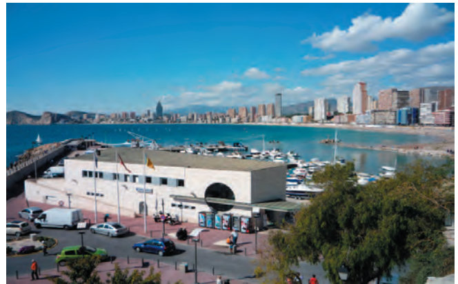
Foto 13. Platja de Ponent.