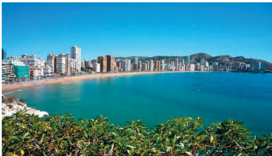
Foto 4. Platja de Llevant.

L'últim gran canvi turístic ha estat trencar l'estacionalitat dels mesos d'estiu perquè Benidorm siga visitable durant tot l'any. Però hem de fixar-nos en els edificis que no passen de cinc plantes. Són els primers edificis que es van construir seguint les ordenances del primer PGOU (Pla General d'Ordenació Urbana) que es va aprovar l'any 1956. També hem de fixar-nos en els pocs xalets de primeries de segle XX que han perdurat. Aquests tres tipus d'edificacions sí que marquen tres conceptes de turisme. Els xalets de famílies benestants de primeries de segle XX