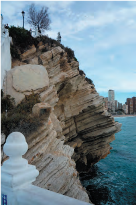
Foto 12. Punta del Canfali.