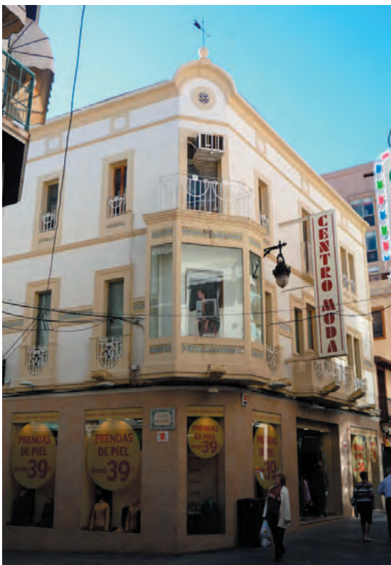
Foto 30. Antic edifici de Telègrafs.