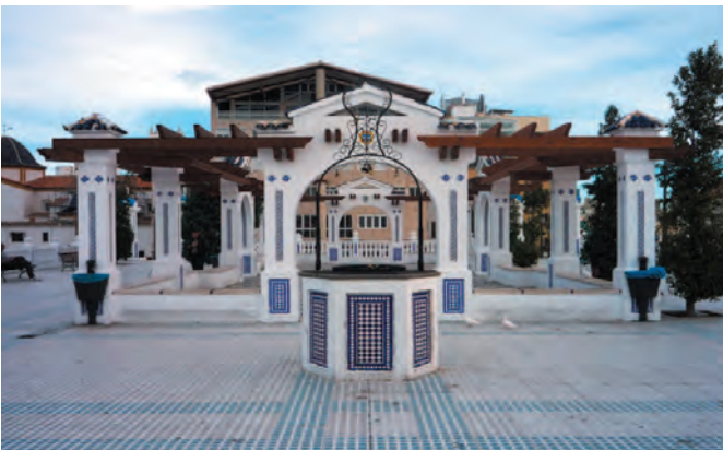
Foto 10. El pouet.