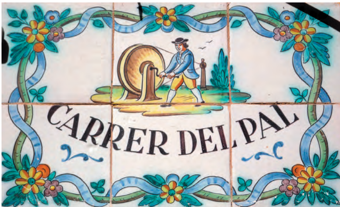
Foto 28. Placa del carrer del Pal.

Però sí que conserva l'ús de l'espai públic perquè els bars posen taules i cadires tan si fa bon temps com si no. I pugem fins arribar a la rosa dels vents que hi ha al terra just en l'encreuament amb el carrer del Gambo que és on ara es troben les botigues i el nivell econòmic que en un altre temps tenia aquesta avinguda de Martínez Alejos.