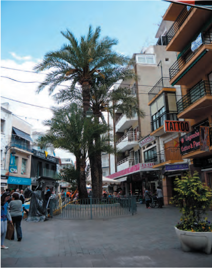
Foto 29. La Palmera.

ens el podem endur, entre altres picadetes típiques com les faves sacsades. I així continuem fins arribar a l' Alameda i a mà dreta tenim la plaça de la Creu, coneguda com la Palmera perquè des de temps immemorials hi havia una palmera i és el lloc de quedar per vore algú; actualment, són quatre le palmeres. Ens trobem a l'entrada a Benidorm del camí Reial de València i posteriorment la carretera general Alacant-València i ara carrer del Passeig de la Carretera, el primer nom del qual va ser carrer de la Mar.