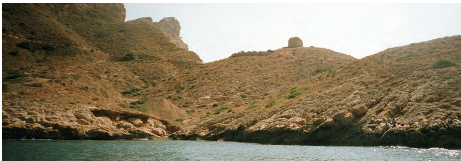
Foto 7. Torre de les Caletes.