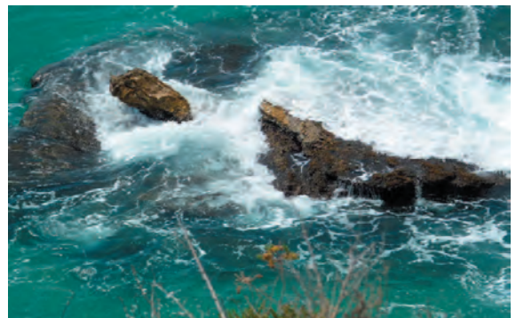
Foto 11. La Tortuga i el Gos.