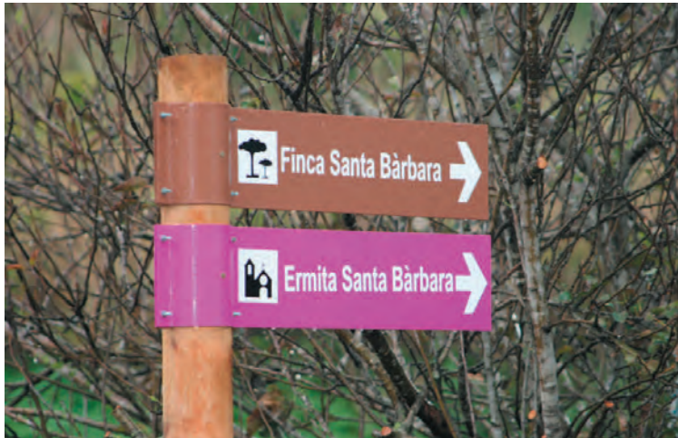
Foto 2. Nous indicadors municipals assenyalen en aquell punt del camí la finca i l'ermita de Santa Bàrbara: