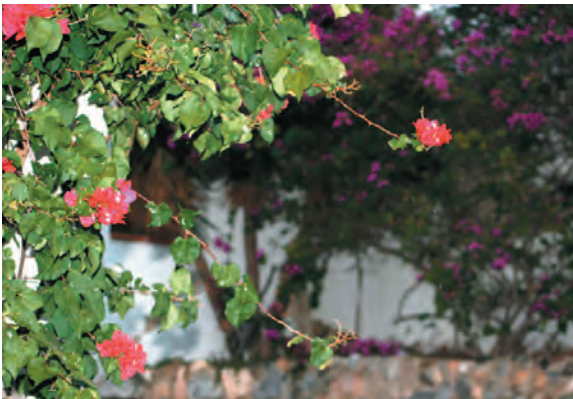
Foto 12. La buguenvíl·lea fredolina de la costera del Rector Llinares