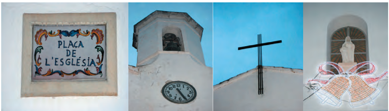
Fotos 22, 23, 24 i 25. Plaça de l'Església