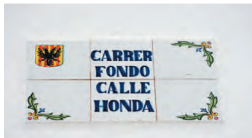
Foto 11. Un cartell de sis manisetes,

«Però papi, afanya't: que no veus que em banye?», reclama el fill. El vinc a trobar amb el paraigua. I el rescate just davall d'una buguenvíl·lea fredolina i esquelètica, que amb penes i treballs aconseguix trepar — esforç de rames retorçudes, excés de flors rogenques — la paret blanca i nua d'una casa que es ven. Ja junts, pare i fill continuem l'ascensió i, de sobte, a mà esquerra — de seguida — es produeix una xicoteta meravella. És el carrer Fondo, que proposa un joc de racons, amb parets trencadisses; una elegància de finestres, portes i balcons. El passareu amb a penes un grapat de passos. Val la pena assaborir-los, un a un. I acceptar el ziga-zaga que proposa amb lentitud cerimonial. Un cartell de sis manisetes, encapçalat amb l'escut d'Altea (l'àguila bicèfala damunt d'una senyera), n'anuncia l'inici, de la discreta fantasia: «Carrer Fondo», diu. I davall afegeix, en un d'aquells prodigis malabars de la sociolingüística local: «Calle Honda». I ens admirem que, a Altea la Vella — exactament igual que a Altea —, el carrer Fondo de jugar a pilota pugui tindre el nom d'una marca japonesa, de cotxes i motos...