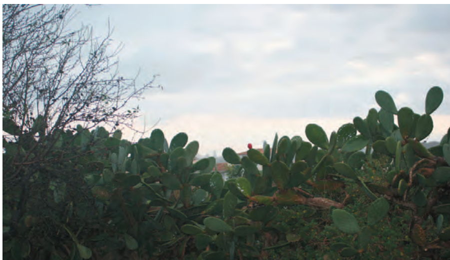
Foto 15. Boscatge de figues de pala

Decidim continuar. I el carrer Fondo, que de sobte fa una revolta a la dreta, es converteix fortuïtament en el carrer del Calvari. I és que el passeig que circumval·la el poble fa ací un angle bruscat de noranta graus. I el canvi d'orientació, cap a la cara nord, comporta una substitució de realitats. En el paisatge, en el relleu urbà, en tot. Fa més vent. Més aiguaneu. Més gelor. I el transmutament sobrevingut em recorda ara les processons fredes de la infància, quan els xiquets suportàvem amb indolència la paradoxa de l'abric fort amb els pantalons curts indefectibles.