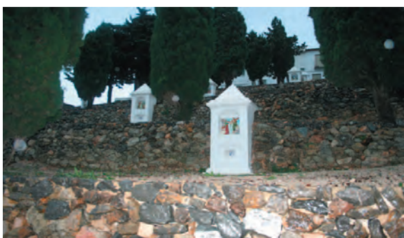
Foto 16. El Calvari

Recorde els ciris, el Cristo, la gent. Llumetes trèmules seguint, en renglera, els mateixos carrers que ara recorrem; testimonis d'un caliu de fe en la nit fosca —fredosa— del poble i del temps. Respecte, silenci, oració. La banda de música. Remor incerta d'una marxa de processó. Les galtes enrogides, el gest distés, un somriure secret. I mentre els majors professaven fe i coneixences, els menuts concentràvem esforços a mantenir encesa la flama del ciri processional. Com si ens hi anara el món. Tot ho recorde ara, al carrer Calvari, quan el vent de neu m'apaga els sentits allà on de menut m'apagava el petit foc d'ofrena a Déu. És el Calvari un espai sagrat: de penes i felicitats. No debades els viaranys de la passió són sempre ascendents, trencats, tortuosos. Però uneixen, com els xiprers —verticals, sempre verds—, l'afflicció de la terra amb l'alegria del cel: el dolor i el plaer, la pols i la llum, els homes i els déus. No cal ser catòlic per a creure, fervorosament, en l'espiritualitat d'un lloc com aquell on, estratègicament distribuïts per marges i camins, capelletes blanques i xiprers fantasmals assenyalen, enllà de dogmes i confessions, el sentit apicular —de l'origen i el final.