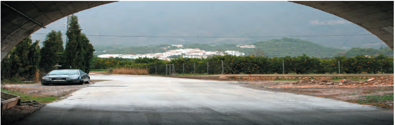
Foto 1. El túnel de l'autopista i el Poblet de les Cases.

Desembre de 2009. Hivern incipient. Vaig a Altea la Vella com qui torna als orígens. Ha arribat, sense avís previ, la minsa ració de fred que anualment pertoca al nostre redós de Mediterrània. El nostre és un hivern de mentidetes. Un simulacre d'hivern, empeltat de primavera. Però un simulacre convincent, al cap i a la fi: en un parell de dies —ho anuncien els homes i les dones del temps— el Ponotx, Xortà, Aitana i el Puigcampana es cobriran de neu. També Bèrnia.