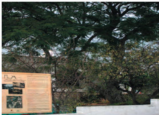
Foto 5. Rètol que presideix un cartell informatiu: "Ruta del agua".

El cartell de la "Ruta del agua" —turístic, divulgatiu— ens recorda que «Altea la Vella afona els seus orígens en el més profund de la història»; que «durant els segles XV i XVI el nombre d'habitants va anar disminuint, fins a despoblar-se cap al 1560»; i que «a principis del segle XVII una nova vila fou fundada a l'altre costat de l'Algar, que amb el temps, acabà tomant [sic] el seu nom». No convé oblidar-ho: Altea, en els orígens, és en realitat Altea la Vella. Clarament: el poble d'Altea que apareix documentat i localitzat en textos i mapes anteriors al XVII és, en veritat, Altea la Vella. I per a qualsevol alteà, pujar al poblet de les cases hauria de significar —per això— remuntar el viaró simbòlic de la provinença.