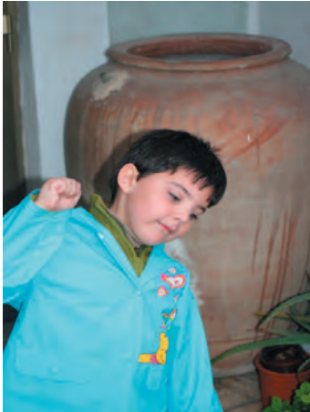
Foto 7. El rebedor d'una casa amb una gerra gran,