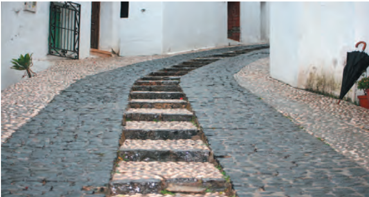
Foto 6. Les pedres anuncien el centre ver de la població.