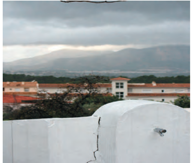
Foto 8. El Puigcampana darrere de la font.

Com l'empedrat del carrer, les línies d'aquella gerra —que un dia va servir per a guardar oli i que ara tot just guarda el testimoni mut d'un món rural en extinció— són un homenatge al bon gust de les coses senzilles: un miracle inadvertit de formes elementals i bàsiques, amb valors estètics genuïns, primaris, racials. La veritat: no sabia expressar-ho com cal, però tinc la intuïció que és només des de l'habitudo de perfils, colors i volums primordials —com el d'aquella gerra— que acabem conformant uns paràmetres des dels quals assaborim i admirem la bellesa de la geometria, de l'art, del món.