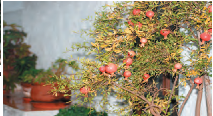
Foto 13. Un magraner de joguet,

Des del patí profanat dominem els bancals immediats, de tarongers, garrofers, ametlers. I oliveres. Sobretot oliveres: amb aquella color verda i platejada que, amerada de pluja, és la color més bella i misteriosa que la terra ací dóna.