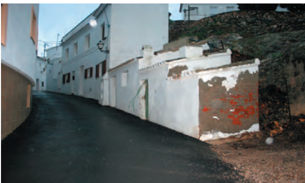
Foto 17. Casupets i llenya