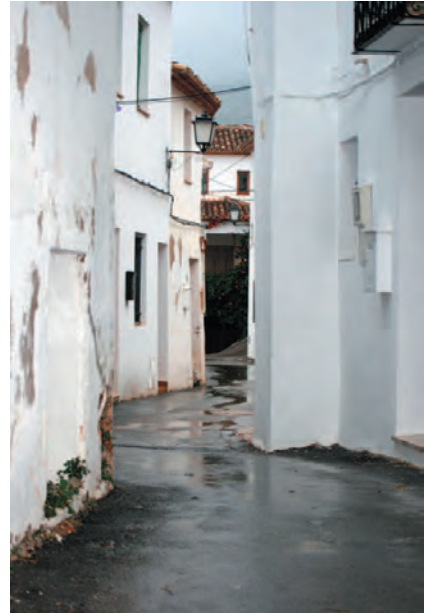
Foto 10. El carrer Fondo