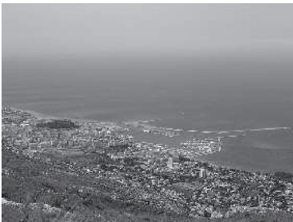
Figura 2. El port de Dénia. Gran part dels moriscos de la Marina i de les comarques veïnes embarcaren en el port de Dénia camí cap a l'exili del nord d'Àfrica