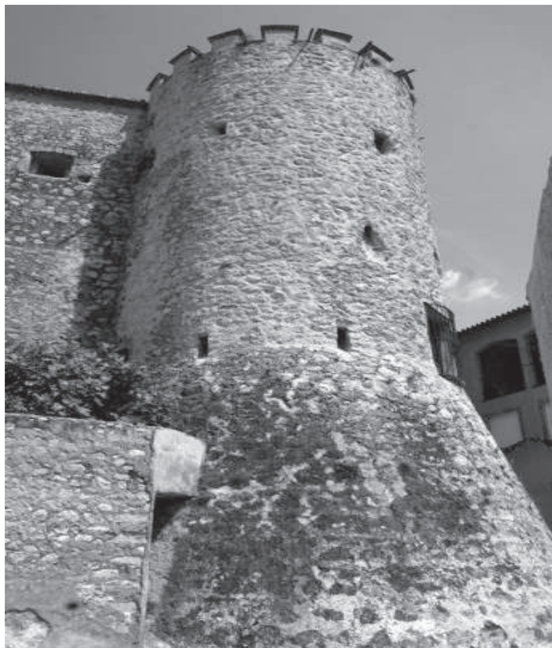
Figura 1. Església fortaleza de Murla. En el sufocament de la revolta morisca, aquest edifici es convertí en el centre de les operacions militars de les tropes reials