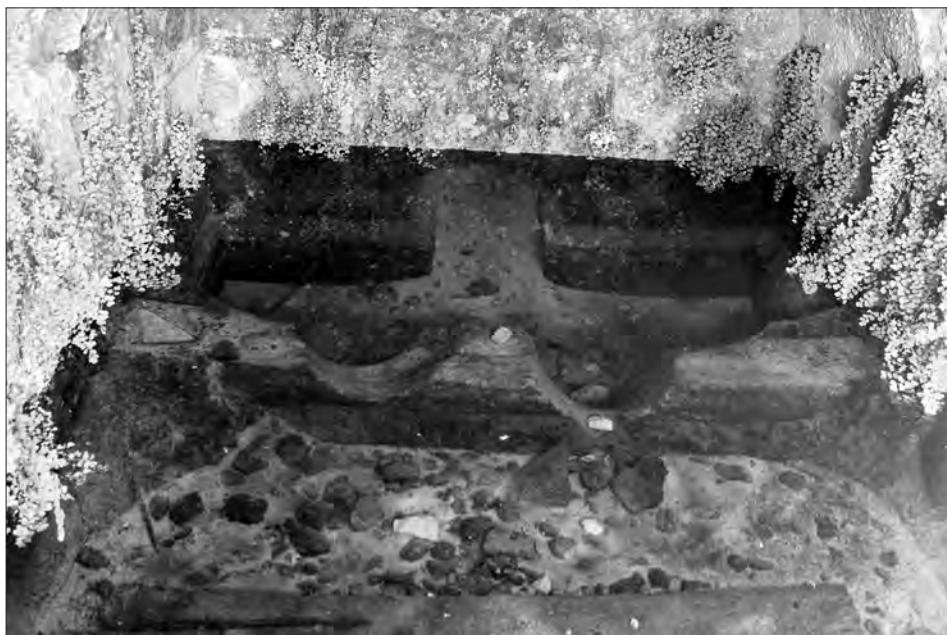
Fig. 3. La fonte antica posta accanto al mausoleo a tumulo, tuttora sgorgante