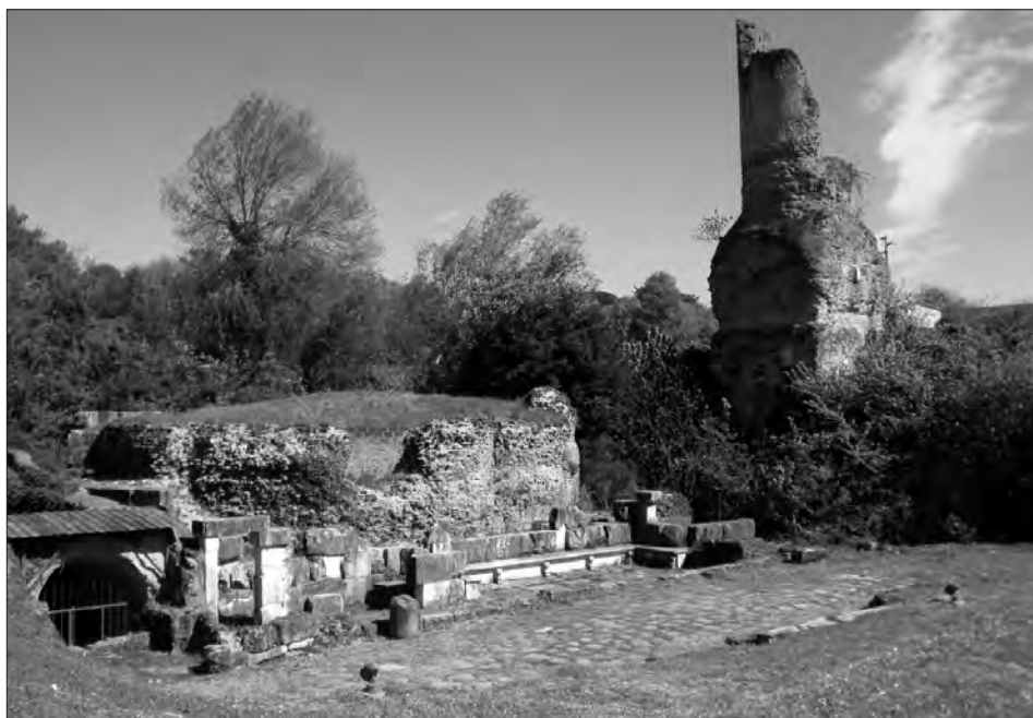
Fig. 2. Il mausoleo funerario a tumulo posto lungo la via Flaminia antica ad Oriculum