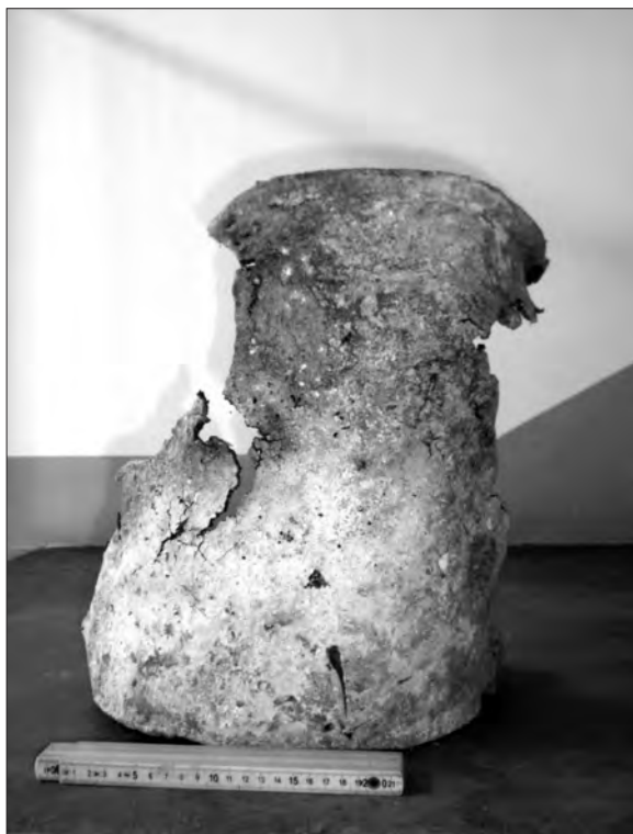
Fig. 4. Il secchio troncoconico di bronzo rinvenuto nel corridoio posto a NE dal mausoleo funerario a tumulo (inv.: 570203)