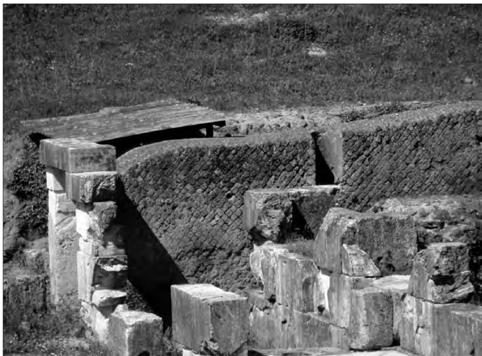
Fig. 1. Il corridoio di servizio del mausoleo funerario a tumulo delimitato dal muro in opera reticolata, dove fu trovato il secchio di bronzo, nel 1989