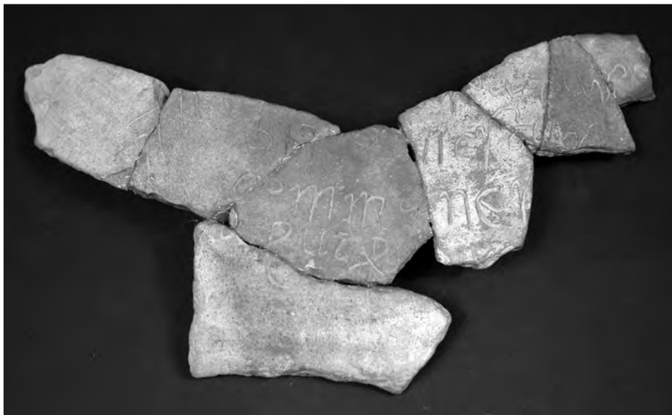
Fig. 3. Grafito de Fontcalent (Alicante).

tan escasos restos, según los cálculos de Büchner pudo haber sido una vasija de 50 cm de diámetro, 1 m de altura y muy fina, de 0,8 cm de grueso. Por tanto en este caso no se trataría de una jarrita pequeña sino de un contenedor que presentaba su leyenda en el hombro según Gutiérrez Lloret, es decir entre el diámetro máximo y la boca 26 . Del texto, grabado entre dos hojas de palma, queda lo siguiente: