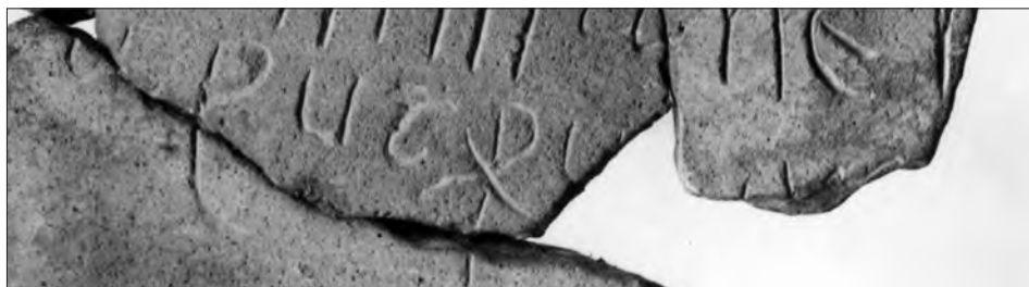
Fig. 4. Detalle de la última línea.

Más complicado es el final de la cuarta línea donde, detrás del crismón, tenemos algunos restos de letras (véase fig. 4): el primer carácter no hay duda de que es una V, a continuación quedaría espacio para una o dos letras hasta los dos trazos que quedan delante de la última letra que, en nuestra opinión, es la parte superior de una S final igual a las tres últimas S de los renglones anteriores. Llobregat, primer editor del texto, omitió todos los vestigios. Büchner leyó correctamente la primera V y al final una A y una M por lo que restituyó v[i]am una solución poco afortunada que le llevaría a pensar que hace referencia al lugar donde habitaba —quizá provisionalmente— el individuo mencionado en la primera 28 . Corell-Gómez interpretaron por primera vez la inscripción como sepulcral entendiendo commane(n)s como un participio de presente que equivaldría al más habitual manens utilizado normalmente bien con la acepción de «habitar» bien con la de «vivir con alguien». Como afirman estos autores, es más habitual la estructura sintáctica preposicional del tipo manet cum Christo 29 para expresar que el difunto ya está muerto y junto a Cristo. Hasta aquí estamos de acuerdo con ellos.