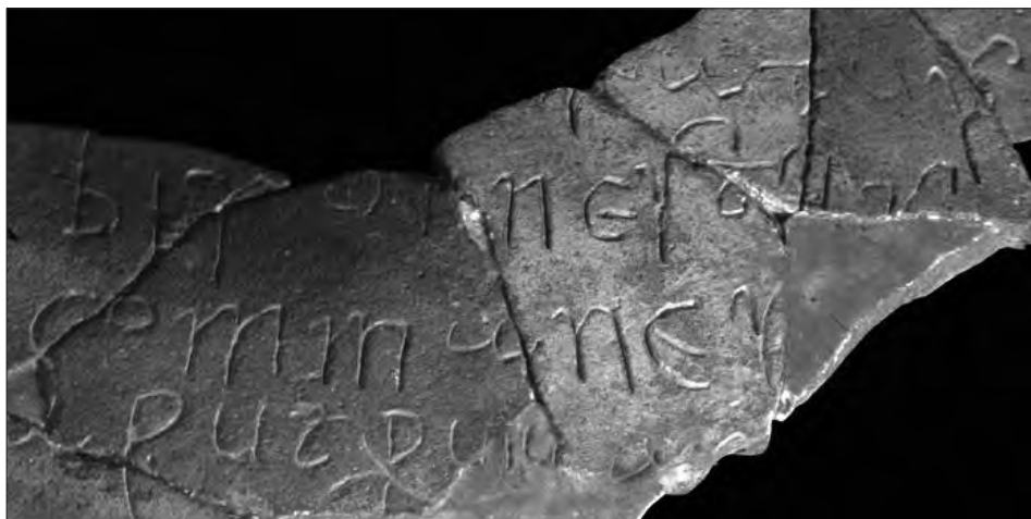
Fig. 5. Reconstrucción hipotética de la última línea del grafito de Fontcalent

cucharillas como la de Terrugem (Elvas, Portalegre) en la que se lee Aelias vivas in Christo 31 , u otros objetos. Es posible que el mensaje del recipiente de Fontcalent y el de los anillos cumplan la misma función, quizá el deseo de la comunidad cristiana de que el difunto alcance la gloria.