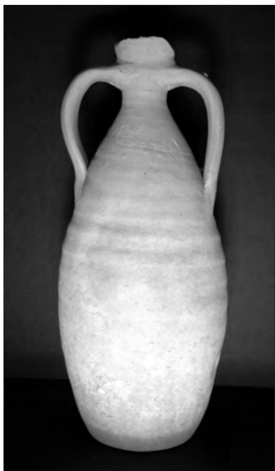
Fig. 1. Olmedilla de Alarcón (Cuenca). Jarra de barro.