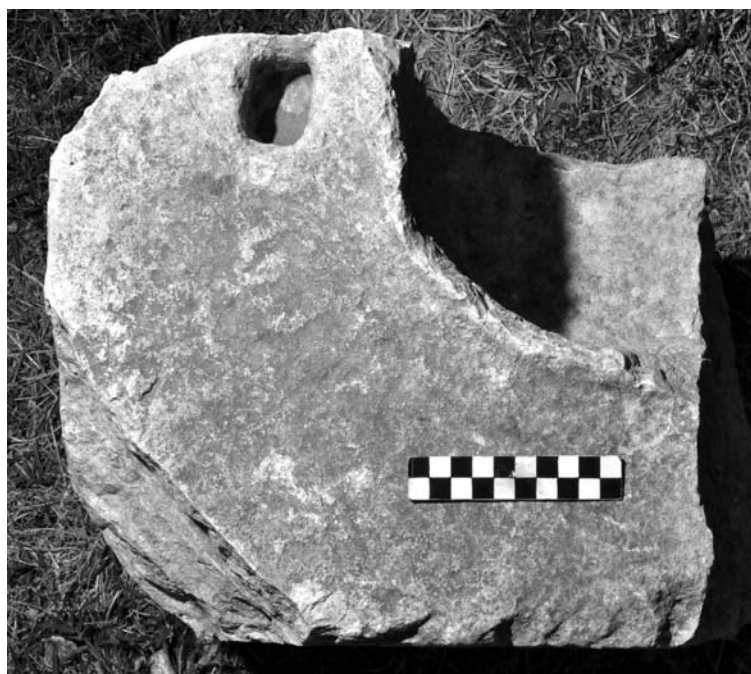
Fig. 2. Frammento di cinerario, visione dall'alto