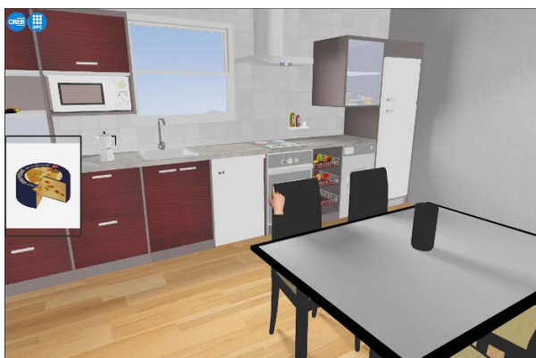
FIGURA 3. Una vista de l'entorn virtual del test de detecció precoç de deteriorament cognitiu Smart Ageing.

Finalment, la ludificació de l'ensenyament clínic i l'ús de jocs de simulació en professions mèdiques s'estan popularitzant (Wang et al. , 2016). En aquest àmbit, els jocs aporten la possibilitat d'exposar-se a situacions crítiques, practicar habilitats transversals com les de comunicació i presa de decisió, i a la vegada adquirir o reforçar coneixements teòrics i pràctics. Per exemple, Virtual Perfusionist és un joc de simulació per practicar la tècnica de circulació extracorpòria en intervencions a cor parat (Bonet et al. , 2021) (vegeu la figura 4).