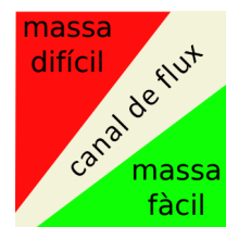
FIGURA 1. El canal de flux en el joc segons Koster (2013). A l'eix de les abscisses, el nivell de competència de l'usuari, i a l'eix de les ordenades, el nivell de dificultat del joc.

Altres teories relacionen jugar amb la necessitat de satisfer desitjos, encara que sigui de manera virtual. La teoria més simple es basa en quatre instints primaris: menjar, lluitar, fugir i reproduir-se. Certament, la fugida i la lluita són la base de nombroses trames reeixides de joc, des dels