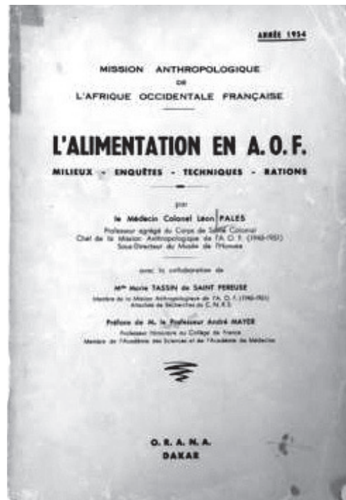
Portada del text sobre l'alimentació a l'AOF.